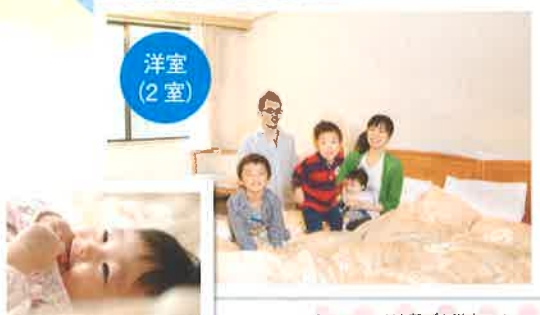
2つのベッドを繋げた洋室では、家族みんなで川の字で寝られます。