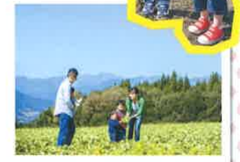
美しい山あい広がるレタス畑。雄大な風景の中で、家族の会話も弾みます。