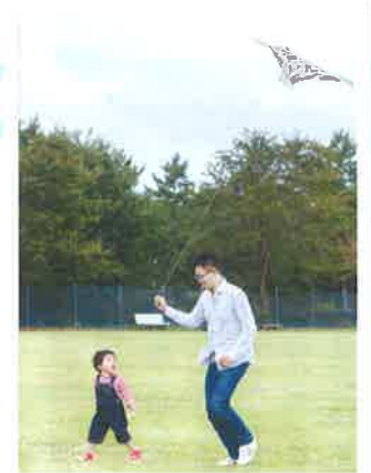
パパと一緒に芝生広場で風揚げ。

所在地: 昭和村糸井 5895 外 入園自由(無料) ※12月~3月末日は一部のトイレの使用ができなくなります。 お問い合わせ/ 昭和村役場