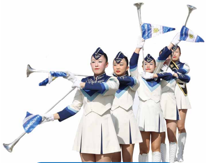
横浜市消防音楽隊・ 昭和中吹奏楽部のコラボ演奏

その後、横浜市消防音楽隊による規律の取れた力強い演奏が奏でられ、観客を魅了しました。演奏に合わせ、横浜市消防音楽隊ドリルチーム「ポートエンジェルス119」による寸分違わぬ華麗なパフォーマンスが披露されました。会場からは大きな拍手が送られました。