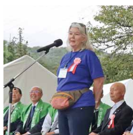
挨拶するカシー市長

国際姉妹都市であるアメリカ合衆国イーグルポイント市からカシー市長ほか関係者が秋まつりに出席しました。餅投げに参加するなど、友好交流を再確認しました。