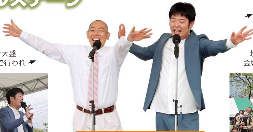
よしもお笑いライブ レギュラー

よしもお笑いライブのステージには「あるある探検隊」でおなじみのレギュラーの登場で大盛り上がり。8月に公民館で行われ