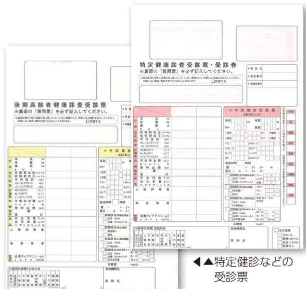
◀ 特定健診などの受診票