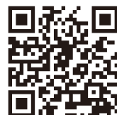
マイナポイント事業