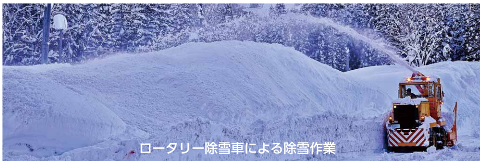
ロータリー除雪車による除雪作業

これから冬を迎えます。積雪時は、10センチメートル程度を目安に対象路線の除雪や砂まき作業を行います。村民の皆さんには、道路沿いの所有する竹木などが雪の重みで道路にはみ出さないよう、適切な管理をお願いします。