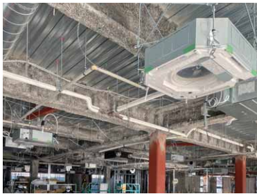
▲空調設備や配管の取り付け。