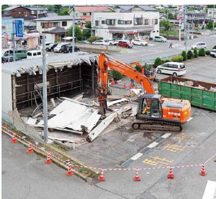
▲工事に支障となるバス車庫と玄関の一部を解体しました。