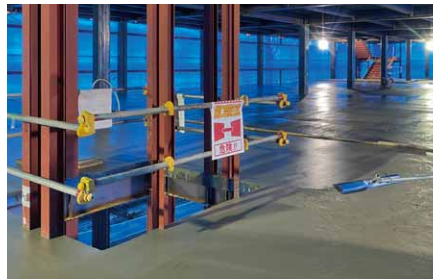
▲2階床のコンクリート打設。