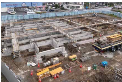
▲西側から基礎を造っていきます。