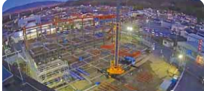
新庁舎建設タイムラプス