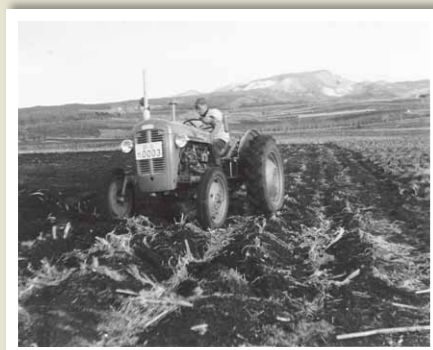
もう一つの開拓農協、赤城高原開拓農協(追分)で活躍した最初のトラクター。