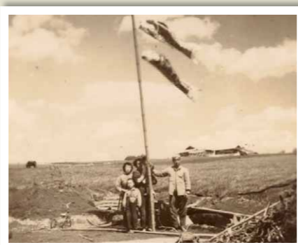
貧しく厳しい生活でも、こいのぼりをあげて子どもたちの健やかな成長を願った。