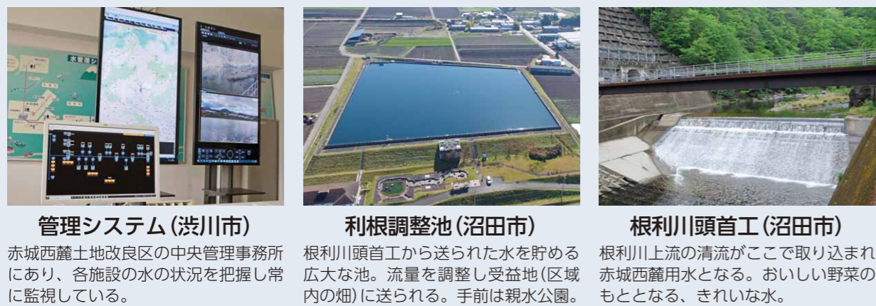
管理システム(渋川市)

赤城西麓土地改良区の中央管理事務所にあり、各施設の水の状況を把握し常に監視している。