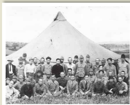
桐生市から入植した方々(桐生地区)は、市が寄贈したテントで共同生活していた。

希望をもって赤城の大地に入植した開拓者たち。彼らが現実と向き合ってきた事実は、昭和村の歴史そのものです。その歴史の一部を写真でご紹介します。