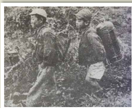
毎日遠くまで、生活のための湧水をくみに行くのは子どもたちの仕事だった。