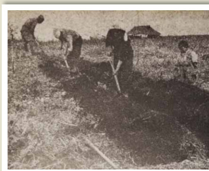
開拓初期の箱堀農法。原野を筋状に掘って左右にはねあげ、その上に種をまいた。