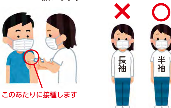
このあたりに接種します