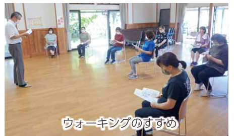
ウォーキングのすすめ