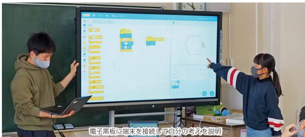
電子黒板に端末を接続して自分の考えを説明

やしていくことで、多角形が徐々に円に近づいていくことを知ったほか、中には、中学校で習う角度の求め方に気づいた児童もいるなど、充実した授業となりました。