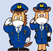
上州くん・みやまちゃん

最近、はがきをよく確認しないで日時、場所を間違えて受検・受講できない事態が多発しています。カレンダーなどに検査や講習の予定を書き込み、忘れないようにしましょう。