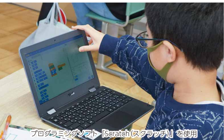
プログラミングソフト「Scratch(スクラッチ)」を使用