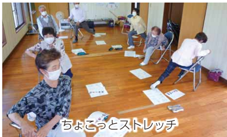
ちよこごとストレッチ