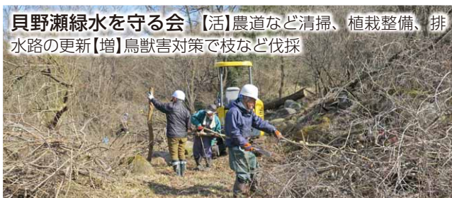
貝野瀬緑水を守る会 【活】農道など清掃、植栽整備、排水路の更新【増】鳥獣害対策で枝など伐採