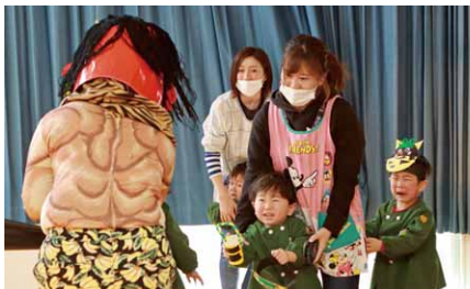
鬼に圧倒されつつも応戦

村内各保育園で、節分の豆まきを行いました。第二保育園では、園児たちが節分の歌を歌っているときに、迫力のある鬼が登場。園児たちは元気な声でいっせいに豆を投げ、鬼を退散させていました。