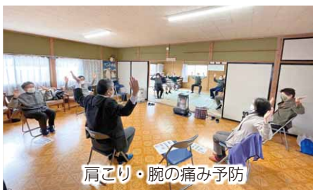
肩こり・腕の痛み予防