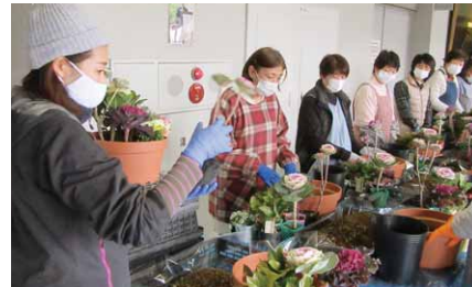
わかりやすい指導で寄せ植え

ひまわり大学で「冬の寄せ植え教室」が、池田種苗(株)から講師を招いて開催されました。この日は、冬ならではのガーデニングの楽しみとして、長く楽しんで美しい冬の花々を寄せ植えしました。