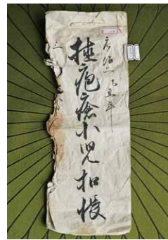
種痘瘡生小兒控帳

た。元治二年(一八六五)当時の控帳が資料として現存しており、内容は次のとおりです。