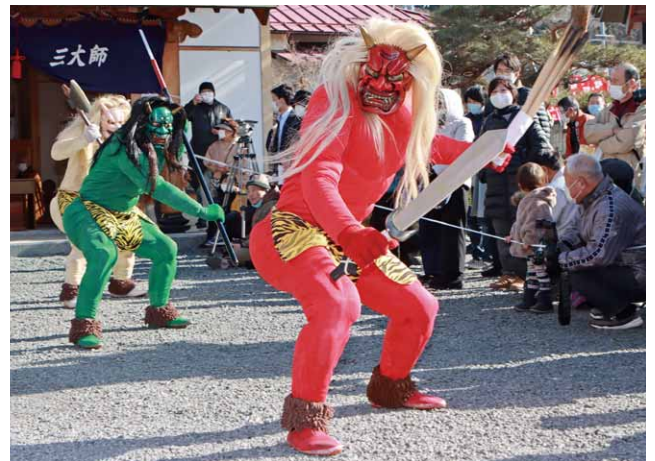
境内を練り歩く鬼たち

コロナ禍のため、今年は規模を縮小しての開催となった節分会。鬼踊りには、開運だけでなく新型コロナウイルス退散への願いも込めて行われていました。