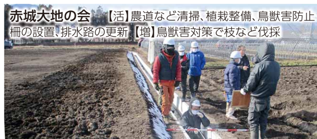
赤城大地の会 【活】農道など清掃、植栽整備、鳥獣害防止柵の設置、排水路の更新【増】鳥獣害対策で枝など伐採