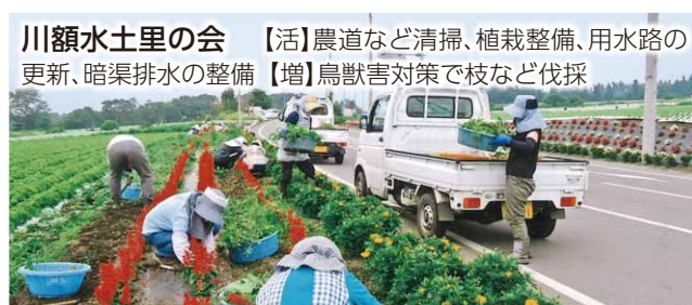
川額水土里の会 【活】農道など清掃、植栽整備、用水路の更新、暗渠排水の整備【増】鳥獣害対策で枝など伐採