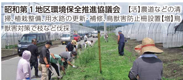
昭和第1地区環境保全推進協議会 【活】農道などの清掃、植栽整備、用水路の更新・補修、鳥獣害防止柵設置【増】鳥獣害対策で枝など伐採

※令和2年度の各団体の活動について、【活】は活動実績を、【増】は増進活動の実績を表しています。