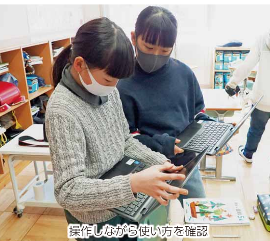
操作しながら使い方を確認