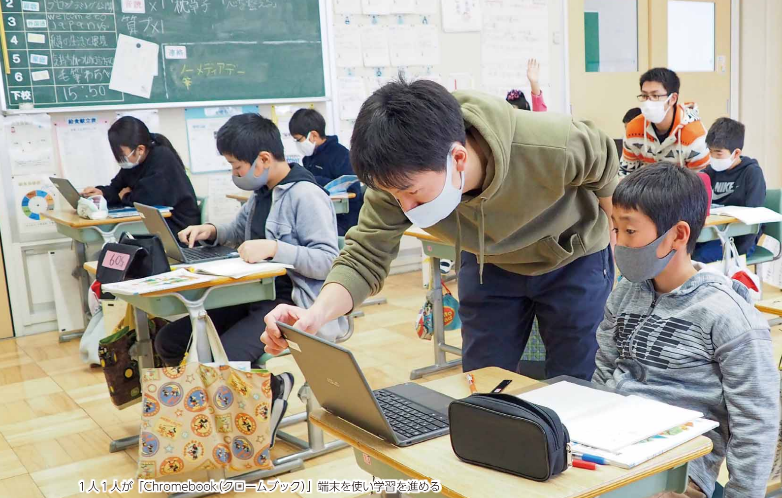
1人1人が「Chromebook(クロームブック)」端末を使い学習を進める