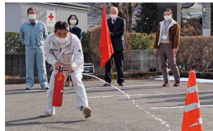
消火の際は火元の下部を狙って

村公民館で消防避難訓練が行われました。訓練では、工芸実習室の石油ストーブからの出火を想定。職員は逃げ遅れた人がいないか確認し屋外に避難しました。この後、消火器の正しい使い方も確認しました。