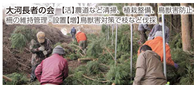
大河長者の会 【活】農道など清掃、植栽整備、鳥獣害防止柵の維持管理・設置【増】鳥獣害対策で枝など伐採