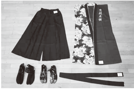
事業で整備した衣装

この事業は、宝くじの普及と広報を目的に、宝くじの収益を財源として、(一財)自治総合センターが地域の住民組