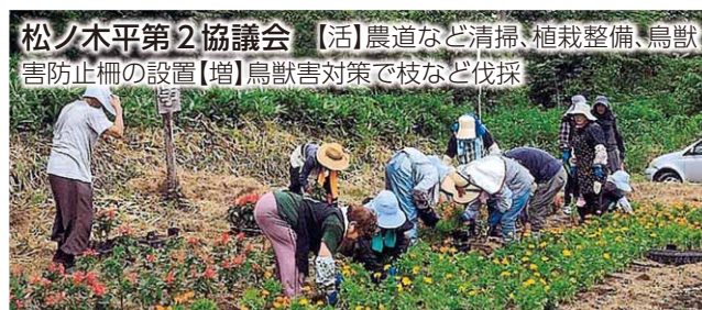
松ノ木平第2協議会 【活】農道など清掃、植栽整備、鳥獣害防止柵の設置【増】鳥獣害対策で枝など伐採