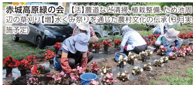
赤城高原緑の会 【活】農道など清掃、植栽整備、ため池周辺の草刈り【増】水くみ祭りを通じた農村文化の伝承(3月実施予定)