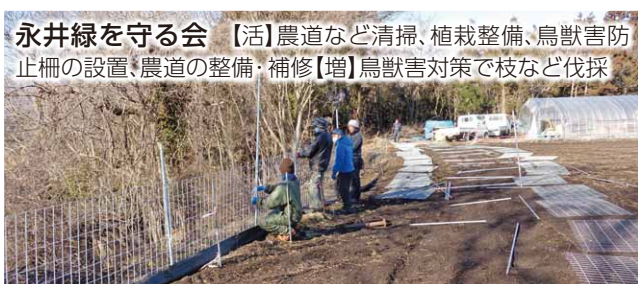
永井緑を守る会 【活】農道など清掃、植栽整備、鳥獣害防止柵の設置、農道の整備・補修【増】鳥獣害対策で枝など伐採