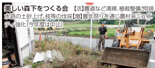
美しい森下をつくる会 【活】農道など清掃、植栽整備、用排水路の土砂上げ、枝等の伐採【増】豊年祭りを通じ農村コミュニティ強化(今年度は中止)