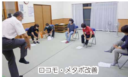
ロコモ・メタボ改善