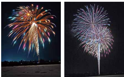
夜空を彩った花火(大河原地区で撮影)

大河原、追分、赤谷の各地区で同時にサプライズの花火が上がり、夜空と残雪を照らしました。この花火は、新型コロナウイルスが収束し、これまでの日常生活が早く戻るようお願いが込められたものです。