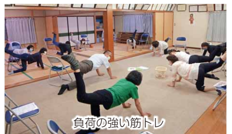
負荷の強い筋トレ