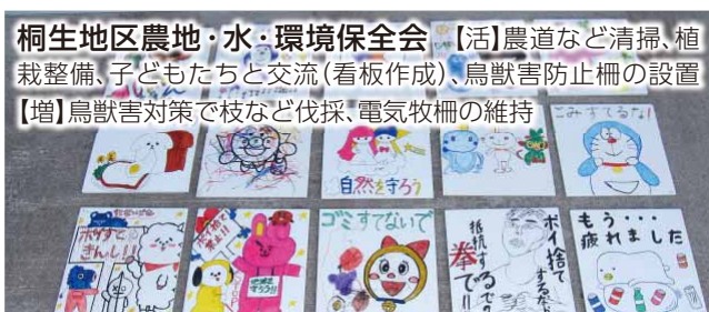
桐生地区農地・水・環境保全会 【活】農道など清掃、植栽整備、子どもたちと交流(看板作成)、鳥獣害防止柵の設置【増】鳥獣害対策で枝など伐採、電気牧柵の維持