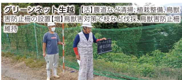
グリーンネット生越 【活】農道など清掃、植栽整備、鳥獣害防止柵の設置【増】鳥獣害対策で枝など伐採、鳥獣害防止柵維持