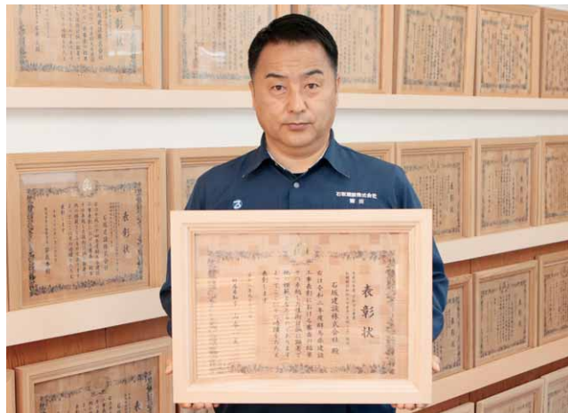
「これからも仕事で郷土に奉仕していければ」と諸田社長

諸田社長は「公共事業は村民の皆さんの大切な税金を使いますし、コロナ禍であってもより良い仕事で貢献したいとの思いでいます。社員や協力会社が妥協せず毎年取り組んできた結果、21年連続表彰をいただくことができました。村民の皆さんや関係官庁のご理解ご協力を心から感謝しています」と話していました。