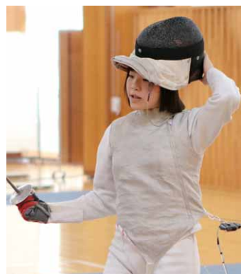
群馬県ジュニアフェンシング選手権大会・女子エペで優勝(写真中央は決勝戦)