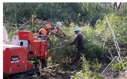
切った竹は粉碎機に

この日は、荒れてしまった竹林の手入れが4日目を迎え、同会の会員11人により作業開始。竹を切ってまとめ、その場で粉碎を行いました。