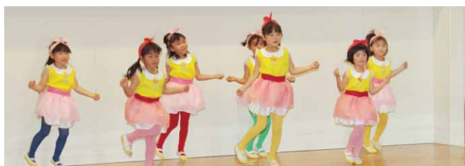
3歳児のイーブイマーチ(第一保育園・左上)、5歳児のMake You Happy(第二保育園・左下)、5歳児の西遊記(子育保育園・右)

第一保育園、第二保育園、子育保育園で、園児たちの発表会が行われました。今年は、感染防止対策のため、各園ともにクラスで時間や開催日を区切り、消毒や換気をするなどし開催。園児たちは、日ごろの練習の成果を発揮し、歌や合奏、おゆうぎなどを発表しました。