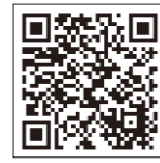
空家バンクのQRコード

ので、村のホームページ「空き家バンク」に登録し、借り手や買い手を募ってみてはいかがでしょうか。 https://www.vill.showa.gunma.jp/kurashi/kurashi/jutaku/ ▼問合せ 企画課広報統計係 ☎24-5111 (内線141) ▼問合せ 企画課広報統計係 ☎24-5111 (内線141) 沼田税務署確定申告相談 ▼会場 沼田税務署2階会議室(沼田市東原新町1910-1-2) ▼開設期間 2月1日(月)～3月15日(月) ※土日および祝日を除く ▼相談受付 午前8時30分～午後4時(提出は午後5時まで) ▼相談開始 午前9時 ▼その他 ①申告の作成には時間を要しますので早めにお越しください。 ②確定申告会場の混雑緩和のため、時間をずらして来場をお願いすることがあります。 ③午後2時頃までに受付を済ませていただくよう、ご協力をお願いします。相談が午後5時を過ぎる場合は、再度お