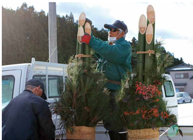
門松を制作する清流の会の皆さん

2日間にわたって行われた作業には、会員15人ほどが集まって行われ、完成した門松は村社会福祉協議会や特別養護老人ホーム菜の花館など、村内外26カ所で飾られ装い新たに新年を迎えました。