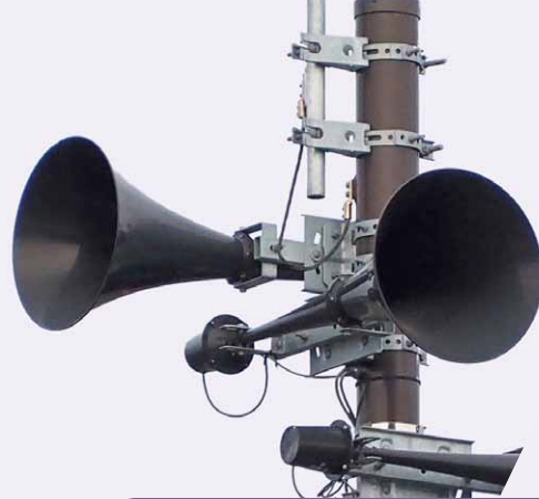
昭和村テレドーム