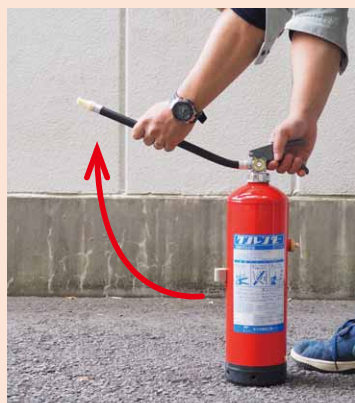
ノズルを火元に向ける