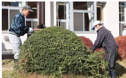
庭木を剪定する清流の会の皆さん

また、この日は同校の学校評議員の方々も草刈り作業を行い、校庭の隅々まできれいになりました。