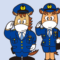
上州くん・みやまちゃん

交通事故が起きれば、楽しい時間が台無しになってしまいます。飲酒運転による悲惨な交通事故を防止しましょう。