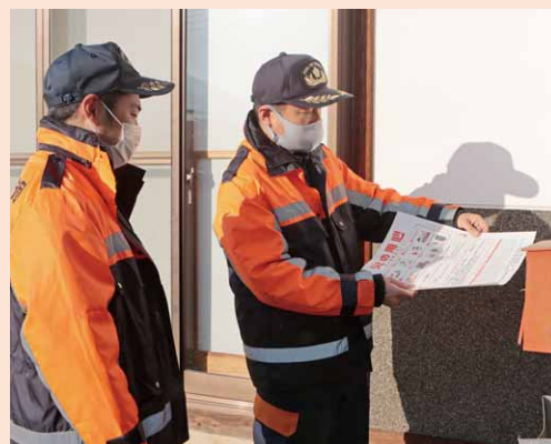
火の用心を呼びかけるチラシを配布

万一、火災が発生したら大きな声で叫び、火事であることを周りに知らせるとともに、可能であれば初期消火を試みます。火が背の高さより小さい場合は、消火器での消火が有効です。消火器は、必ず退路である出口を背にして、火元へ向かってほうきで掃くような動きで、徐々に近づいていきましよう。天井に火が回ってしまったら、消火をあきらめ素早く避難しましょう。避難路をあらかじめ確認しておくことも大切です。