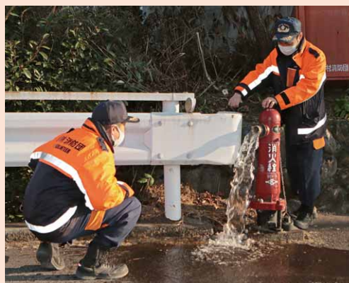
消防水利(消火栓)の点検