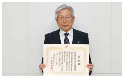
表彰状を手にする布施会長