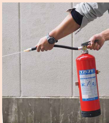
レバーを握って消火剤を放射