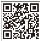
雨量監視システム