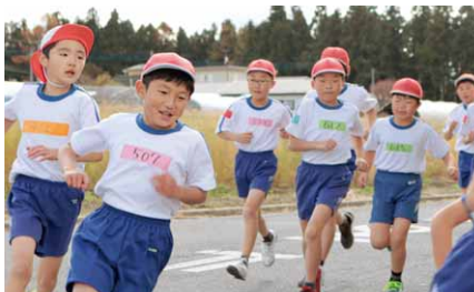
元気に駆け抜ける子どもたち

この日は肌寒い一日となりましたが、子どもたちは寒さを吹き飛ばすような元気いっぱいの走りをみせ、健脚を競いました。