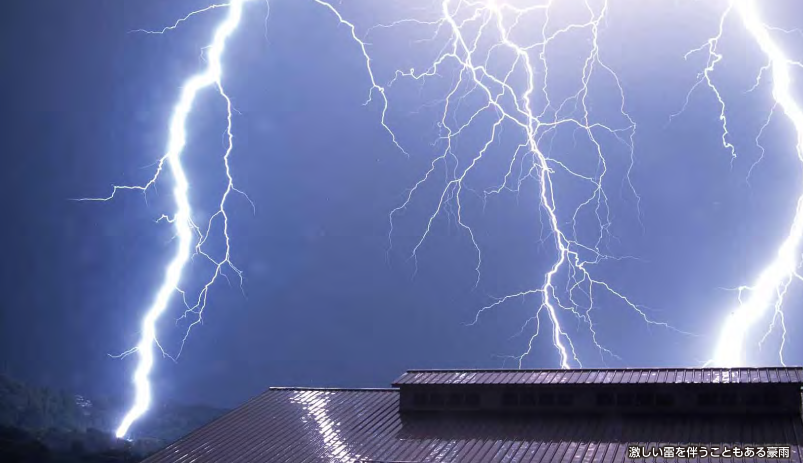
激しい雷を伴うこともある豪雨