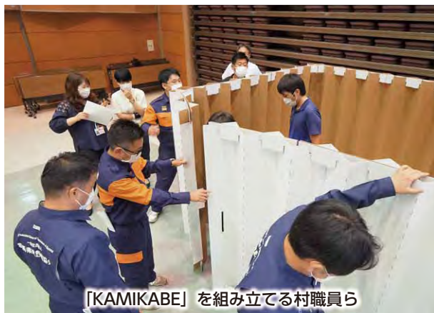
「KAMIKABE」を組み立てる村職員ら