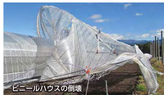
ビニールハウスの倒壊