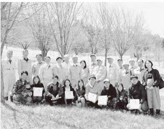
記念植樹に参加した5組の新婚さん

よそ20人が5組の新婚さんとともに桜の植樹を行いお祝いしました。平成14年より毎年行われている記念植樹の桜は合計154本となりました。