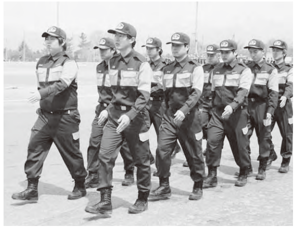
基本動作を確認する新入団員