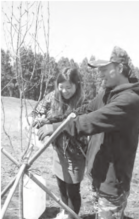
夫婦で協力し植樹

よそ20人が5組の新婚さんとともに桜の植樹を行いお祝いしました。平成14年より毎年行われている記念植樹の桜は合計154本となりました。