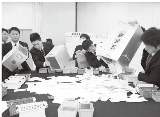
役場で行われた開票作業