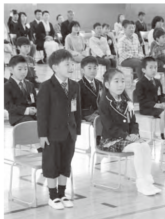
式に臨む新入生(東小)