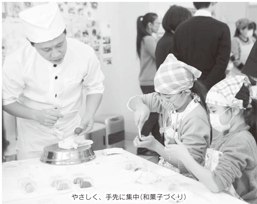
やさしく、手先に集中(和菓子づくり)

いずれの教室でも、体験に取り組む子どもたちの真剣なまなざしと、完成した喜びを感じられる場となりました。