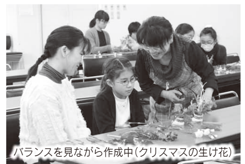
バランスを見ながら作成中(クリスマスの生け花)