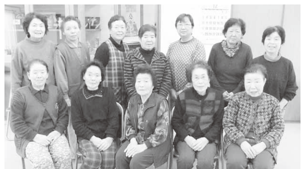
「みんないい人」「仲良し♪」と笑顔の皆さん

・集まって体操すれば手も足も上げられる・体にいいと思う・楽しいから集まる・いつも笑っている・歌が楽しい・おしゃべりが楽しい・色々なニュースが入ってくるなど