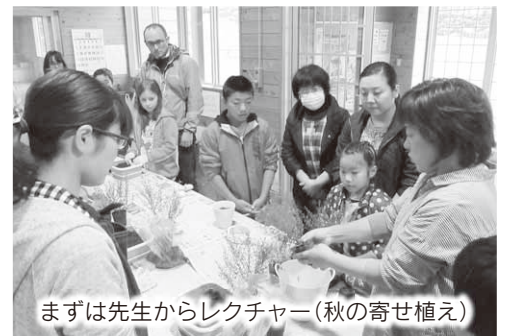
まずは先生からレクチャー(秋の寄せ植え)