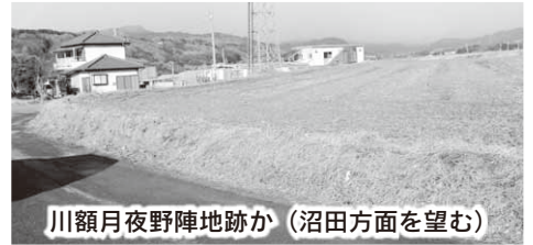
川額月夜野陣地跡か (沼田方面を望む)