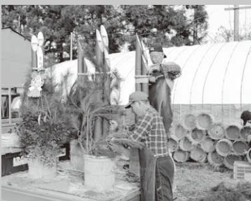
手際よく作られていく門松

完成した門松は、村内の神社やお寺、役場などの公共施設、総合福祉センター「昭和の湯」に飾られ装い新たに新年を迎えました。