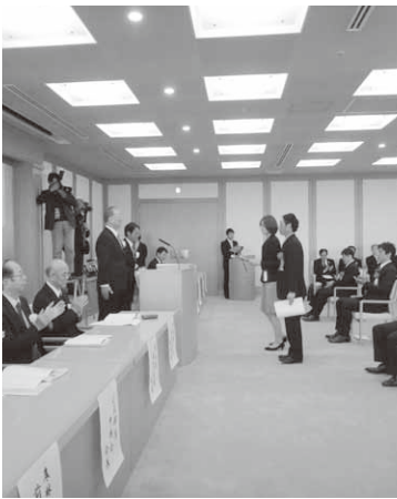
県庁で行われた表彰式