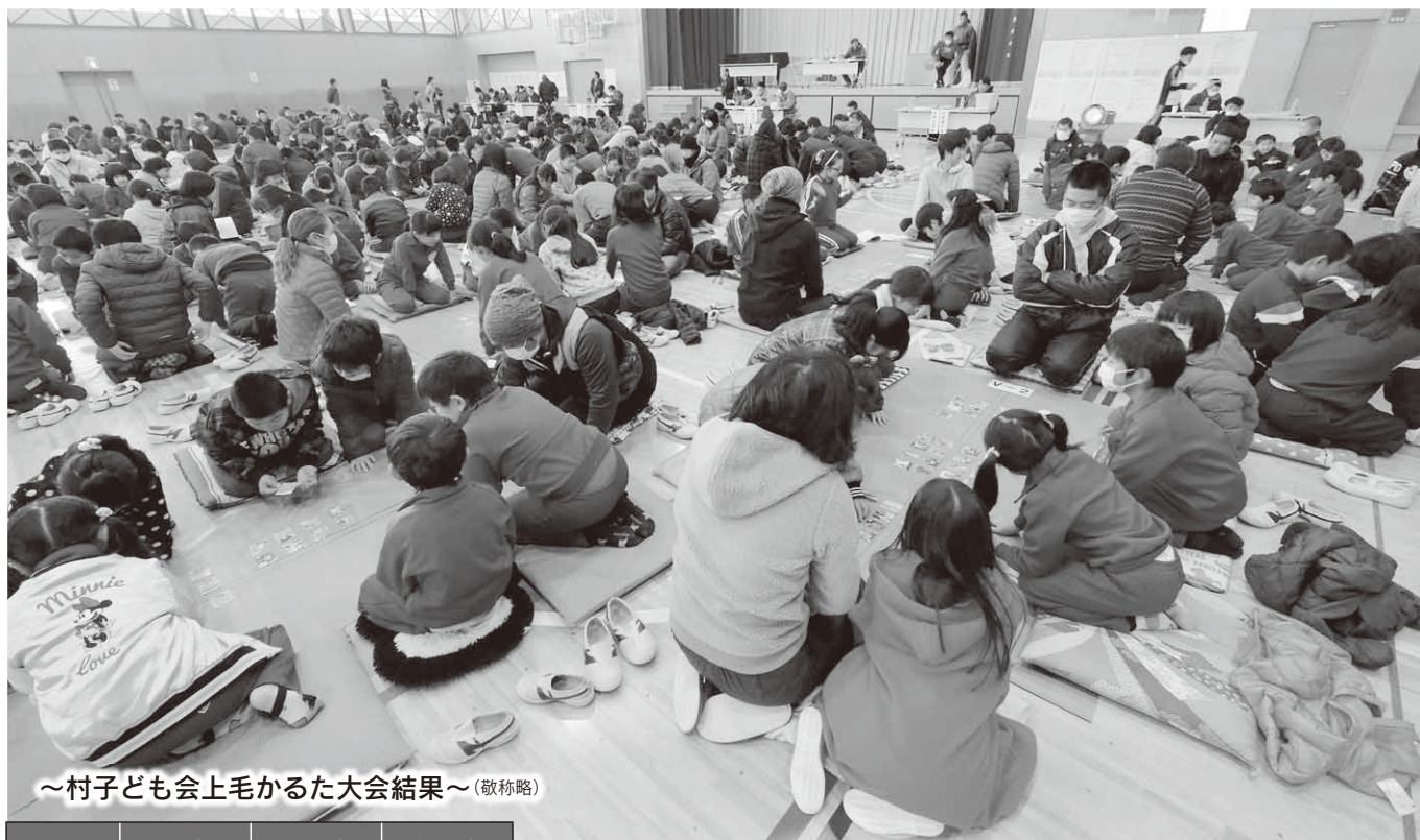
～村子ども会上毛かるた大会結果～(敬称略)