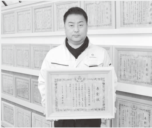
表彰状を手にする諸田社長