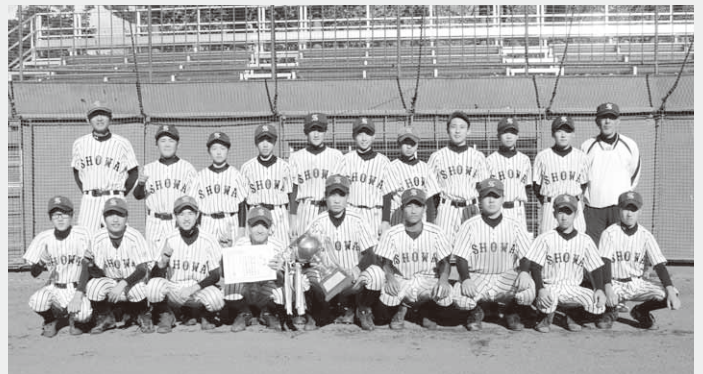
優勝した昭和中ナイン

第25回利根沼田新人強化野球大会が10月28日と11月11日に行われ、昭和中野球部が優勝に輝きました。