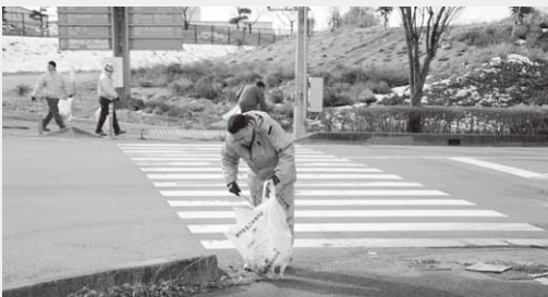
清掃活動に汗を流す4社企業の皆さん

この日は13人が参加し、午前10時から昭和インター線沿いのおよそ3kmの道のりのごみ拾いに汗を流しました。