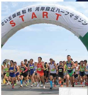
◀「第1回やさい王国昭和村河岸段丘ハーフマラソン」開催 (2015年5月)