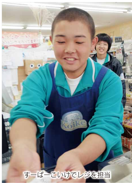
すーぱーこいけでレジを担当

生徒たちが職場を選んだ理由は「将来なりたい職業」や「興味があつたから」などさまざま。職場体験の感想では「不安もあつたけれど、仕事を体験してみてもよかつた」や「はじめは大変だつたけれど、仕事に慣れてきたら楽しい」など、初めて接する仕事と、普段接することの少ない働く人たちとの交流を通して、仕事の楽しさや厳しさなどを学んでいました。