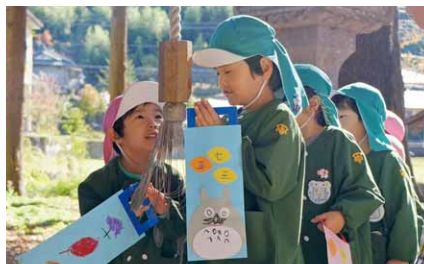
お参りする園児たち(第一保育園)

第一・第二の各保育園の園児たちが七五三のお参りを行いました。第一保育園では園児たちが小高神社にお参りにでかけました。年長児は年少児の手を引き、順番に仲良くお参りをしていました。