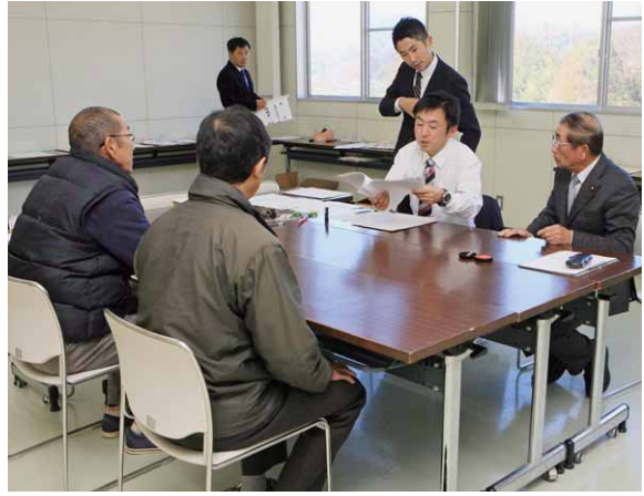
立候補の受付を行う村選挙管理委員会