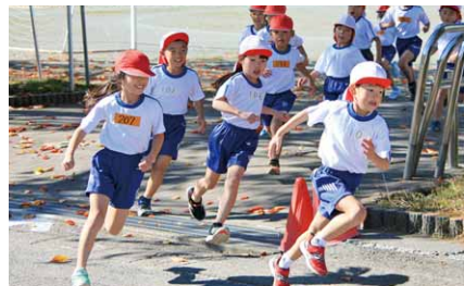
快走する子どもたち(大河原小)

村内各小学校では10月から11月にかけて校内マラソン大会を行いました。大河原小学校では10月30日に実施。当日は暖かなマラソン日和となり、保護者が見守る中、子どもたちは元気に走っていました。