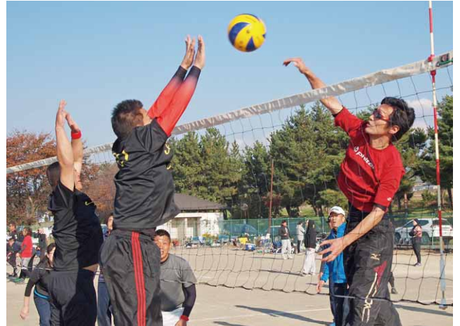
熱戦を繰り広げる参加者

▶各部門の優勝チーム Aの部：虜A、Bの部：ピーナッツ、Cの部：滝寺スターズ、Dの部：選抜チーム、ソフトバレーの部：昭和中野球クラブ