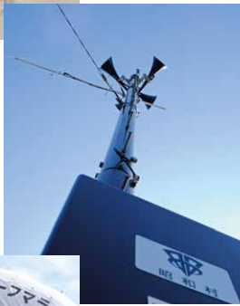
固定系防災行政無線が開局▶ (2016年3月)