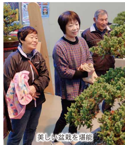
美しい盆栽を堪能