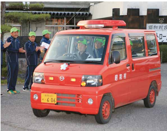
出発するパトロール隊の皆さん