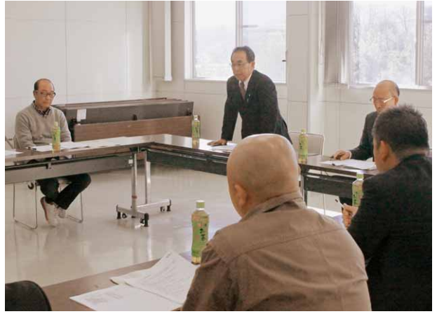
活発な意見が出された協議会