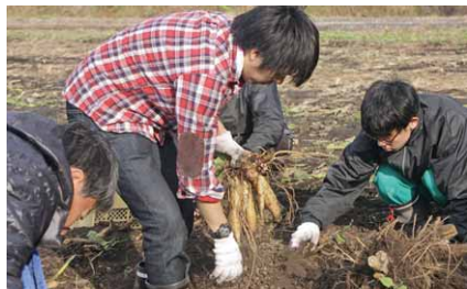
商工会職員らによる収穫作業

全国の幼児教室「ミキハウスキッズパル」の食育を支える「キッズパルファーム」の収穫祭が、道の駅あぐりーむ昭和の農園で行われました。収穫されたヤーコンとサツマイモは全国の幼児たちに届けられました。