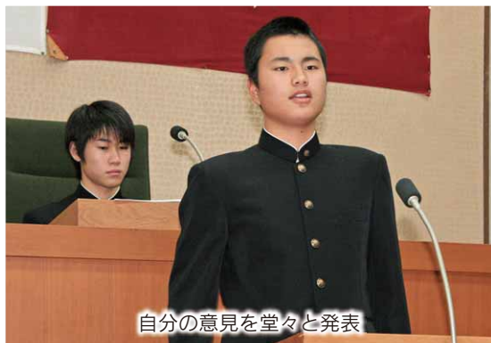
自分の意見を堂々と発表