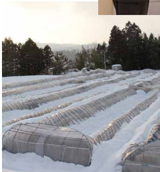
◀記録的な大雪で甚大な被害 (2014年2月)