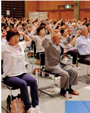
◀地域のサロンとともに「らくらく筋トレ」が10周年 (2017年9月)

昭和村は、11月1日で施行60周年を迎えました。ここでは、これまでの村の10年の歩みを写真でふりかえります。次の10年、次の世代を見越した村づくりを、これからも目指していきます。