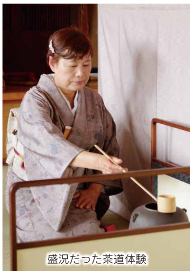
盛況だった茶道体験

また、この文化祭に合わせて、ひまわり大学が開催され、株式会社虎屋を講師に招いた「製造実演会と和菓子作り教室」が行われました。受講者は、目で見て味わって楽しめる秋の味覚を堪能していました。文化祭には2日間で延べ1,400人が来場。子どもから大人まで展示や体験を楽しんでいました。