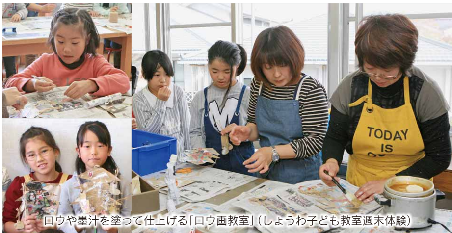
ロウや墨汁を塗って仕上げる「ロウ画教室」(しょうわ子ども教室週末体験)