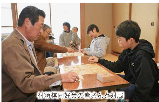
村将棋同好会の皆さんと対局