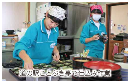
道の駅ことぶき亭で仕込み作業