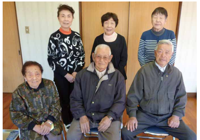
「長く続けることが大事!」と頑張る皆さん