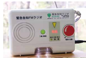
◀緊急告知FMラジオ運用開始 (2009年4月)