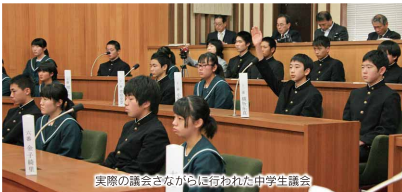
実際の議会さながらに行われた中学生議会