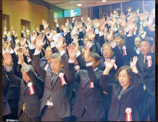
昭和村の節目を祝い万歳三唱