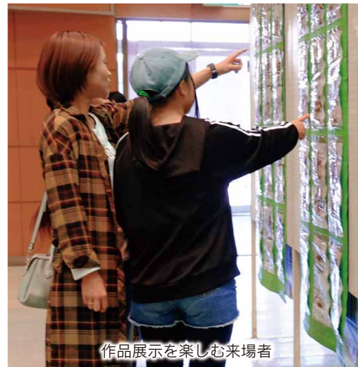
作品展示を楽しむ来場者