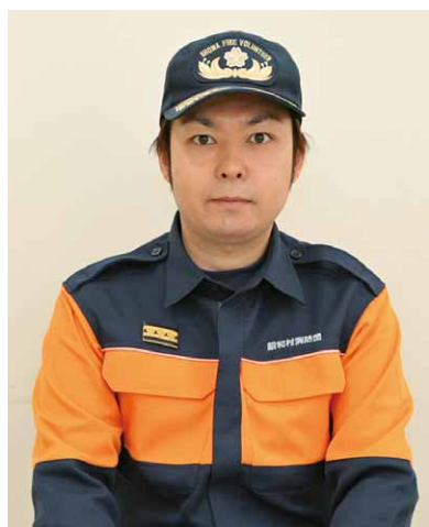
第7分団 (管轄:糸井地区)