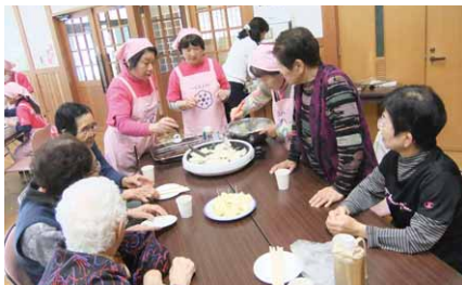
シニアカフェで交流を楽しむ皆さん

村ヘルスマイト主催の第2回シニアカフェが地域活性化センターで開かれ、地域の人々が集いました。参加者は、ヘルスマイトの皆さんが用意した、手作りの飲み物や料理などを食べながら交流を楽しみました。