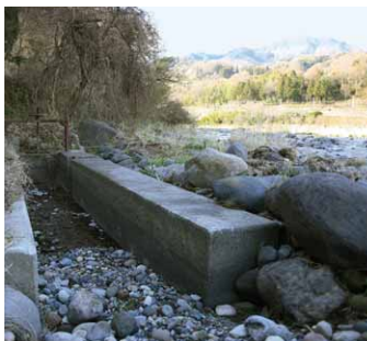
片品川に今も残る取水口