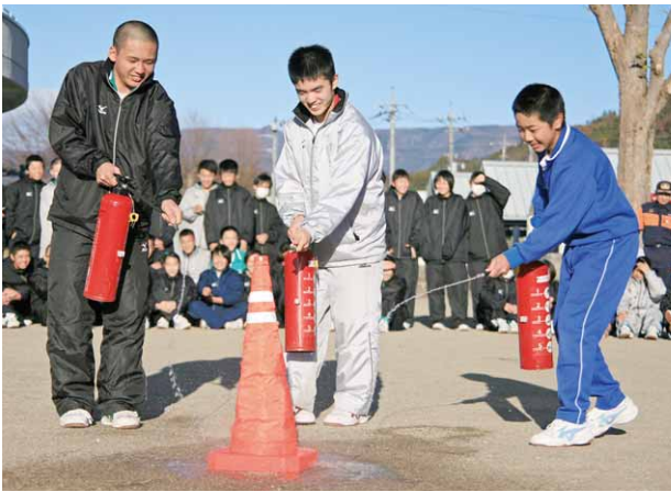
消火器訓練を行う生徒たち(昭和中学校)

授業を行っている教室から安全な校庭へ素早く避難しました。訓練後は、代表の生徒たちが消火器訓練を実施し、その取り扱いを学んでいました。