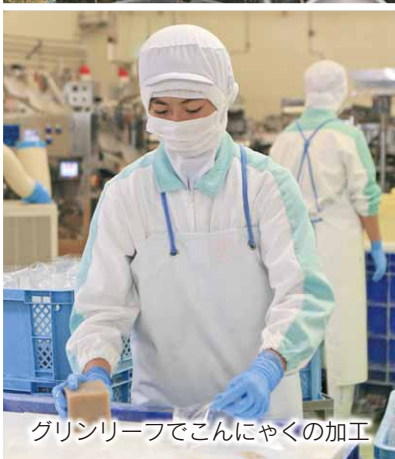
グリーンリーフでこんにやくの加工