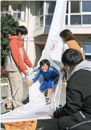
救助袋で屋上から脱出(大河原小学校)

授業を行っている教室から安全な校庭へ素早く避難しました。訓練後は、代表の生徒たちが消火器訓練を実施し、その取り扱いを学んでいました。