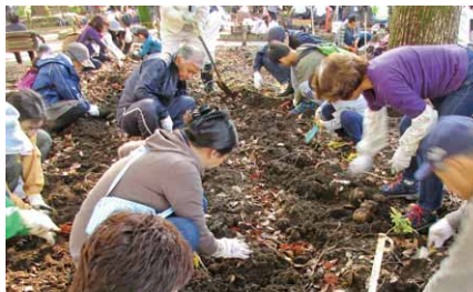
こんにやく芋を掘る参加者

村は横浜市との交流事業の一環として、横浜公園でこんにやく芋掘りイベントを行いました。5回目となった今年は、公募により集まった横浜市民が参加。掘り取り作業の後は、こんにやく作り実演も行われました。