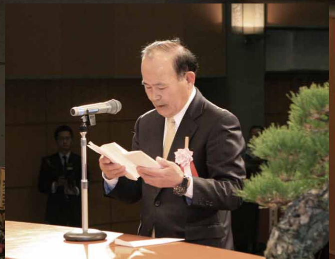
治田氏より受賞者代表謝辞