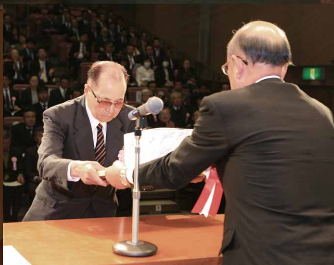
109人の功労者を表彰