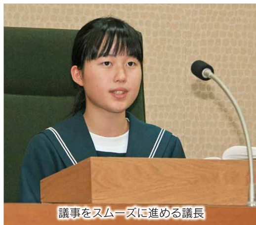
議事をスムーズに進める議長

昭和中学校3年生による中学生議会が11月13日、村役場の議場で行われました。この議会は、生徒たちが実際に議会を体験することで、村政に関心を持つてもらい地方自治の仕組みを知ってもらおうと毎年行われており、今年で14年目。