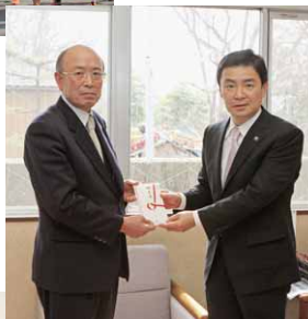
取手市はじめ各団体から御見舞金寄せられる▶ (2014年3月)