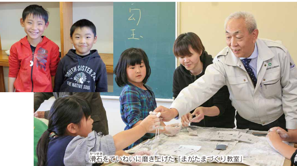
かっせき 滑石をていねいに磨き上げた「まがたまづくり教室」