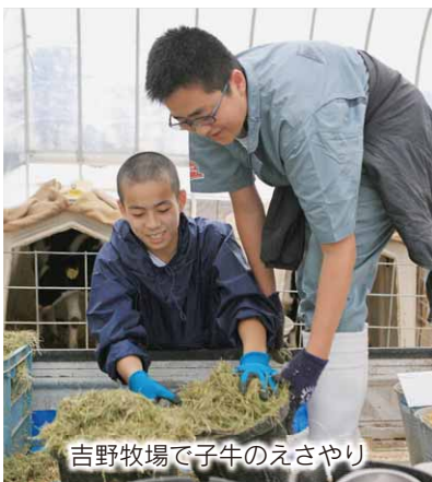
吉野牧場で子牛のえさやり