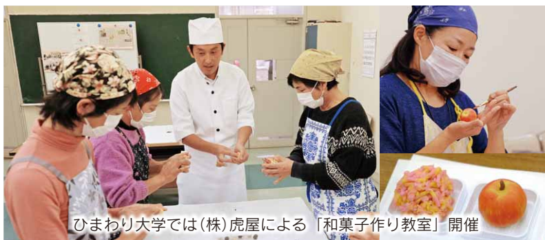
ひまわり大学では(株)虎屋による「和菓子作り教室」開催