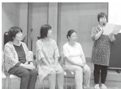
サロン紹介をする ハッピークラブの皆さん

サロン紹介の後は、うすねニューススポーツクラブの指導員の方にラジオ体操を教えていただき、ラジオ体操の曲がかかると自然に体が動き、楽しい時間を過ごしました。