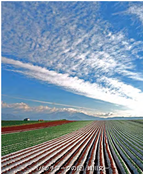
『パッチワークの丘』 峰川文一

フェイスブックページ「日本の美しい村」で紹介された昭和村の風景に対する反応 (9月1日現在)