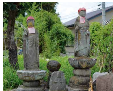
糸井吹張のお地藏さま

これはお地藏さまが子供を守ってくれるので、自分の子供が元気に育つようにとの願いをこめて、「よだれかけ」やお供え物を納めるのです。このようなお地藏さまが子供を守ってくれることに関係する話に、古くから伝わっている「賽の河原」の話があります。小さいうちに亡くなった子供が、賽の河原(三途の川)の岸辺で、父母の供養のために石を積み上げている、すると鬼が来て石の塔を壊してしまいます。その時あらわれて救ってくれるのが地藏菩薩です。お地藏さまに赤いものが納められています。赤は太陽の色、魔除けなどから選ばれたもので、人々の安寧を静かに見守っていてくれるのがお地藏さまです。