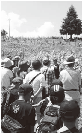
奥利根ワイナリーを見学

このツアーは、平成24年に村と友好交流協定を締結した玉村町が、交流をより活発にするため毎年実施しており、当日は同町の大人や子どもなど、28人が参加。参加者らは、道の駅「あぐりーむ昭和」によるレタスの収穫体験や餅つき、奥利根ワイナリーの見学や食事、桜桃園でのさくらんぼ狩りなど、村での一日を満喫