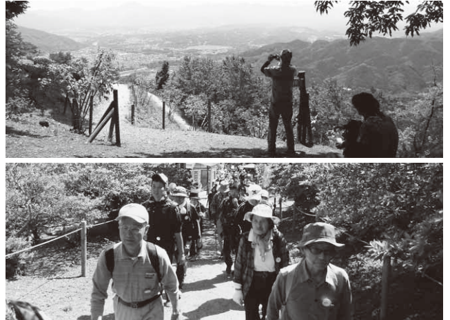
上：宝登山からの見事な眺望／下：ウォーキングを楽しむ参加者

宝登山は標高497メートル、山麓には宝登山神社を擁し、眼下には周辺の山々や田園風景が広がっており、参加者は見事な眺望と、ウォーキングによる心地よい汗を流していました。