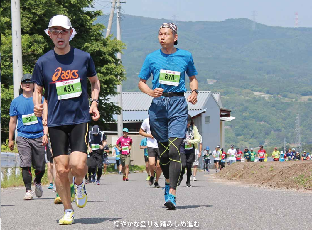
緩やかな登りを踏みしめ進む

風光明媚でおもてなし最高 地元の方が熱心に取り組んで いらっしやるのが伝わってくる、 とても素敵な大会です。コース はハードな反面、標高が上がっ てくると遠くの山々の風景が素 晴らしく楽しめるコースです。 沿道からの声援、コース脇に置 かれている応援メッセージにも 和みます。第2回から継続して 参加、もちろん第5回も参加し たいです。