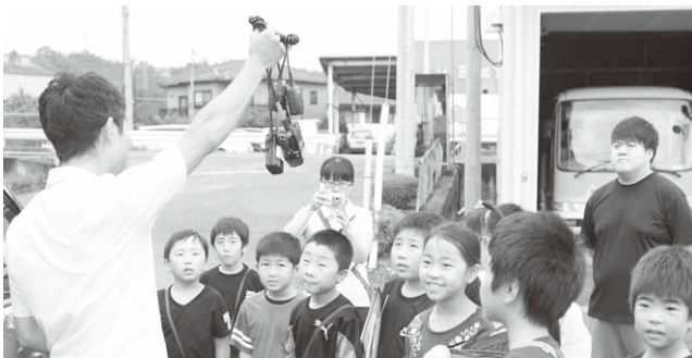
無線機の説明を聞く子どもたち

大河原小学校の3年生16名が役場を訪れ、役場の仕事などを見学しました。消防団の紹介では、実際に無線機を使った交信を体験。自分や友達の声が電波に乗って飛んでいく様子に驚いていました。