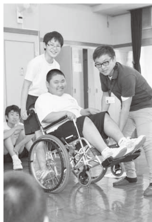
車イスを実際に体験

昭和中学校では6月26日、1年生を対象に「認知症サポーター養成講座」や、「車イスで困っている人がいたら、自分たちに何ができるかを考える授業」が行