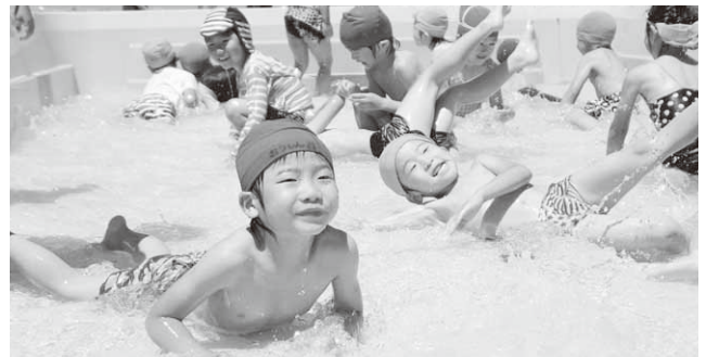
プール遊びを楽しむ園児たち

村内保育園のトップを切って子育て保育園でプール開きが行われました。当日は晴れ、絶好のプール日和。園児たちは待ちに待ったプールに入り、気持ちよさに歓声を上げながら、思い思いに水遊びを楽しみました。