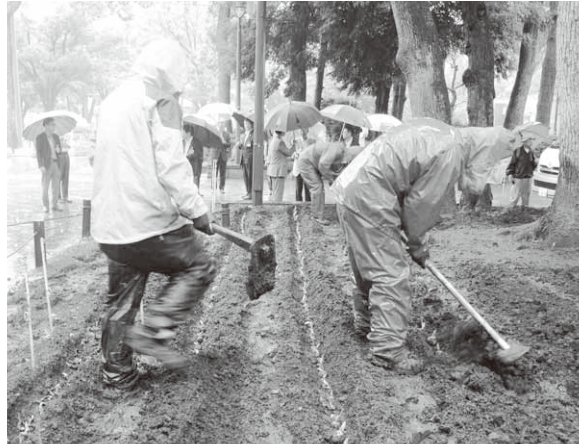
横浜公園で雨の中行われた植付け