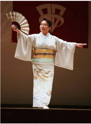
見事な舞踊や民謡を披露した文化協会所属団体の皆さん