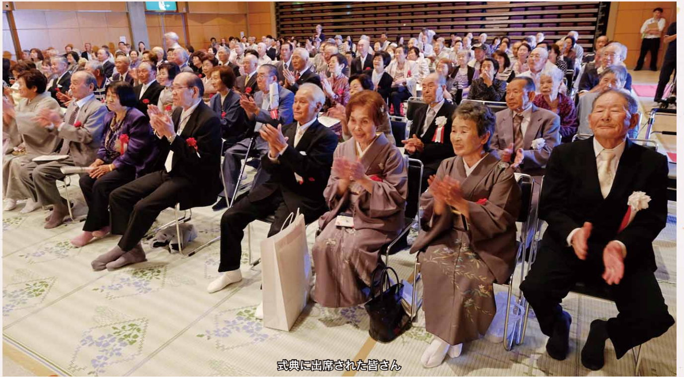
式典に出席された皆さん