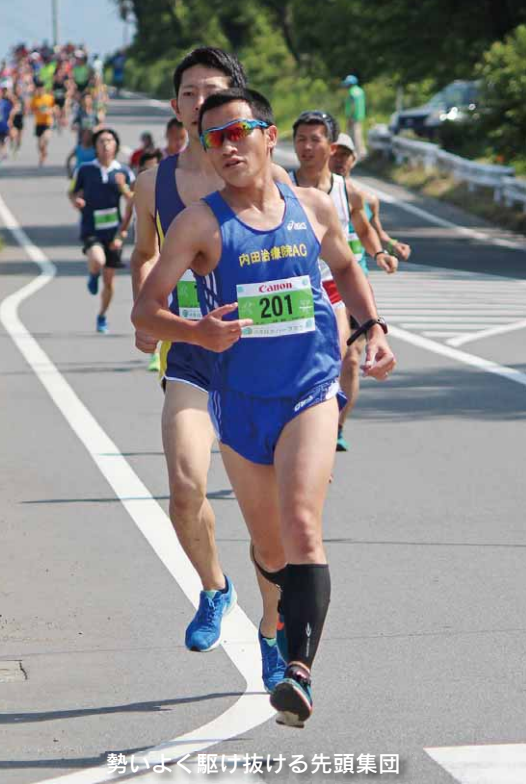
勢いよく駆け抜ける先頭集団