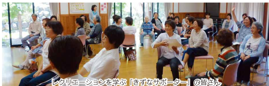
レクリエーションを学ぶ「きずなサポーター」の皆さん