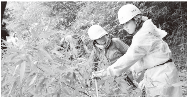
三ツ谷の竹林で伐採作業を行う参加者

大学生協などにより設立されたNPO法人樹恩ネットワークの「霧の高原森林の楽校2018夏」が村内で開催されました。県内外から学生や社会人ら22名が参加。森林作業や農作業に汗を流しました。