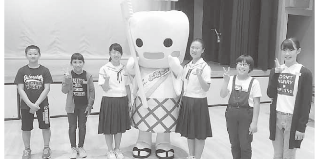
コンクールに出席した児童生徒たち

第59回利根沼田地区よい歯のコンクールが沼田市中心公民館で開かれました。村内からは、各小中学校から「よい歯の子」として選ばれた代表の児童生徒が参加し、よい歯を維持する大切さを再確認しました。