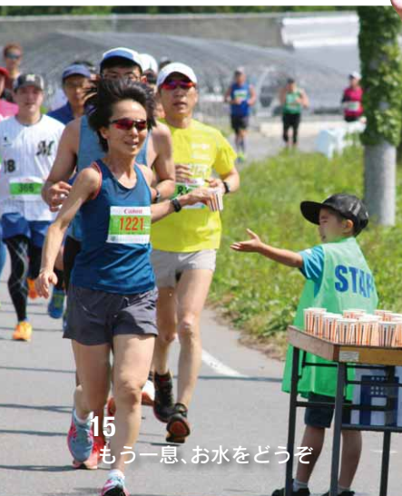
15 もう一息、お水をどうぞ