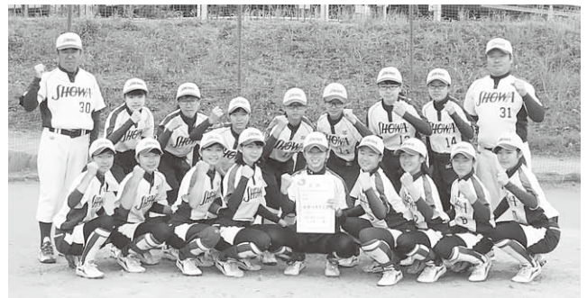
第三位と健闘した昭和中学校の選手の皆さん

渋川市阪東橋緑地公園で、第45回群馬県女子ソフトボール大会が開催されました。大会には、昭和中学校女子ソフトボール部をはじめ、県内の中学校から24チームが出場。熱戦が繰り広げられました。