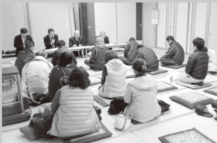
説明を聞く出席者(地域活性化センター)

村から、役場庁舎耐震化断の結果や、それを受けての現在の取り組みを説明しました。出席いただいた方々からは、これからの庁舎の在り方などについて意見があったほか、今後の見通しや費用などについて質問がありました。