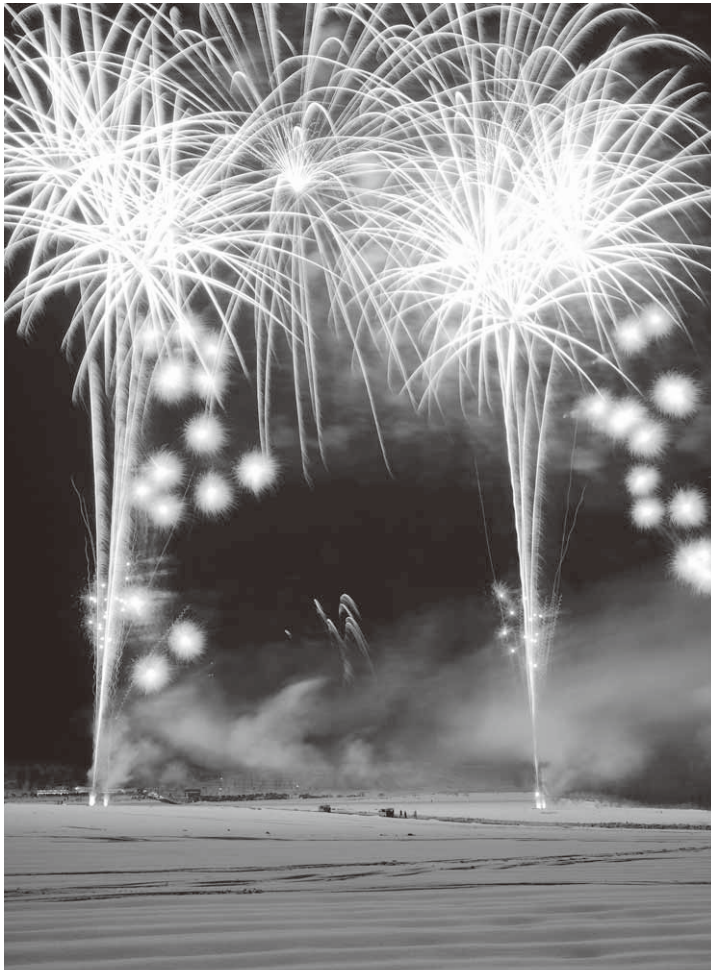
真冬の空に鮮やかに打ち上がった花火

そして、クライマックスの雪上火火は午後7時にスタート。上州花火工房による、県内初となる雪上地上花火や、ワイドスターマインなど彩り豊かな花火が40分間、にわたり打ち上がり、冬の昭和村の澄みわたった夜空を鮮やかに彩りました。