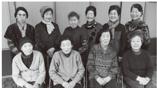
「良いこといっぱい!」と笑顔の皆さん