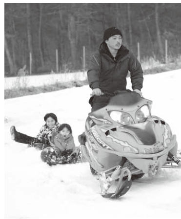
人気のスノーチュービング