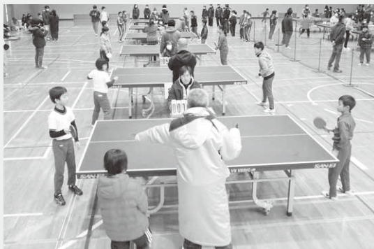
子どもたちが熱戦を繰り広げた卓球大会