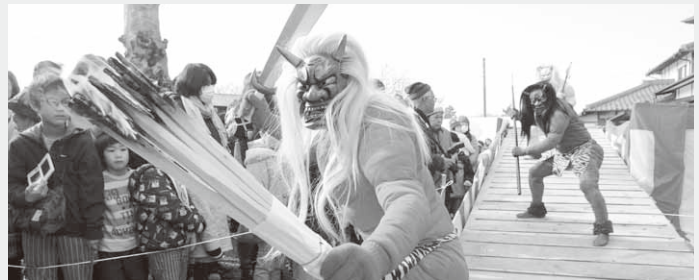
境内を練り歩く鬼法楽の鬼

遍照寺(森下)では2月3日、一年の無病息災を願う節分行事「昭和がん元ざん三大師節分会」が行われました。