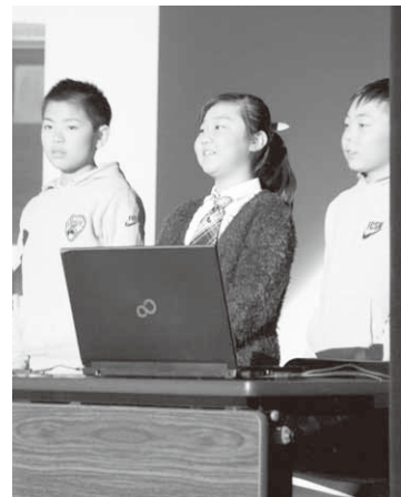
活動を発表した東小児童

第23回生涯学習大会が2月17日、公民館多目的ホールで開催されました。第1部では、1月12日に行われた「昭和村いじめ防止子ども会議」から、村内