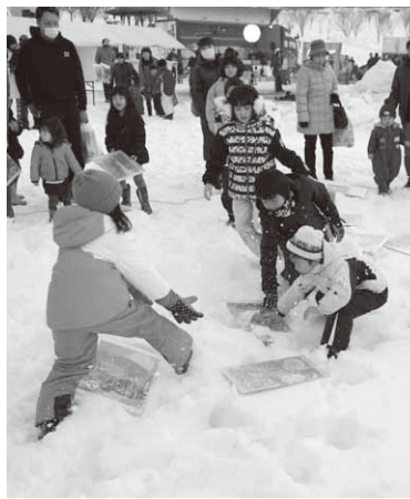
雪の上で元気に上毛かるた