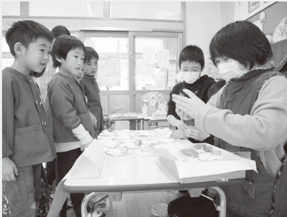
お兄さんお姉さんたちと楽しく交流