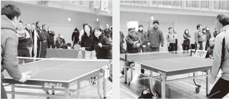
熱戦を繰り広げる参加者