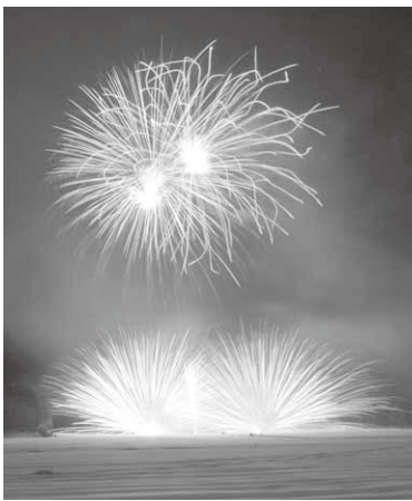
県内初となる雪上の地上花火