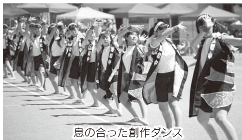
息の合った創作ダンス