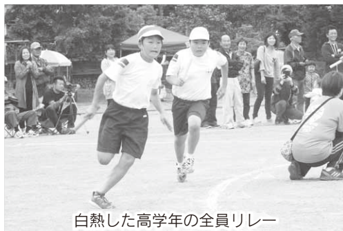
白熱した高学年の全員リレー