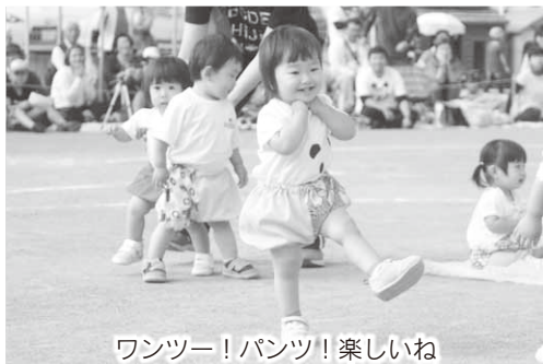
ワンツー！パンツ！楽しいね