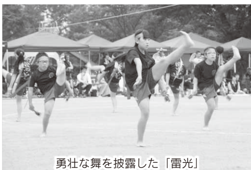
勇壮な舞を披露した「雷光」