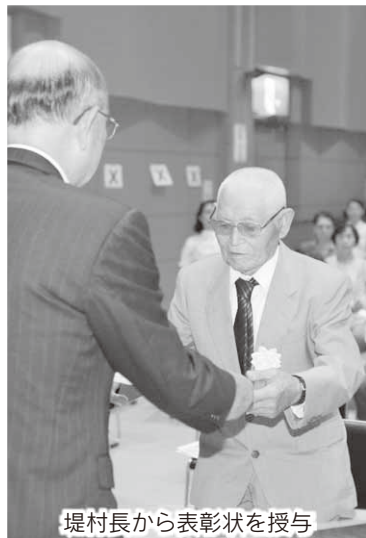
堤村長から表彰状を授与