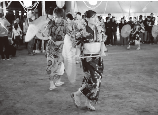
祭りを盛り上げた八木節(森下地区)