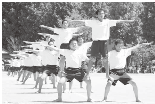
集中力が生み出す美しい組立表現

村内各小中学校・保育園では9月9日から9月30日にかけて秋季大運動会が開催されました。みんな元気いっぱい運動会を楽しみました。