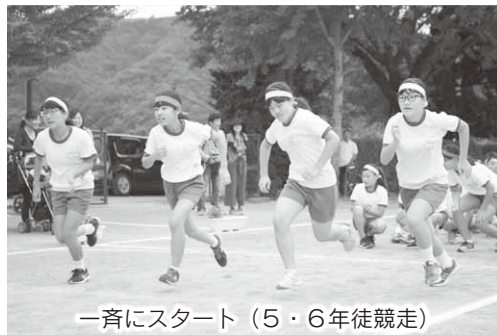
一斉にスタート (5・6年徒競走)