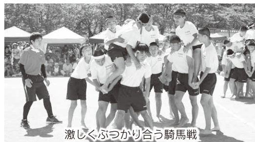
激しくぶつかり合う騎馬戦