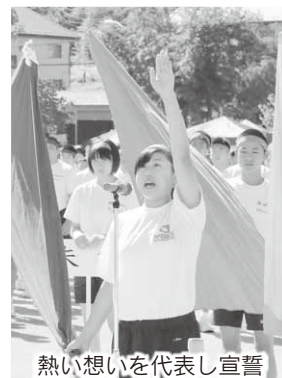
熱い想いを代表し宣誓