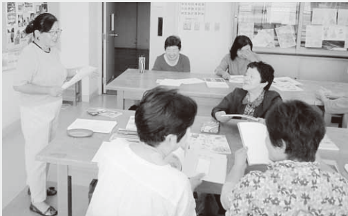
作品づくりを行う参加者

この「いきいき塾」は、村内在住の60歳以上の方を対象に、講習会や講演会、健康講座など、生涯学習機会提供事業として行われるものです。