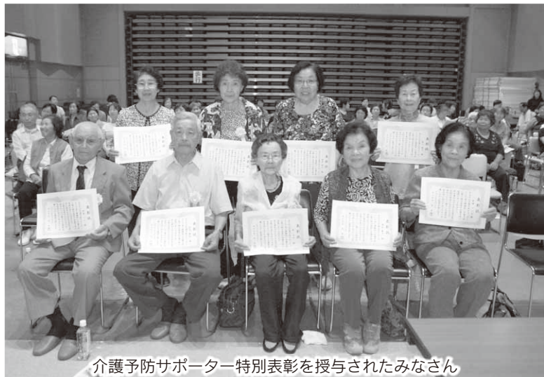
介護予防サポーター特別表彰を授与されたみなさん