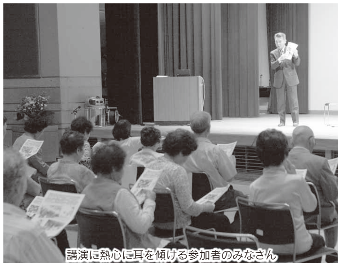
講演に熱心に耳を傾ける参加者のみなさん