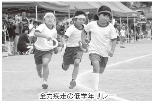
全力疾走の低学年リレー