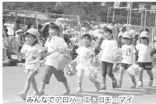
みんなでアロハ・エ・コモ・マイ