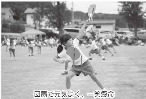
団扇で元気よく、一笑懸命