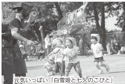
元気いっぱい「白雪姫と七人のこびと」