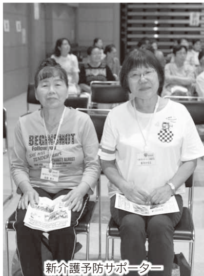
新介護予防サポーター

自分らしい生活を続けるための基礎となる筋力が落ちないように、また歩行バランスを保てるようにと考えられた体操、それが「らくらく筋トレ体操」です。椅子を使ってゆつくりと行う筋力トレーニングなので、誰でも無理なく参加することができます。