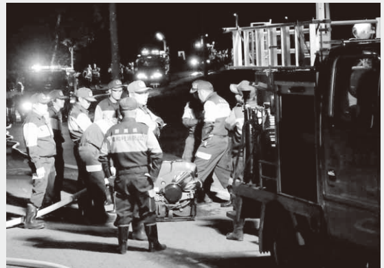
訓練を行う村消防団

この訓練は、水利の少ない林野などでの火災を想定し毎年行われているもので、今年は第1分団から第10分団までの全てのポンプ車及び小型ポンプをホースで接続し、水利を遠方まで届け放水するというもの。ポンプの取り扱いを間違えると故障の原因ともなるため、団員たちは利根沼田広域中央消防署員らの指導のもと、互いに無線で連携をとりながら熱心に訓練に取り組みました。