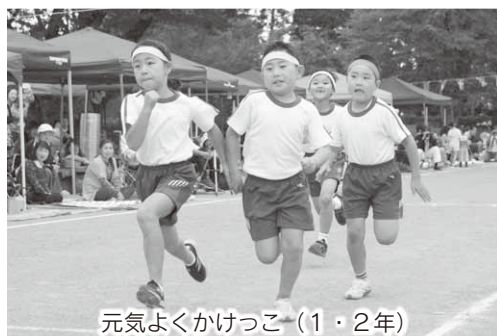
元気よくかけっこ (1・2年)