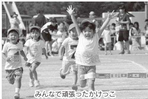
みんなで頑張ったかけっこ