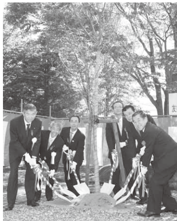
植樹されたヨコハマヒザクラ

昭和村と横浜市の友好交流協定締結5年目を記念した植樹式が10月1日、「第20回昭和の秋まつり」会場内で行われま