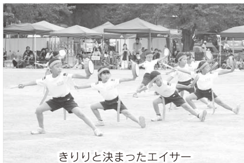
きりりと決まったエイサー