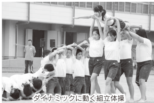
ダイナミックに動く組立体操