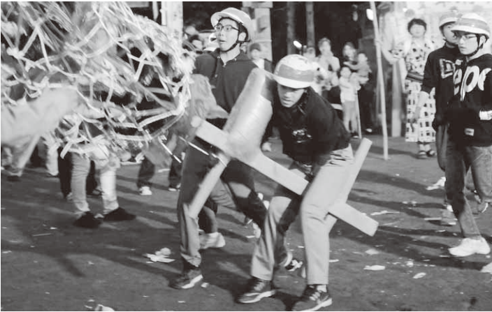
威勢良くつつかけるまんどろ(川額地区)

こちらも2日目の午後9時過ぎになると、青年団らによる伝統の八木節が行われ、森下上・中・下の3基のまんどろが威勢よく入場。境内に詰めかけた大勢の見物客が見守る中、迫力ある七回めぐりを披露しました。まんどろが勢いよくつつかけあう度に見物客から歓声が上がっていました。