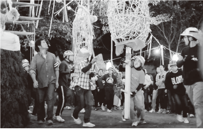
迫力ある七回めぐりを披露(森下地区)

川額地区では9月28日と29日に川額八幡宮で開催されました。午後9時には、祭りは最高潮に達し、八木節が披露される中、川額上(藤井・宮貝戸)と川額下(根岸・伏田)の中学生による2基のまんどろが堂々と入場。七回めぐりが始まると、やがて境内をまわりながら激しくつつかけ(ぶつけ)あいました。