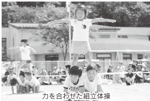
力を合わせた組立体操