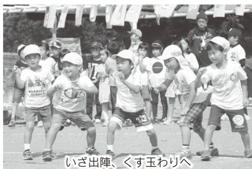
いざ出陣、くす玉わりへ