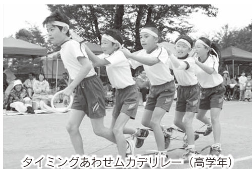
タイミングあわせムカデリレー (高学年)