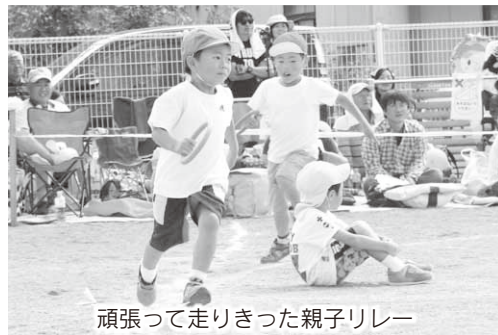
頑張って走りきった親子リレー