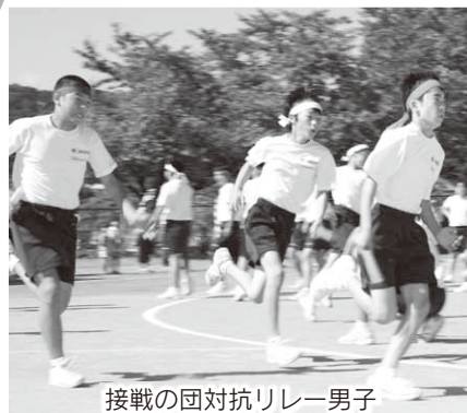
接戦の団対抗リレー男子