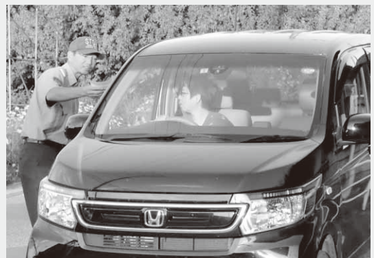
行き交う車に交通安全を呼びかけ

なお、沼田警察署によると、運動期間内に管内で交通死亡事故が発生しており、同署では、車両の運転には速度を控え、交通事故防止に努めるよう呼びかけています。