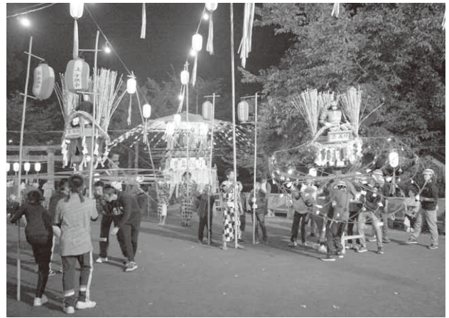
堂々と存在感を放つまんどろ(川額地区)