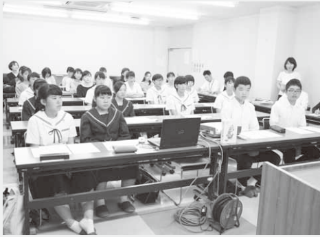
報告に訪れた昭和中生