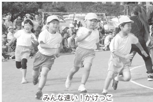
みんな速い！かけっこ