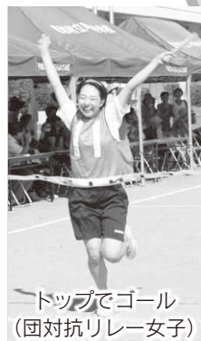
トップでゴール (団対抗リレー女子)