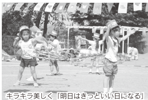
キラキラ美しく「明日はきっといい日になる」