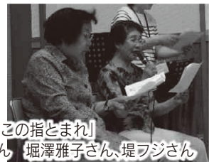
入原サロン「この指とまれ」