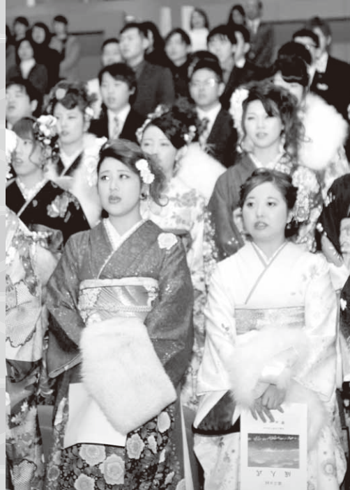
華やかな振り袖に身を包む新成人