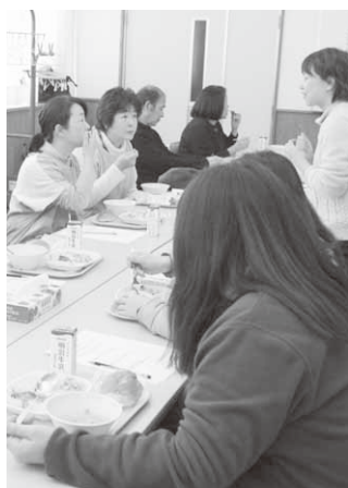
給食を味わう参加者

に安全でおいしい給食を試食してもらうことで、学校給食に対する理解と関心を深めてもらおうと、同センターが実施しており、今年で9回目を迎えます。