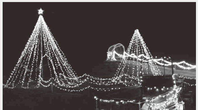
美しい光を放つイルミネーション

今年は「HOPE OF TREE」(希望の木)と名付けられたツリーのほか、アーチなどにLED電球およそ10,000個が取り付けられ、美しい光が訪れた人たちの目を楽しませました。