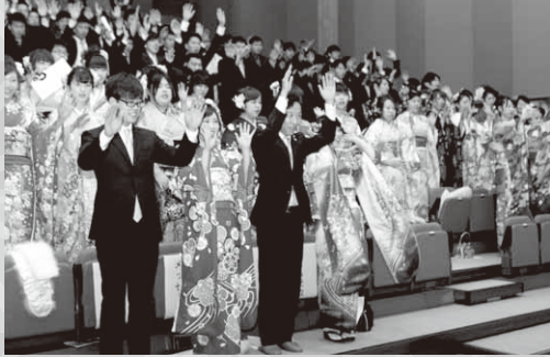
成人を祝い万歳三唱

式典後に催された茶話会では、中学校時代の恩師からお祝いの言葉が贈られたほか、抽選会なども行われ、新成人の皆さんは友人や恩師との懐かしい再会を喜び合い、笑顔とともに思い出話に花を咲かせていました。