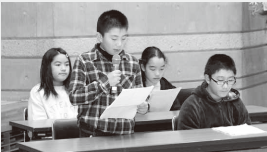
発表を行う代表児童たち

村教育委員会では1月13日、「昭和村いじめ防止子ども会議」を公民館多目的ホールで開催しました。