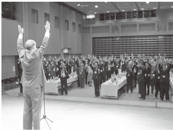
村のさらなる発展を願い万歳三唱