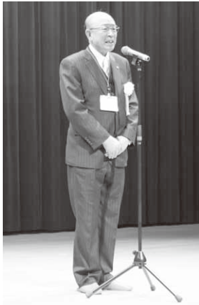
新年のあいさつをする堤村長