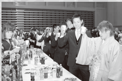
輝かしい未来に乾杯！