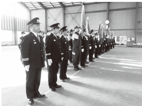
引き締まった表情で式に臨む消防団員

その後、来賓の方々からの激励の言葉を受け、団員たちは地域防災の要として、今年一年の決意を新たにしていきました。