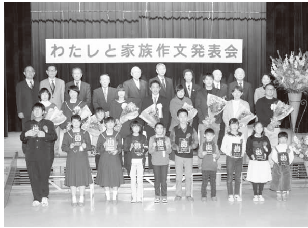
優秀作文の表彰を受けた児童・生徒と家族の皆さん