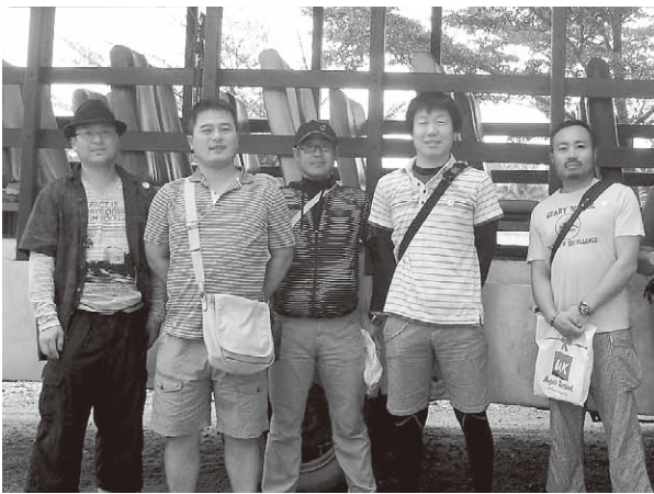
マレーシアのUKファームを視察

シンガポールでは、高級街にあつてコンニャクなど日本の食品が多く売られている伊勢丹の食品売り場や、中国人街・マレー人街・インド人街などの多様な民族が暮らす一般的なスーパーマーケット、屋台村などを視察しました。