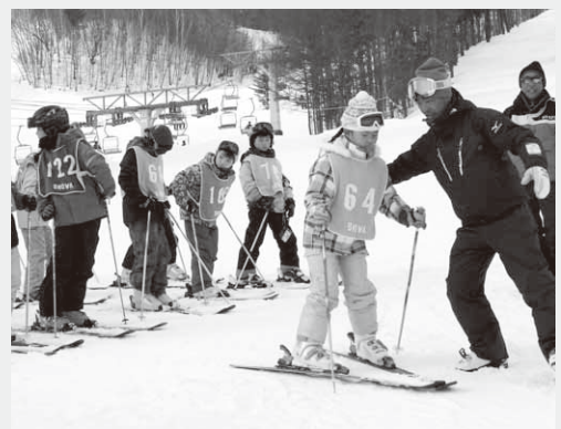
レッスンを受ける子どもたち

また、午後にはスキー大会が行われ、参加者はレッスンの成果を披露。それぞれの目標タイムを設定し、どれだけそのタイムどおりにコースを滑れるかを競いました。