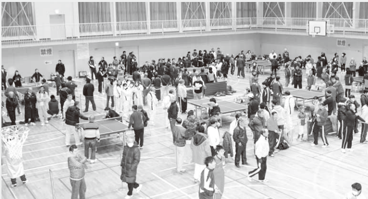
およそ330人が集まり熱気に包まれる会場