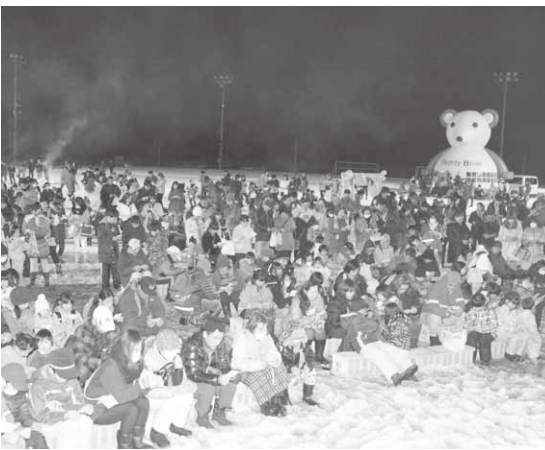
たくさんの人たちでにぎわうビンゴ大会