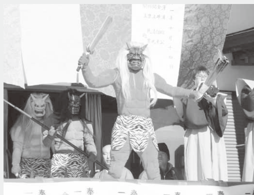
ホラ貝の音とともに3匹の鬼が登場

節分会に訪れたたくさんの人たちは、たいまつなどを手に、ホラ貝と太鼓の音にあわせて境内を練り歩く3匹の迫力ある鬼たちの姿に見入っていました。