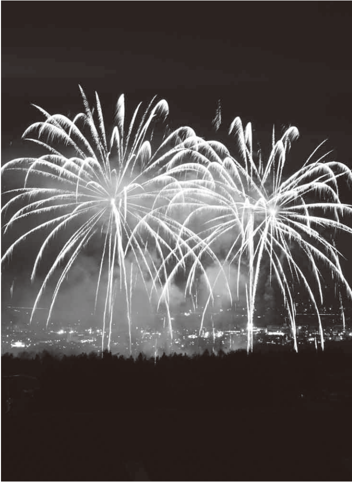
真冬の夜空を鮮やかに彩った雪上火火

イベントのメインとなる雪上花火は、午後7時からスタート。およそ5,000発の花火が40分間に渡って打ち上げられ、色とりどりの花火が澄み切った夜空を鮮やかに彩りました。