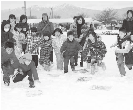
雪上で行われたかるた大会