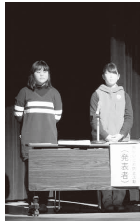
活動を発表した南小児童

第一部では、1月15日に行われた「昭和村いじめ防止子ども会議」から村内各校を代表して、南小学校より2人の児童が取り組んできた活動を発表。