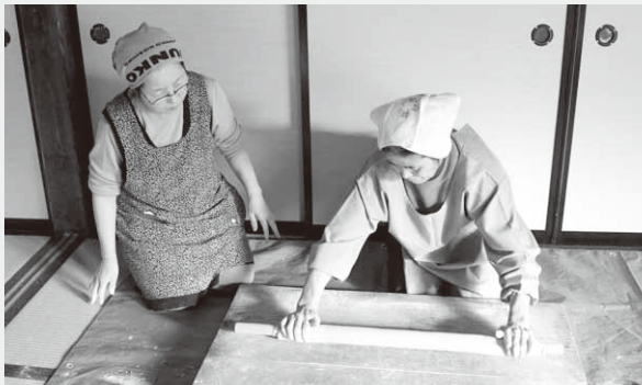
心を込めて作られる手打ちそば