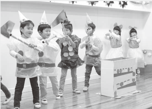
かわいらしい演技を披露する園児たち