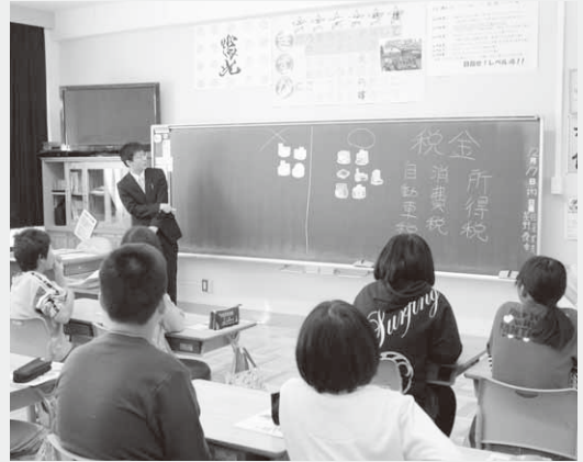
税金の種類を説明する職員

当日は税務課職員が講師となり、6年生のクラスで税に関するビデオやクイズで税金の種類や使い道などを説明しました。教室の最後には児童が「村で集められている一年間の税金はどのくらいですか」など、積極的に質問をしていました。