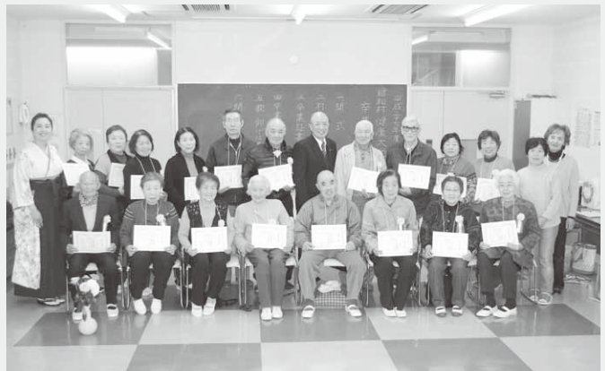
卒業を迎えた健康大学生の皆さん

卒業式では、修了を迎えた大学生18人に堤村長から卒業証書が手渡され、卒業生全員がそれぞれ健康大学での思い出を振り返り、今後の目標を発表しました。