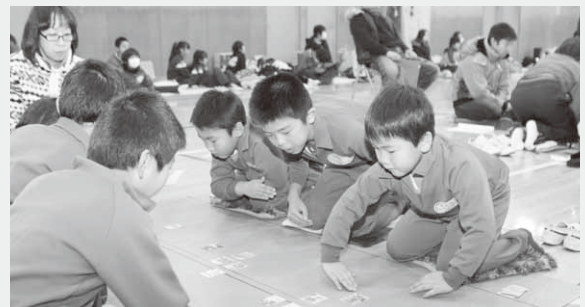
チームプレーが重要な団体戦