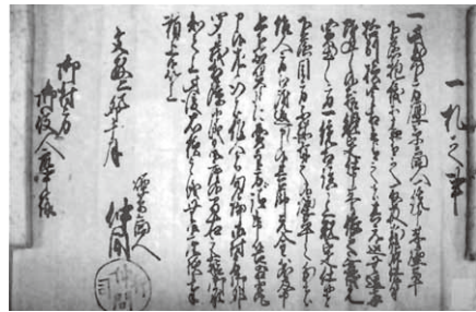
煙草商人から出された規定文