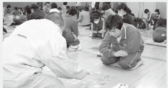
緊張感が漂う個人戦