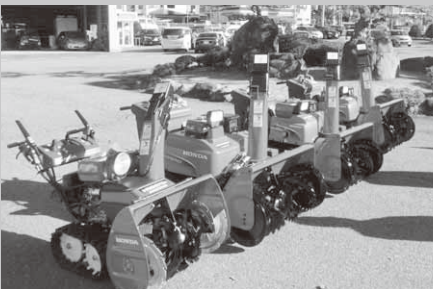
コミュニティ事業で購入した除雪機

購入した除雪機は、各小中学校の通学路となる地域の除雪を中心に活用される予定です。