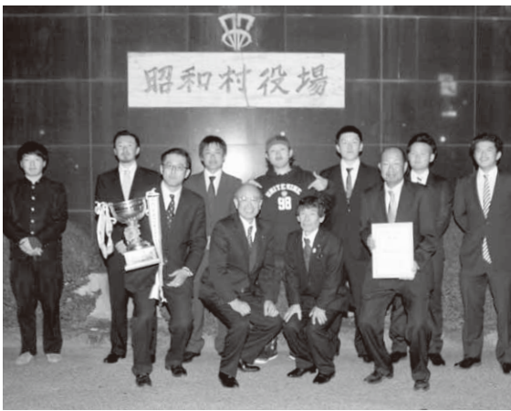
県大会で優勝し全国大会へ出場する昭和ジャガースのメンバー