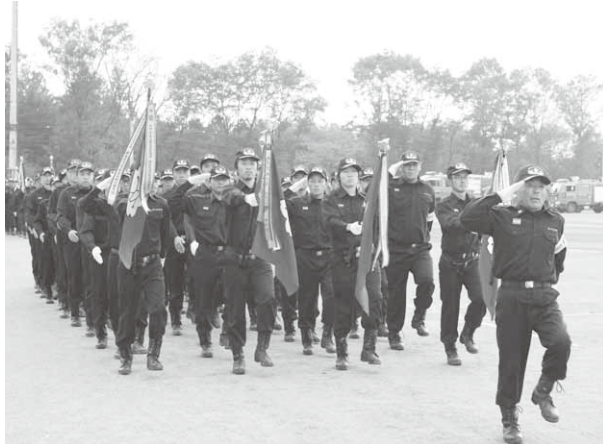
真剣な表情で分列行進を行う消防団員