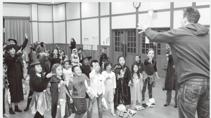
じゃんけん大会を楽しむ子どもたち

この日は、利根沼田地域に住む日本人と外国人の子どもと大人60人が参加。ハロウィンの衣装をして夕食やレクリエーションなどで交流を楽しみました。