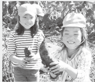
おイモが掘れたよ！