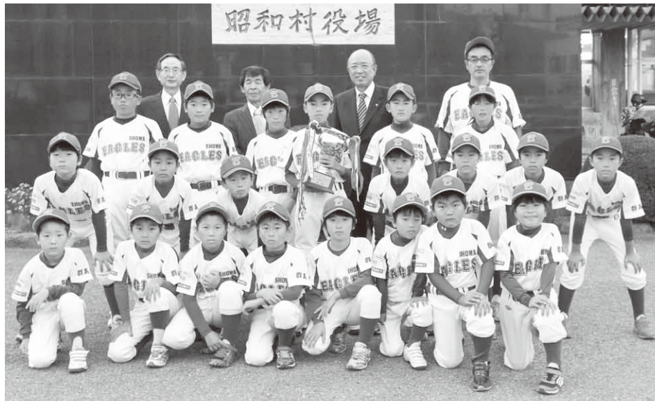
県大会で優勝し関東大会へ出場する昭和イーグルスのメンバー