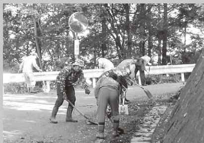
村内各地で実施された道路愛護運動