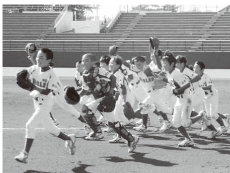
優勝を決め喜びの表情を見せる選手たち