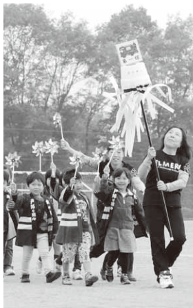
幼年消防クラブの行進