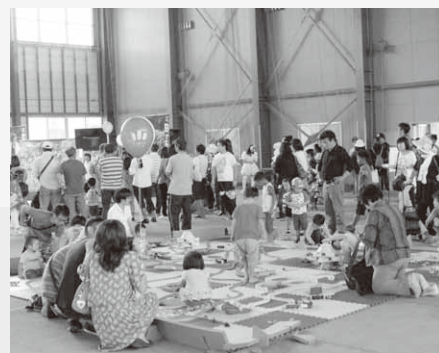
大人気のキッズゲームフェスタ