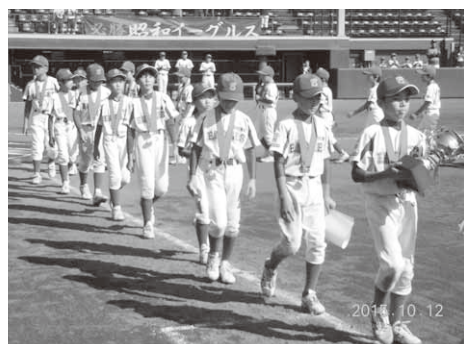
優勝杯を手に行進