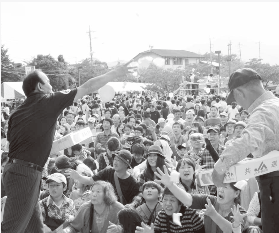
毎年大盛況のもち投げ