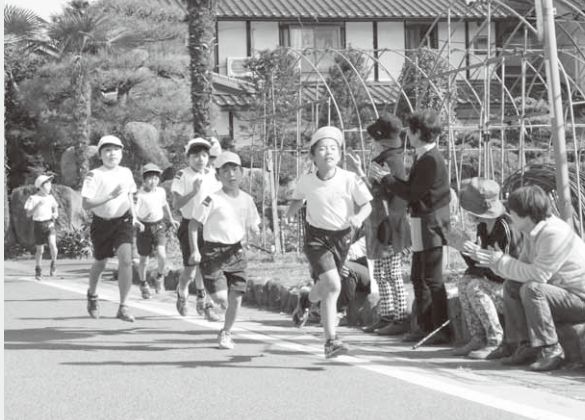
声援を受け元気よく走る児童たち