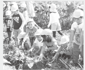
収穫を楽しむ園児たち

第一・第二・子育ての年長組の園児たちが10月15日、旬菜館に隣接する収穫体験農場「やさしい王国ファーム」でサツマイモと落花生掘りを行いました。