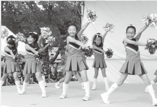
元気いっぱいオールスターチア