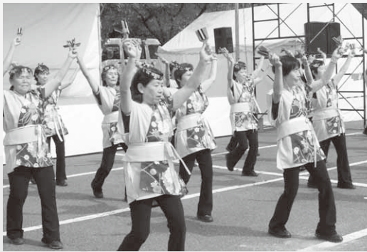
会場を盛り上げた「たんべえ」