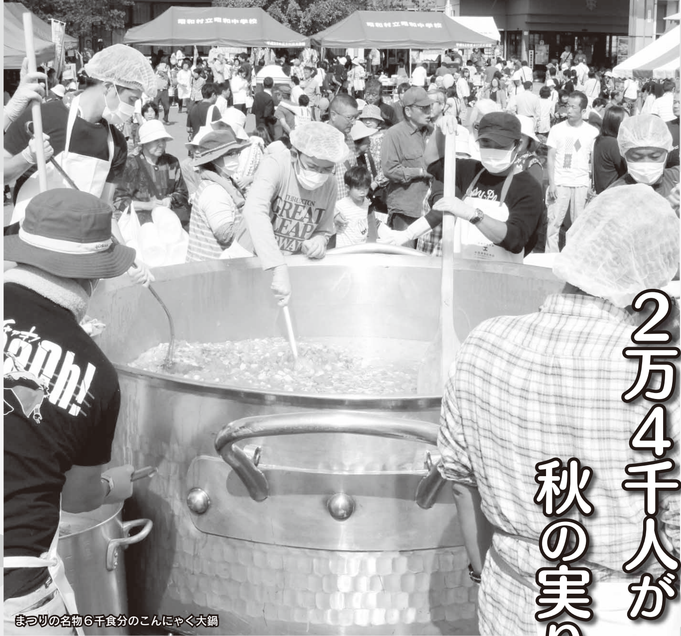
まつりの名物6千食分のこんにゃく大鍋