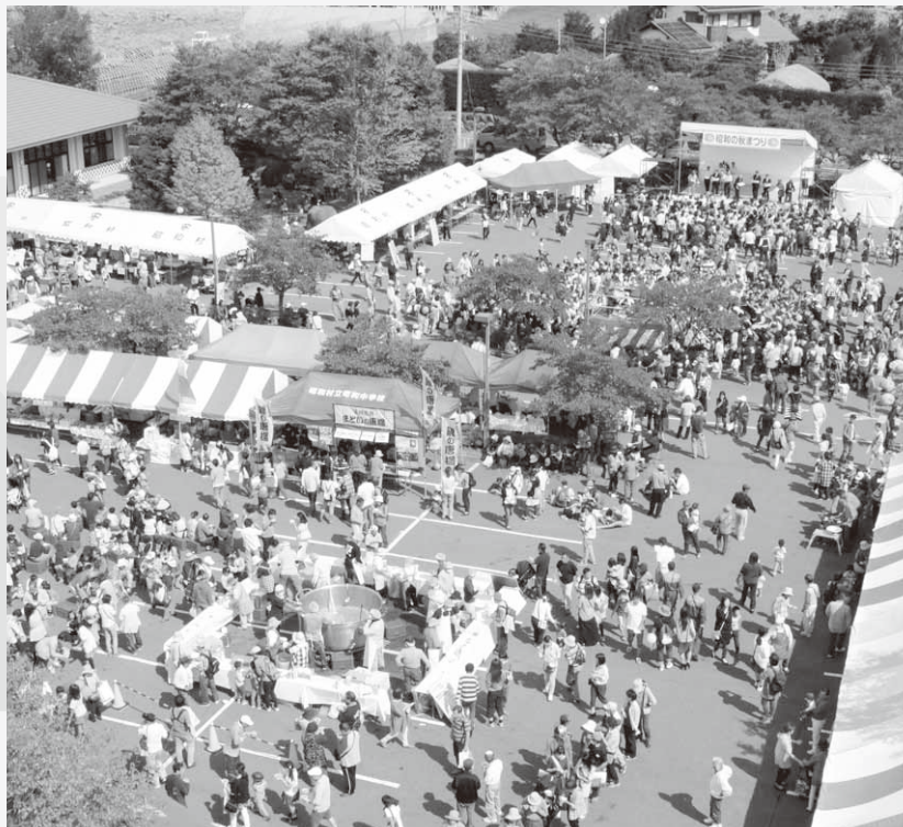
2万4千人が訪れた会場