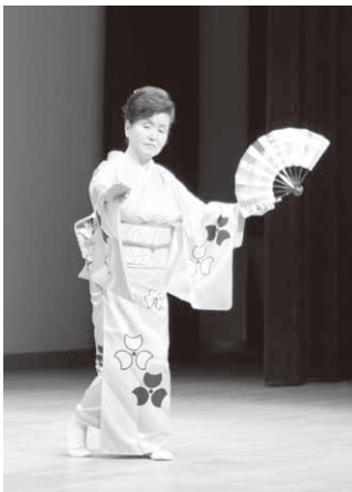
見事な舞いを披露

発表会では、村舞踊協会に加盟する7団体がそれぞれ日頃の練習の成果を発表。午前と午後の2部、54演目にわたって見事な舞踊を披露し、会場に詰めかけた観客を魅了しました。