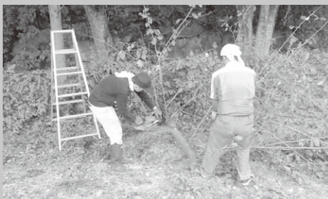
奉仕作業を行う青年部の皆さん

作業は午後5時からおよそ2時間にわたって行われ、同青年部員12人が枝打ち作業に汗を流しました。