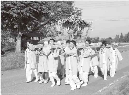
赤谷・追分地区を巡るおみこし