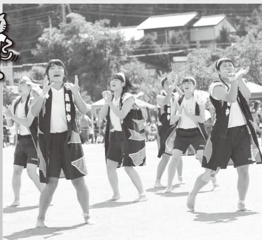
2・3年生女子による創作ダンス