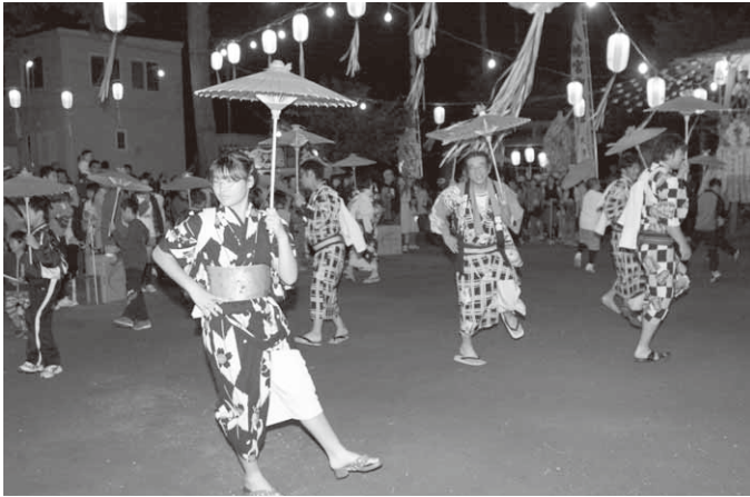
まつりを盛り上げた八木節(川額地区)

境内に詰めかけた大勢の見物客が見守るなか、迫力ある七回めぐりを披露。まんどろがつつかけあう度に見物客から歓声が上がっていました。