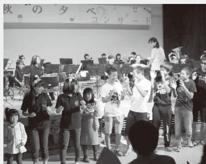
来場者も一緒に楽しみました