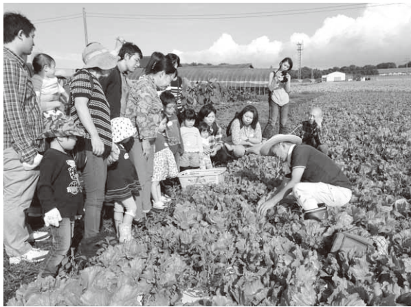
キッズパルファームでの収穫体験

狩り、道の駅「あぐりーむ昭和」に隣接する収穫体験農場「キッズパルファーム」でのレタスの収穫体験など、親子で昭和村の1日を楽しみました。