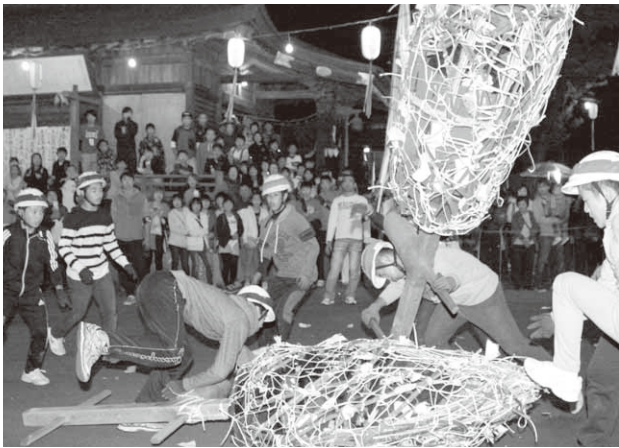
威勢良くつつかけあうまんどろ(川額地区)