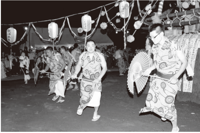
揃いの傘で八木節を披露(森下地区)

川額地区では川額八幡宮で9月28日、29日の2日間にわたり開催。八木節や手踊りなどが行われ両日とも大盛況。最終日となる29日の午後9時過ぎには、まつりも最高潮に達し、八木節の演奏のなか、中学生による七回めぐりがスタート。境内に堂々と入場した川額上(藤井・宮貝戸)と川額下(根岸・伏田)の2基のまんどろが、境内をまわりながら激しくつつ