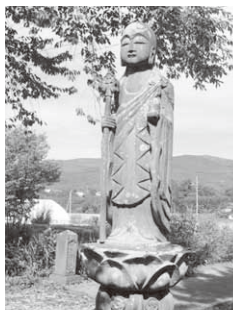
恵光寺の地藏菩薩

生越に鎌倉建長寺派、臨済宗の恵光寺がある。この寺の歴史は古いが、五十数年前から住職がいらない無住の寺である。近年の状況を見ると、川場村の柱昌寺住職がしばらく兼務していたが、亡くなられ、現在は沼田市上発知町の龍淵寺住職が兼務しているという。