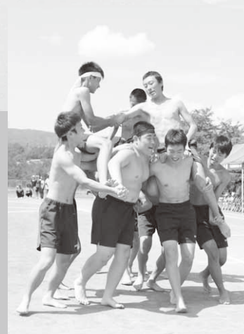
男子全員による騎馬戦