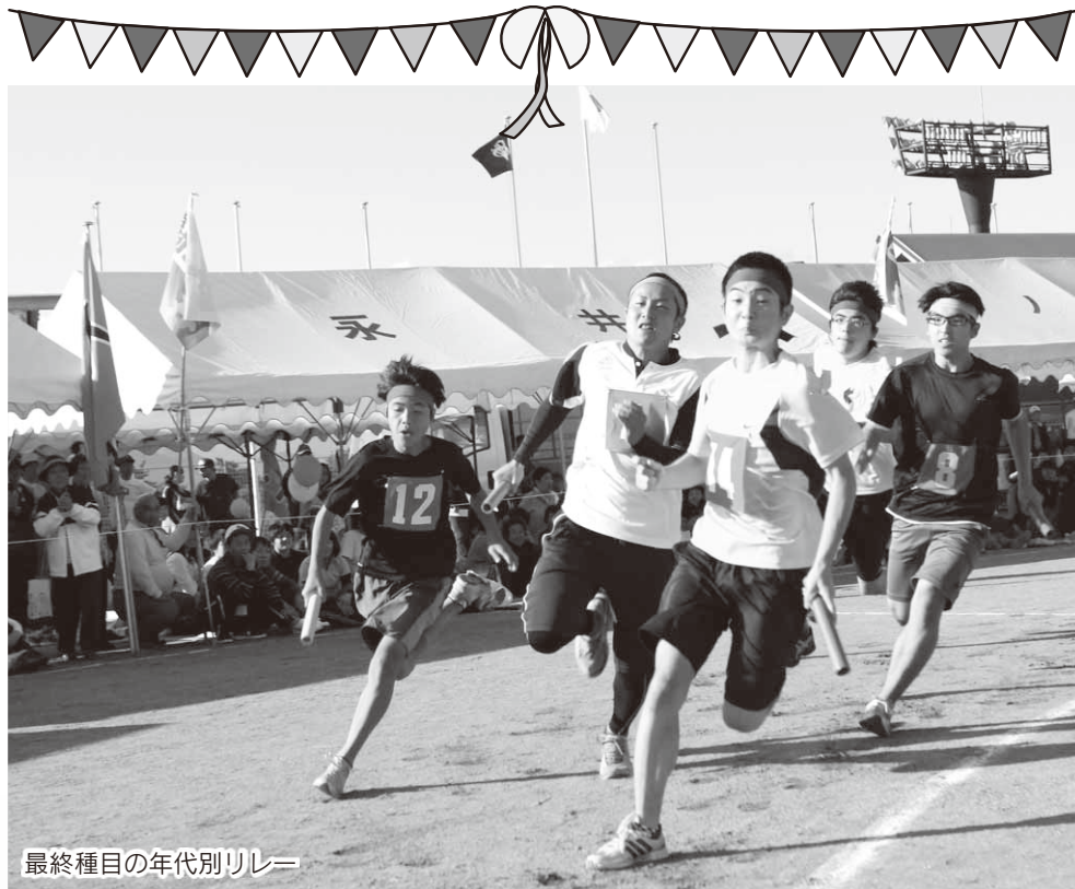
最終種目の年代別リレー

村内各地で秋の大運動会が開催されました。ここでは村民運動会、各小中学校・保育園で行われた運動会の様子を紹介します。