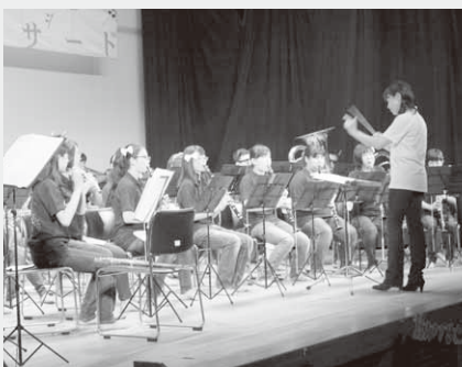
第2部では衣装をチェンジ

演奏とともに来場者がステージで踊ったり、演奏に参加するなど、来場者と一緒に楽しむ素敵なコンサートとなりました。