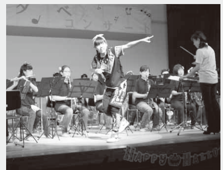
部員による華麗なダンス