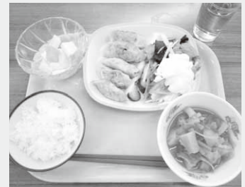
出来上がった料理

村保健福祉課としょうわ子ども教室の共催による親子料理教室が9月6日、村保健センターで行われました。