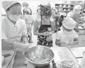
上手に作れるかな？