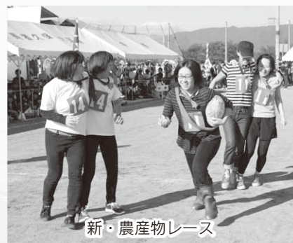
新・農産物レース