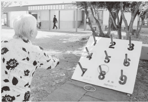
「しょうわなげ」に参加する来場者

当日は、日頃からの感謝の気持ちを込めて、子どもたちにお爺ちゃん、お婆ちゃんの似顔絵を描いてもらう似顔絵コーナーや輪投げをして村の特産品を当てる、「しょうわなげ」などが行われ、大盛況となりました。