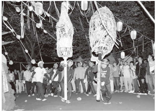
迫力ある七回めぐりを披露(森下地区)