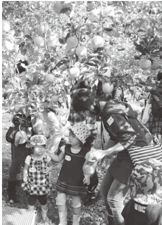
リンゴ狩りをする参加者

当日は、東京都など首都圏近郊から25人の親子が参加。ふれあいグリーンパークでの散策やごとうフルーツでのリンゴ