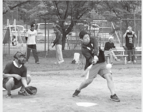
白熱した試合を展開

45歳以上の部 優勝：川額、準優勝：鎌沢・上組・中組、 第三位：赤城原、長者久保・大河原