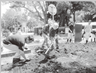
横浜公園での植え付け作業

当日は、村職員のほか横浜市緑の協会、横浜市職員の方々の協力をいただき、横浜公園内およそ50㎡の畑に植え付け作業を行いました。なお、11月上旬には収穫体験イベントが行われる予定です。