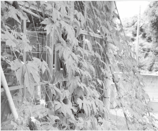
役場に設置されたグリーンカーテン