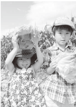
大きいレタスが採れたよ！

イベントには、たくさんの人たちが来場し昼夜の寒暖差が育てた昭和村産のおいしいレタスを味わっていました。