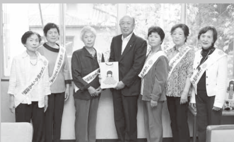
役場を訪れた更生保護女性会の皆さん

同会では、このほか村内小中学校や保育園、村の施設など全10か所をまわり、同運動の呼びかけとともに手作りの和紙人形などを配りました。