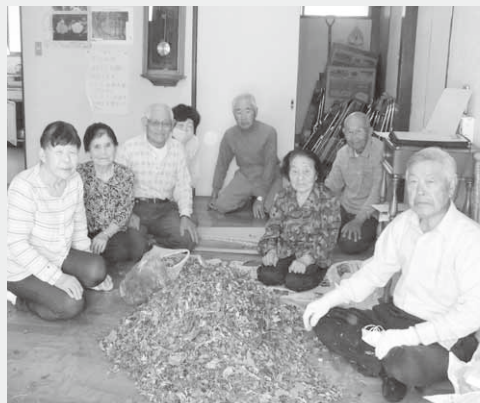
お茶の材料を用意する椽久保南部同志会の皆さん

このお茶は、桑の葉やどくだみ、オオバコなど、乾燥させた10種類の薬草を皆で混ぜ合わせたもので、会話もはずみ心も体も元気にしてくれています。