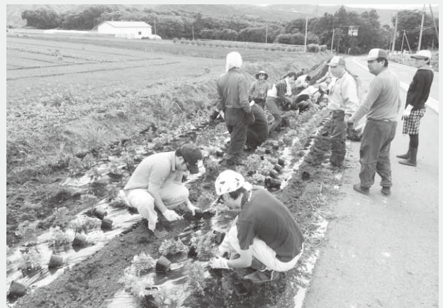
花植え作業に汗を流す参加者

作業には同会会員や婦人会、地元ボランティアの方などおよそ50人が参加。午後1時から2時間半にわたって花植え作業に汗を流しました。