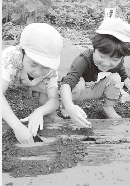
上手に植えられるかな？