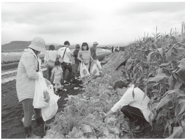
たくさんの人が参加したレタスの収穫体験

また、同道の駅に隣接する収穫体験農場「やさしい王国ファーム」では親子連れが多数参加して、レタス収穫体験を楽しんでいました。