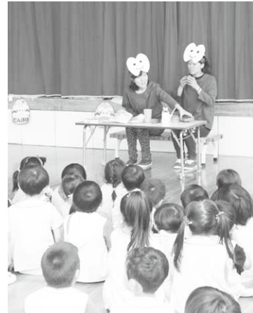
虫歯予防のお話(第二保育園)

村内各保育園では6月中に「むし歯予防教室」を実施しました。 この教室は、歯と口の健康週間にあわせて、園児たちに歯の大切さを伝えるた