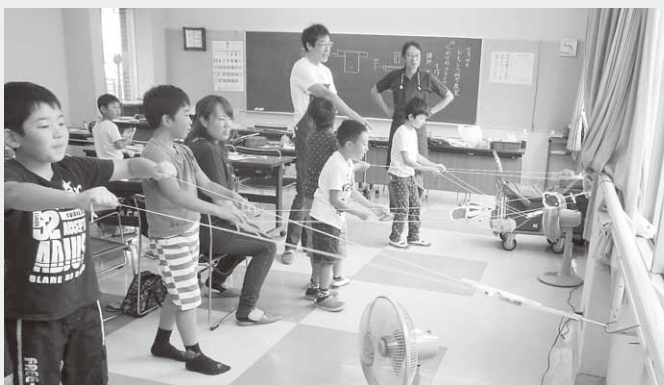
「くねくねクライマー」の動きを楽しむ子どもたち

村教育委員会と群馬県生涯学習センター主催のおもしろ科学教室「くねくねクライマーを作ろう」が7月4日、公民館大会議室で開催されました。