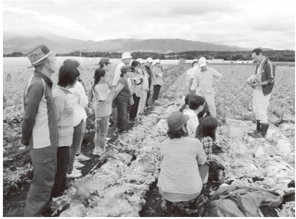
レタスの収穫体験をする参加者（玉村町）