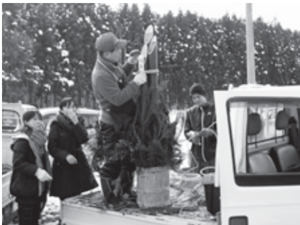
手際よく制作されていく門松

めて「約束」、「目標」の文字の書かれた札が添えられ完成。完成した門松は、村内の神社やお寺などのほか役場などの公共施設、総合福祉センター「昭和の湯」にも飾られ、訪れた人たちの目を楽しませました。