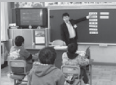
税金の種類などを説明する職員

大河原小学校では12月18日に実施。税務課職員が講師となり税金の種類や使い道などを説明しました。また、児童たちは「村の一年間の税金はどのくらいですか」など、積極的に質問をしていました。