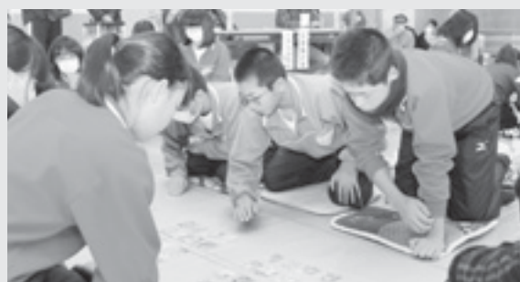
チームプレーが重要な団体戦