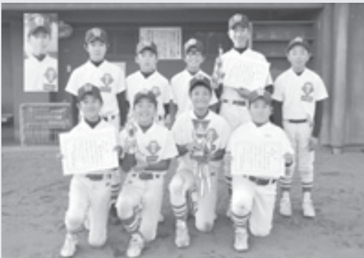
大活躍した利根選抜チームの昭和村メンバー

第12回スバル旗争奪群馬県学童軟式野球大会が10月4日から25日にかけて太田市運動公園野球場などを会場に行われ、利根選抜チームが見事優勝を勝ち取りました。