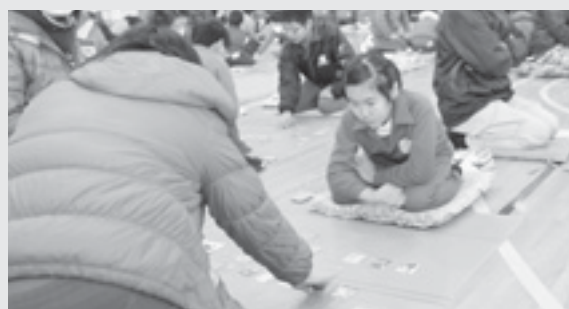
緊張感が漂う個人戦