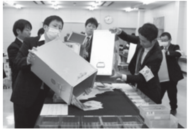
役場会議室で行われた開票作業