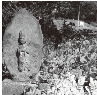
馬頭観音の石仏と阿曾城跡

翌天正十年（一五八二）十月北条氏邦は、五千余騎の兵を二手に分け、二千余騎の大軍で阿曾城に夜討ちをかけた。金子は奇襲に驚き、防ぐ手立てもなく一人の伴を連れ、岩をすべりおりて沼田へと逃げてしまう。これを見るなり、大將落ち給うと総くずとなり、岩坂をすべり落ち石に当たり死ぬ者もでた。踏みとどまって戦ったのは、一の木戸の大將大淵勘助、星野図書之介等は防戦したが討死にし阿曾城は破れた。時に天正十年（一五八二）十月二十三日と沼田記は伝えている。