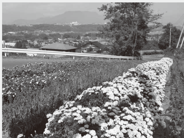
昭和インター線沿線