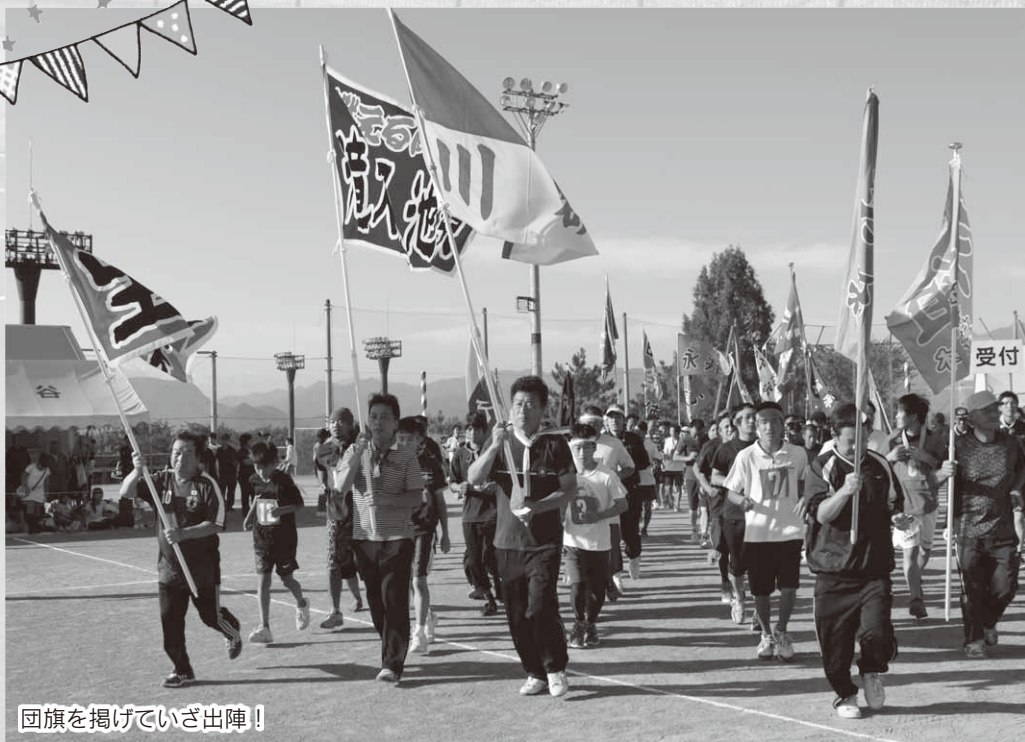
団旗を掲げていざ出陣!

村内各地で秋の大運動会が開催されました。ここでは村民運動会、各小中学校・保育園で行われた運動会の様子を紹介します。