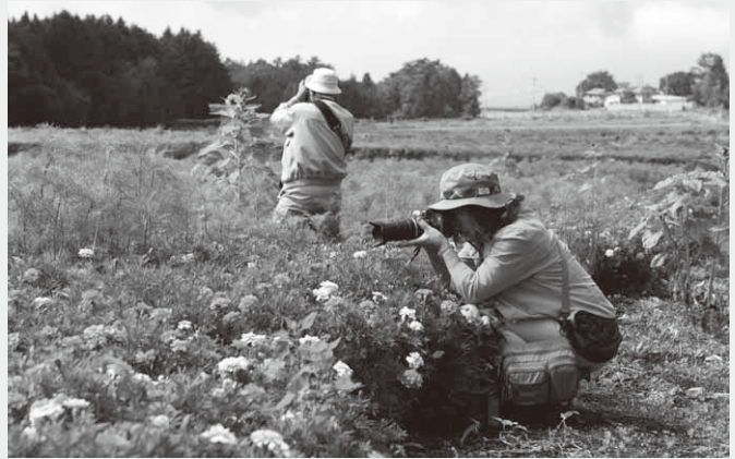
コスモス畑での撮影を楽しむ参加者

撮影会には、県内各地から写真愛好家およそ50人が参加。長者の原・結婚の森のコスモス畑の撮影や同日開催されていたりんごあんぴん大福村でのりんご狩り体験など、村の魅力を満喫していました。