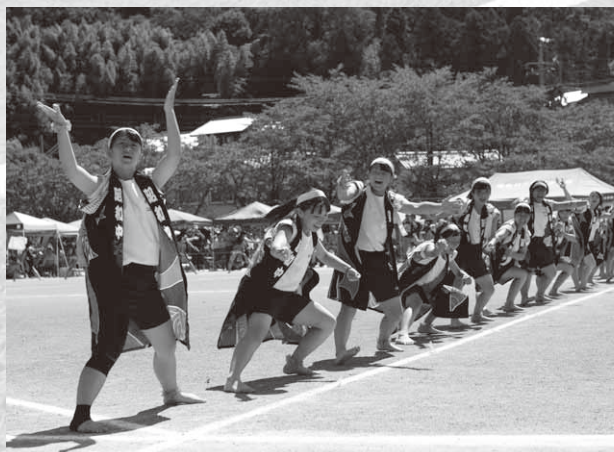
2・3年生女子による創作ダンス