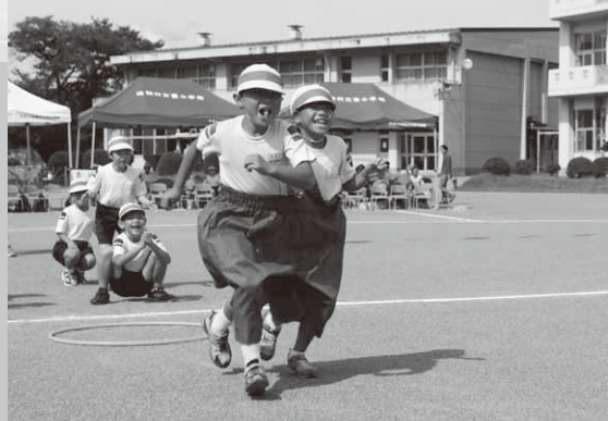
団競技のデカバンリレー