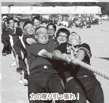
力の限り引っ張れ!