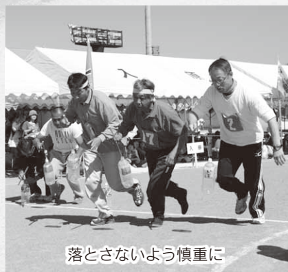
落とさないよう慎重に

村主催の第47回村民運動会が9月28日、総合運動公園多目的グラウンドで開催され、22種目が行われました。6種目で競われた地区対抗戦では、川額が17年ぶりとなる優勝を飾りました。また、村民運動会に先立ち平成26年度体育協会表彰が行われました。