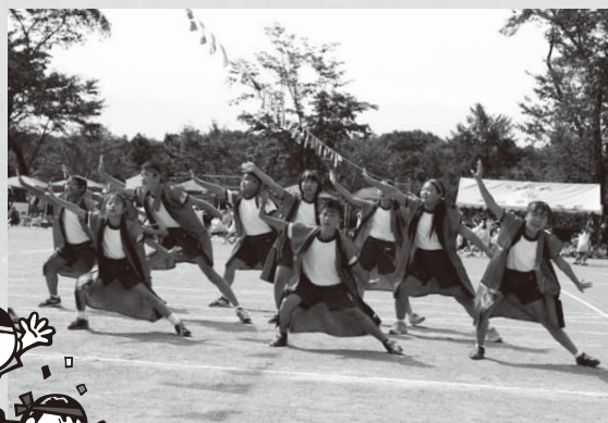
全校生徒による南中ソーラン