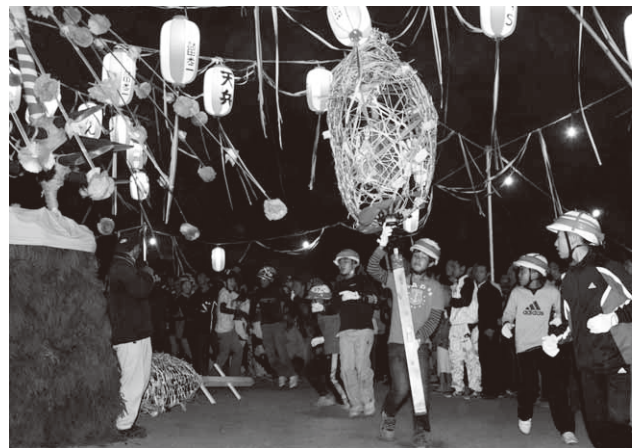
迫力ある七回めぐりを披露(森下地区)