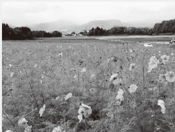
長者の原・結婚の森