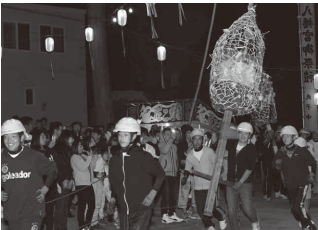
威勢よく入場するまんどろ(川額地区)

境内に詰めかけた大勢の見物客が見守るなか、迫力ある七回めぐりを披露。まんどろがつかあう度に見物客から歓声が上がっていました。