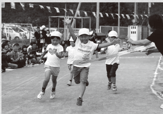
やったね！いっちゃん！