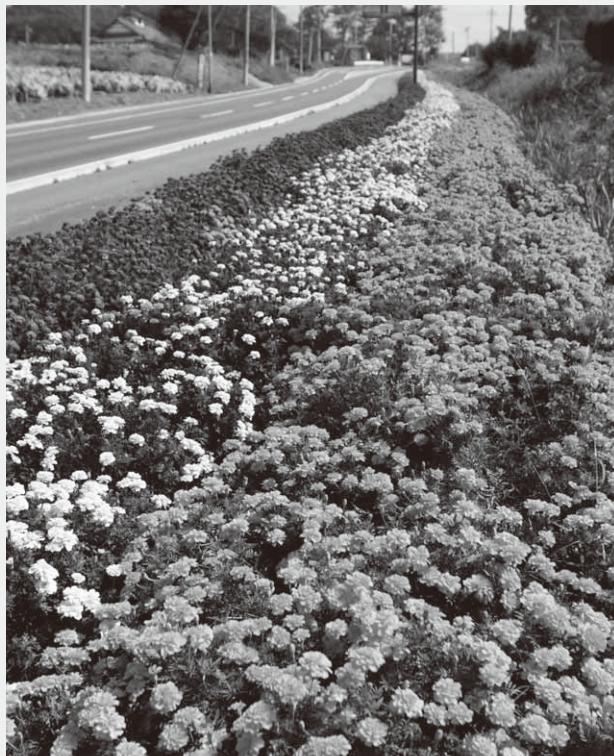
昭和インター線沿線