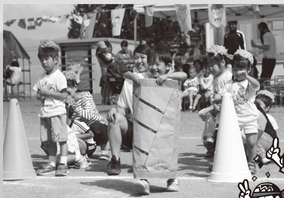
アイスに着替えてゴールを目指そう