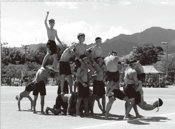
大迫力の組立体操