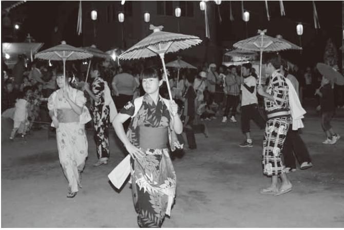
揃いの傘で八木節を披露(川額地区)

川額地区では川額八幡宮で9月28日、29日の2日間にわたり開催。八木節や手踊りなどが行われ両日とも大盛況。最終日となる29日の午後9時過ぎには、まつりも最高潮に達し、八木節の演奏のなか、中学生による七回めぐりがスタート。境内に堂々と入場した川額上・藤井・宮貝戸)と川額下(根岸・伏田)の2基のまんどろが、境内をまわりながら激しくつ