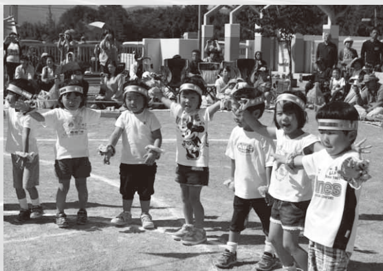
かわいい遊戯を披露

村内各小中学校・保育園では9月13日から9月27日にかけて秋季大運動会が開催されました。 小中学校・保育園ともに、元気いっぱいに運動会を楽しんでいました。