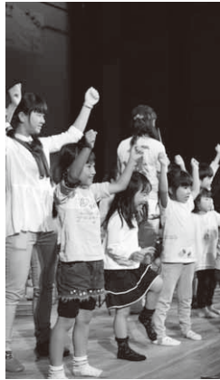
来場者も一緒に楽しみました

今年で22年目を迎えた秋の夕べコンサート。午後6時に開演すると、会場となった公民館多目的ホールには、たくさ