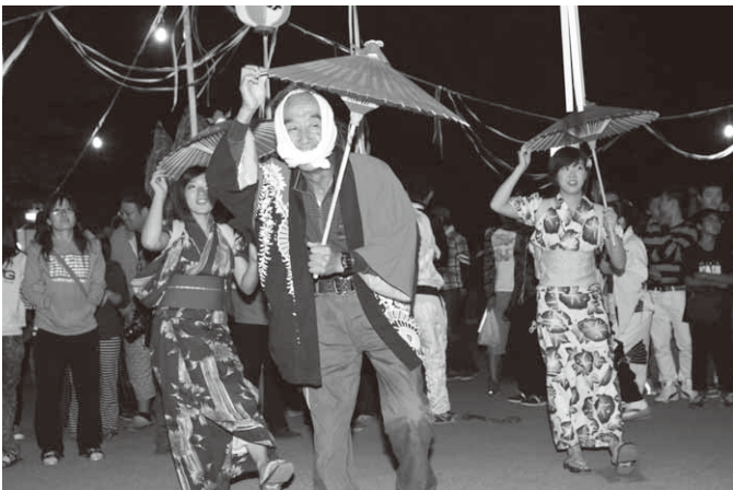
まつりを盛り上げた八木節(森下地区)