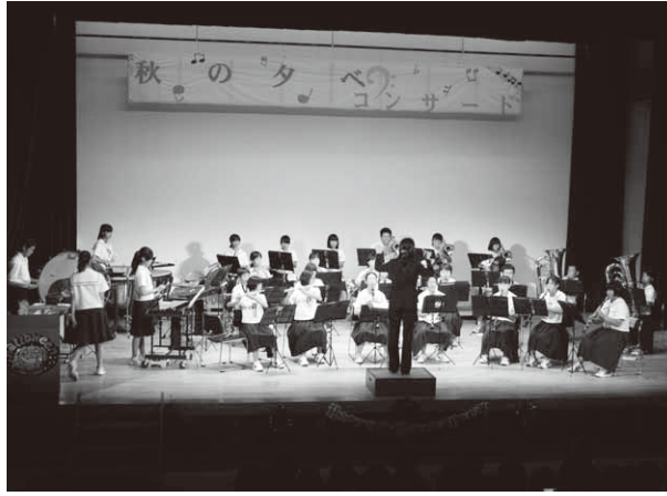
見事な演奏で会場を魅了した昭和中吹奏楽部