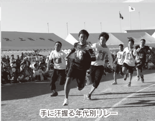
手に汗握る年代別リレー