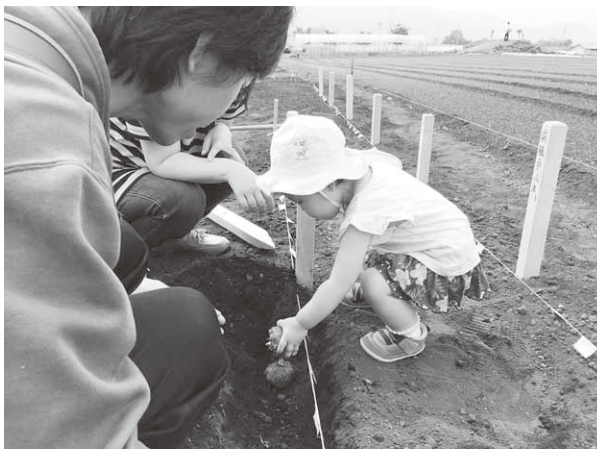
こんにゃく芋の植え付け体験