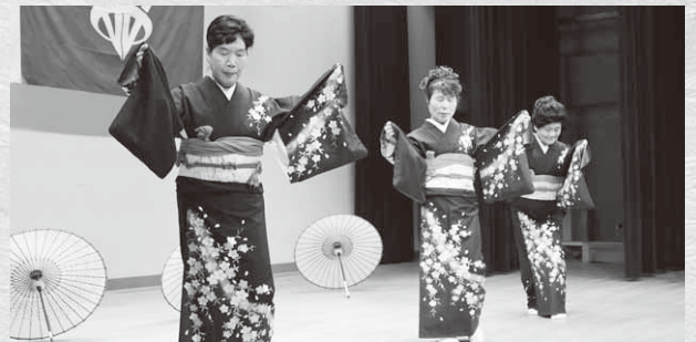
見事な舞踊で会場を魅了

い傷跡から復興への努力に日本中の人々が汗を流した時代でした。その中で、希望を抱いて生活してこられたのも、地域の方々との協力、励まし合いがあったからこそだと思います。これからの人生を本日のこの感動を忘れることなく、体に気をつけ、家族を大切に、地域社会に恩返しができるように努めたいと思います」と述べました。