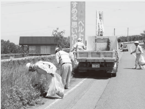
次々と集められていくゴミ

作業には、石坂建設(株)、(株)高橋舗道、兵藤建設(株)の3社が参加。道路わきに捨てられた空き缶などのゴミ拾いを行いました。