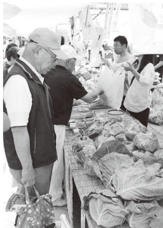
村テントには新鮮野菜がずらり