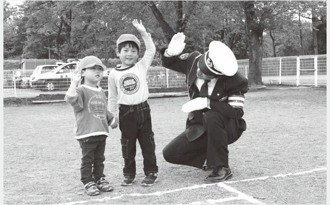
しっかり手を挙げて渡ろう(第二保育園)

講話の後には横断歩道の渡り方を練習。年長組の園児たちは道路に出て練習し、その他の園児たちは園庭につくられた横断歩道を渡る練習をそれぞれ行いました。