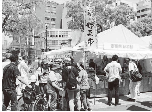
大勢の人でにぎわう昭和村のテント