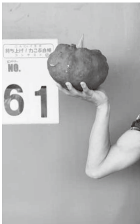
力こぶ自慢コンテスト

また、イベント恒例の餅つきには親子連れが多数参加。400人分のこんにゃく鍋料理が来場者に振る舞われるなど、大盛況となっていました。