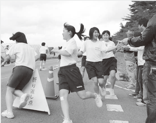
チェックを受け折り返し点を通過