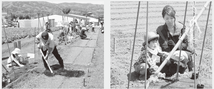
収穫に向けて植え付け作業をする親子

道の駅「あぐりーむ昭和」が企画・主催し、野菜を育て収穫体験などを行う「ミキハウス ハッピー・ノートファーム」が5月11日に行われました。