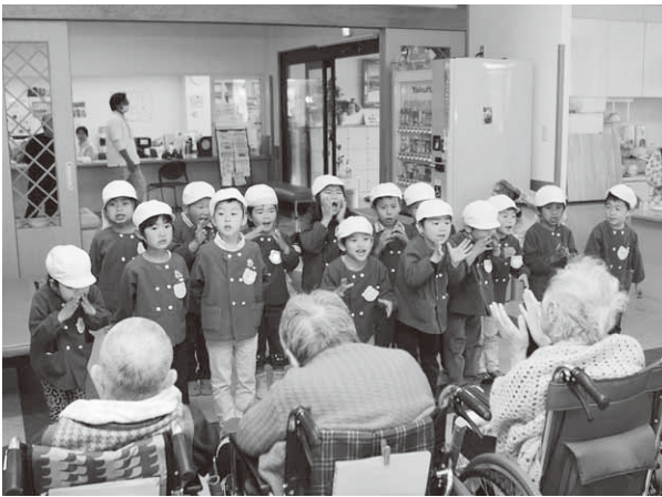
元気いっぱいに歌を披露