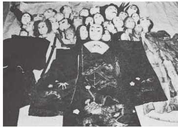
川額人形芝居の頭と衣装

しかしこの一座は、市松が亡くなったあとと消滅したものであると思われる。なぜなら、その頃使われていた人形が、現在川額にはない。どこにあるかと言うと、沼田市のさる文化人のお宅にそっくり保存されているからである。