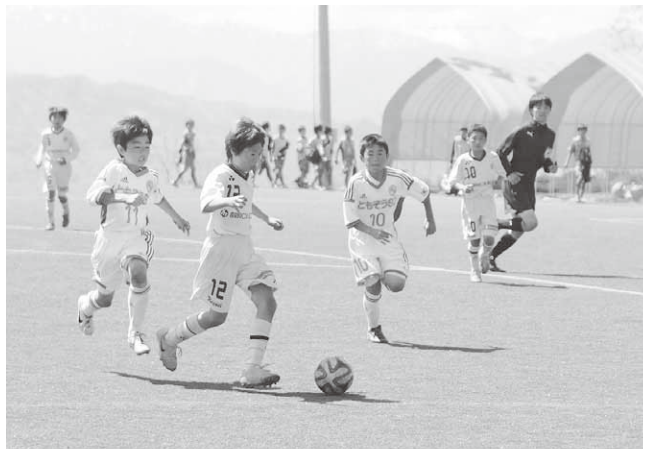
16チームが熱戦を繰り広げた大会