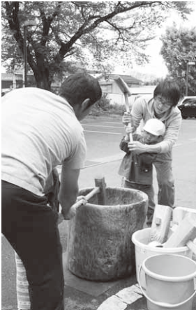
餅つきをする園児たち

また、交流会の最後には園児たちが「いつまでもお元気でいてください」とあいさつ。お年寄りのみなさんは顔をほころばせていました。