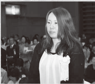
善意功労で感謝状を受けた 昭和村若妻会連絡協議会