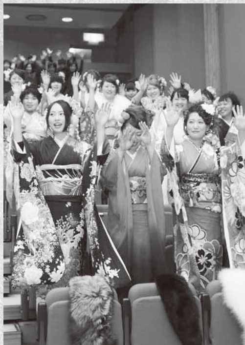
輝かしい未来に万歳！