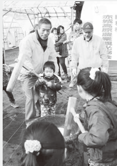
子どもたちも餅つきに参加

この日は、フォトコンテストの撮影会とも連携し、県内各地からカメラマンも参加。餅つきや「あんびん」づくり体験など、新春の味覚を楽しみました。