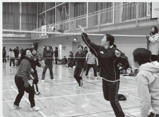
熱戦を繰り広げる参加者

大会結果 ▶女子の部 優勝：黒糖ボンデリング、準優勝：フレンズです。2、第三位：フレンズです。1 ▶混合の部 優勝：常木D、準優勝：フレンズ、第三位：八天會其の参