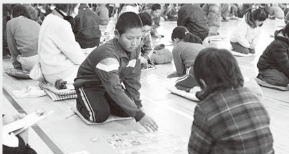
取るか取られるか緊張の個人戦