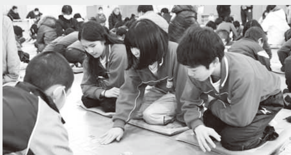
チームプレーの団体戦