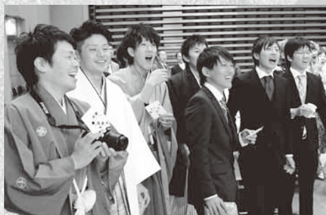
盛り上がったビンゴゲーム