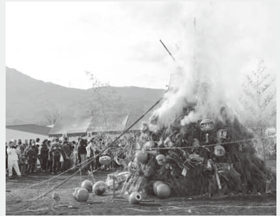
勢いよく燃え上がるやぐら

当日は、およそ300人が集まり、どんど焼きの火で体を暖めながら、今年一年の無病息災を願いました。また、会場ではどん汁や甘酒などが振る舞われたほか、餅つきも行われました。