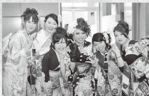
華やかな振り袖に身を包む新成人