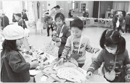
どれにしようか迷っちゃう