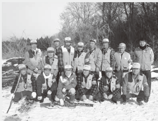
捕獲を実施した村猟友会の皆さん

今回の許可では20頭のカモシカを捕獲できます。また、同会では今年度中、シカ88頭、イノシシ2頭、ニホンザル8頭、クマ3頭を捕獲しました。