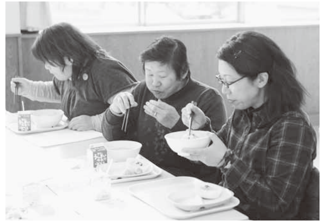
給食を味わう参加者

これは1月24日から30日までの「全国学校給食週間」にあわせ、地域の人たちに安全でおいしい給食を試食してもらう