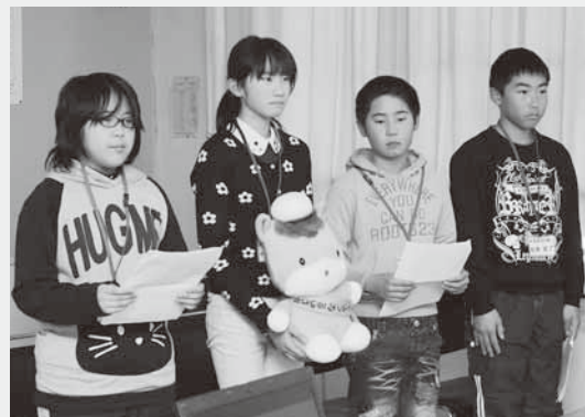
発表を行う代表児童たち

会議では、各校の代表児童生徒が、それぞれ年間をとおして取り組んできた、あいさつ運動などのいじめ防止活動を発表。発表後、子どもたちは「自分のこととして考えるようになり、いじめに対する意識が高まった」など、活動を振り返っていました。