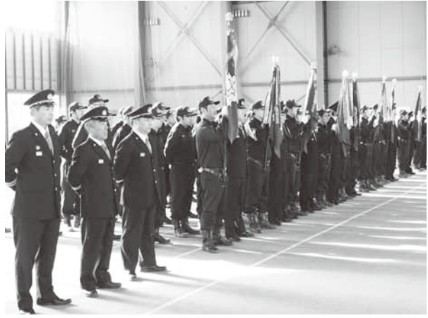
激励を受け一年の決意を新たにする消防団員