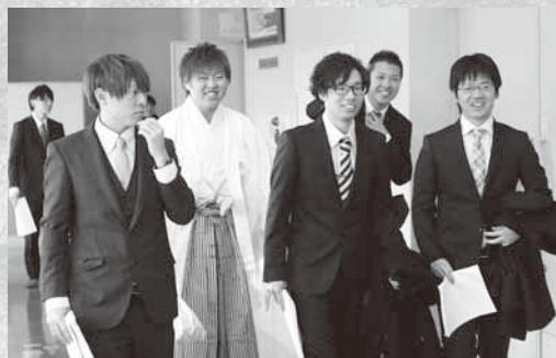
スーツとはかま姿もきまってるね

式典後に催された茶話会では、中学校時代の恩師からお祝いの言葉が贈られたほか、ビンゴゲームなども行われ、新成人の皆さんは友人や恩師との懐かしい再会を喜び、笑顔を見せながら思い出話に花を咲かせるなど、楽しいひとときを過ごしました。