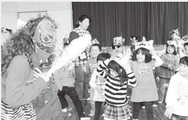
鬼なんて怖くないぞ!(第二保育園)