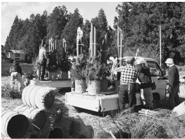
手際よく制作されていく門松