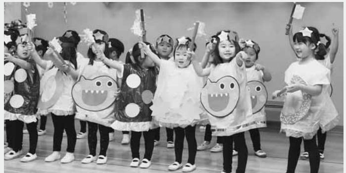
かわいらしい演技を披露する園児たち