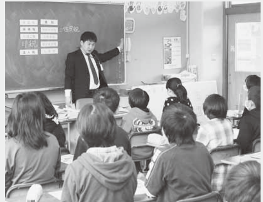
税金の種類を説明する職員(南小)

南小学校では12月16日に実施。税務課職員が講師となり、税に関するビデオやクイズで税金の種類や使い道などを説明しました。教室の最後には児童が「村で集められている税金はどのくらいですか」など、積極的に質問をしていました。