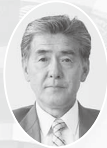
昭和村農業委員長