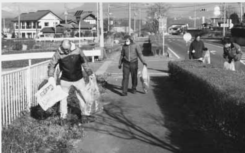
清掃活動に汗を流す4社企業の皆さん

これは、同4社で組織する関屋工業団地連絡協議会により「村に貢献する活動しよう」と毎年行われているもの。この日は12人が参加し、1時間半にわたって昭和インター線沿いのごみ拾いに汗を流しました。