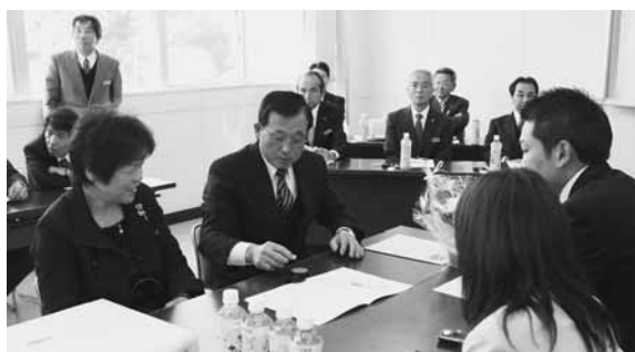
協定書に調印する家族(昨年は9組が締結)