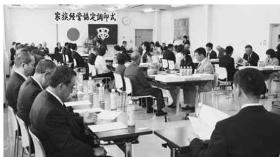
昨年の家族経営協定調印式