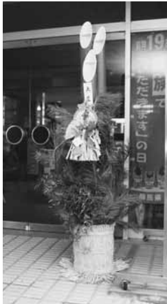
完成した門松(役場)

いを込めて「共生」、「信頼」の文字の書かれた札が添えられ完成。完成した門松は、村内の神社やお寺などのほか役場などの公共施設、総合福祉センター「昭和の湯」にも飾られ、訪れた人たちの目を惹きました。