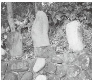
寺の証を物語る石碑