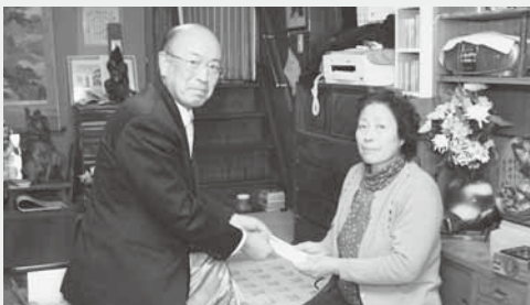
介護慰労金を受け取る家族

村では12月24日、寝たきりなどの高齢者を在宅介護している家族に介護慰労金を支給し、介護の労をねぎらいました。