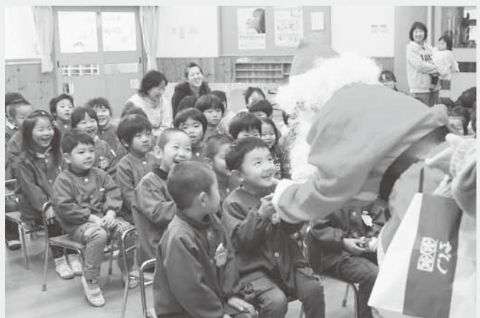
プレゼントを受け取る園児たち

そのほか、クリスマスの紙芝居や手品などが行われ、園児たちはクリスマス会を楽しみました。