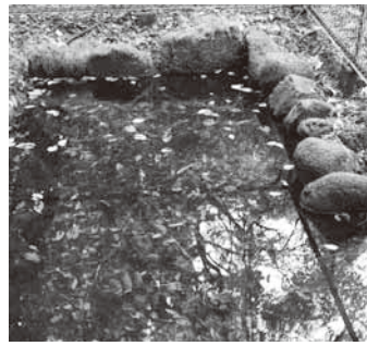
現在の出入の湧水池

開拓初期の住居は、村内の地区からの入植者は、兄弟の家から、桐生から集団入植した人々は大テントでの集団生活をしながら、村外からの入植者で身寄りの無い人はお寺などに身を寄せながら開墾作業に汗を流した。村内に身寄りの無い人々はいつまでも集団生活や寺住まいでいるわけには行かない。「どんな家でもいい、気がねのない自分の家を建てたい」開墾と同時に丸木を集め、屋根はカヤぶき、九尺二間(六畳一間)の大風が吹けば一度でふっ飛んでしまうような掘って建て小屋を建てた。冬の雪の日にはすき間から粉雪が舞い込み、雨の日