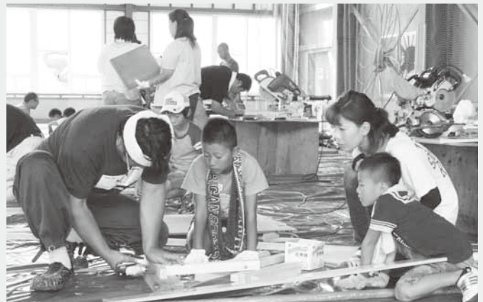
大工さんの指導を受けながら作品づくり

大工さんたちの指導を受けながら、子どもたちは慣れない手つきながらもイスや本棚など思い思いの作品を作り上げていました。