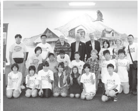
イーグルポイント市庁舎にて