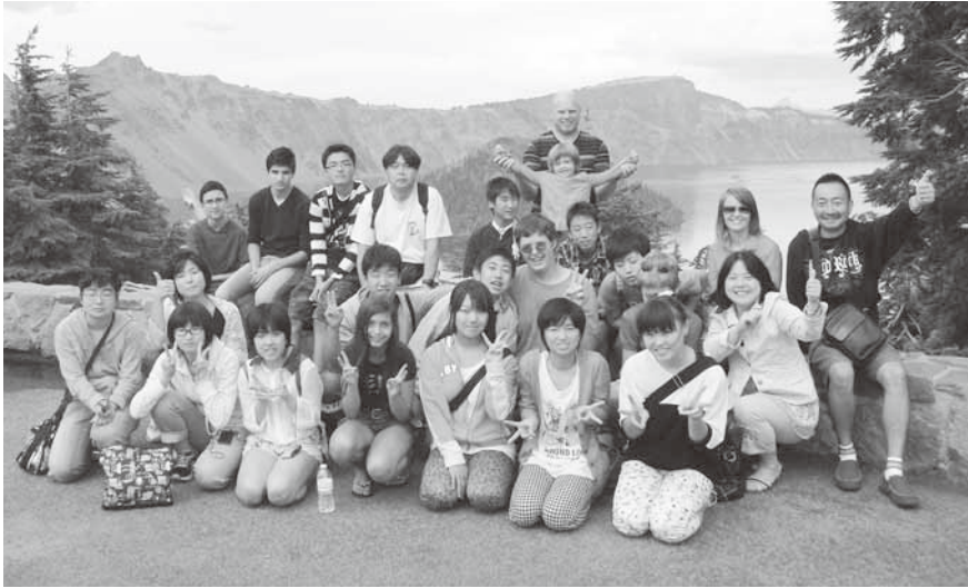
クレーターレイク前で記念撮影

派遣期間は8月3日～12日までの10日間。生徒たちはホームステイのほか、英語の学習、現地の人たちとの交流をとおして、たくさんのことを学ぶことができました。