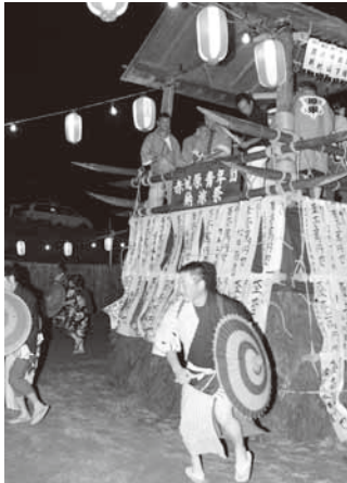
青年団が八木節を披露

はじめ、たくさんの方々のご協力をいただき定着してきました。これからも祭りとおして地域を盛り上げていきたい」と話していました。