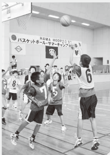
練習に汗を流す子どもたち

キャンプには、横浜市などから集まった小中学生のほか、昭和中学校のバスケットボール部員たちも参加。指導者には神奈川大学バスケットボール部員の皆さんがあたり、参加した子どもたちはシュートやドリブル、試合など熱心に練習を行っていました。