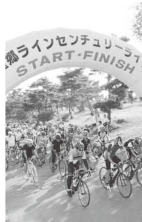
運動公園をスタートする参加者

どでつくる実行委員会が主催。当日は県内外から1,066人が参加しました。イベントは、村総合運動公園からみながみ町の後閑集落センターまでを往復するロングライド110km、川場村のふれあいの家駐車場までを往復するミドル78km、沼田市の南郷の曲屋までを往復するショート40km、昭和村の早おき村までを往復するエンジョイ18kmの4コースで開催。また、会場では赤城高原農業観光協会などのおもてなしが行われました。参加者は、思い思いのペースで望郷ラインに広がる雄大な景色を楽しみながらコースを走り抜けました。