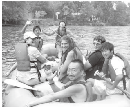
ラフティング体験