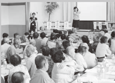
昭和の湯で行われた研修会

村地域包括支援センター職員を講師に「今日から始める脳トレーニング」と題して研修が行われました。「認知症は誰にでも起こるもの。地域で支え合うことが大切」と脳の仕組みや紙芝居形式で認知症の人への対応の仕方を紹介。また、地域の役員などを行うことが最も脳トレーニングに良いと結んでいました。