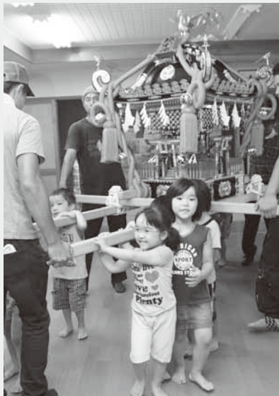
元気におみこしを担ぐ園児たち

今年はいにくの天候のため同区民館の中で行われましたが、園児たちはおみこしに大喜び。大きなかけ声をあげて、元気いっぱいにおみこしを担いでいました。