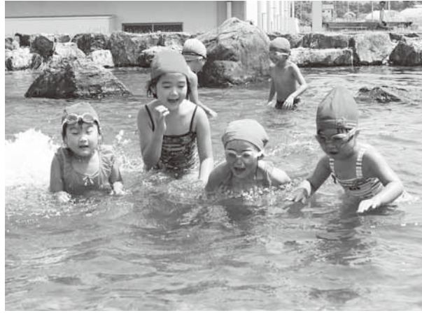
みんなで楽しく水遊び