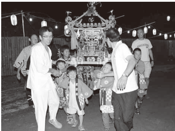
元気いっぱいの子どもみこし

はじめ、たくさんの方々のご協力をいただき定着してきました。これからも祭りとおして地域を盛り上げていきたい」と話していました。