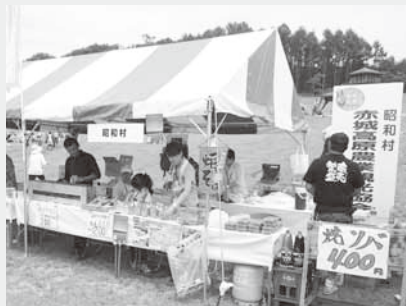
赤城高原農業観光協会の出店