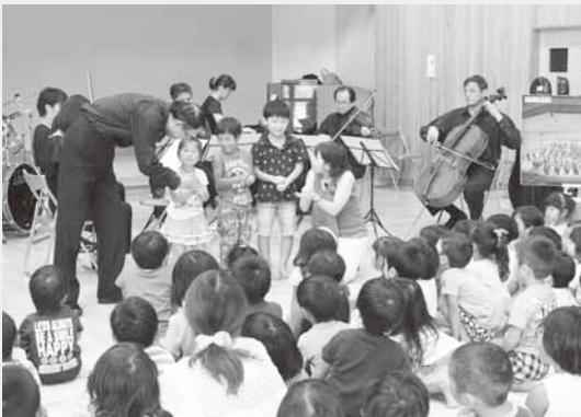
園児も演奏に参加したコンサート

群馬交響楽団による「群響びよびよコンサート」が8月29日、第一保育園で開催されました。