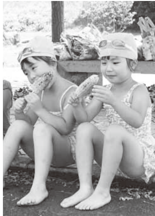
焼きトウモロコシおいしいね

赤城西麓土地改良区では、8月6日から7日にかけて、第一・第二・子育保育園の園児たちを沼田市利根町にある同改良区調整池となりにある親水公園に招待