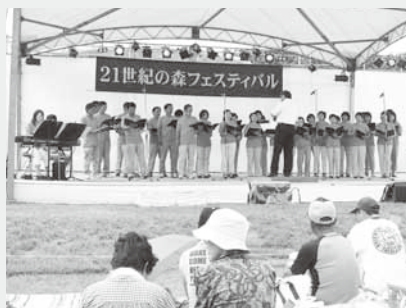
コーラス・アンダンテが美声を披露

21世紀の森フェスティバルが8月25日、県立森林公園「21世紀の森」で開催されました。