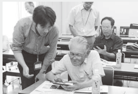
タブレットの使い方を学ぶ参加者

参加者は持ち運びが便利で手軽に利用できるタブレットを実際に使い、インターネット体験やアプリケーションソフトの使い方などを学びました。