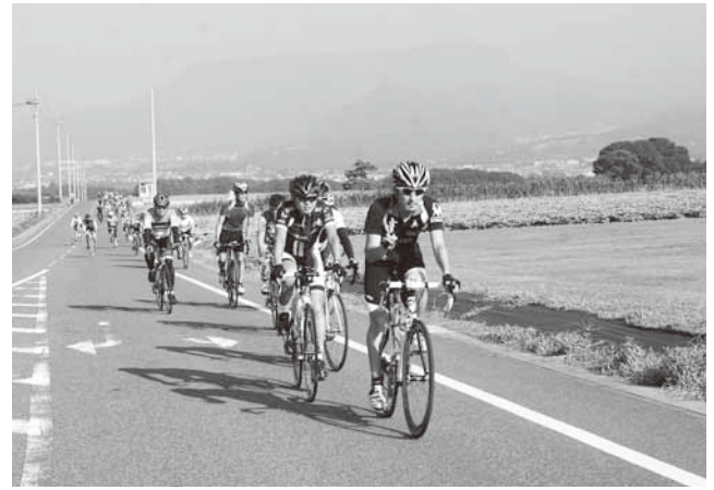
景色を楽しみながら望郷ラインを疾走