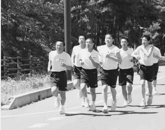
望郷ラインを快走する生徒たち