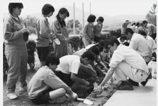
指導を受け植え付けをする生徒たち

当日は生物資源コースの3年生11人が講師となり、中学生56人にゴーヤーの苗の植え方を指導。校舎前に一列に植えられたゴーヤーは、グリーンカーテンとして活用されます。