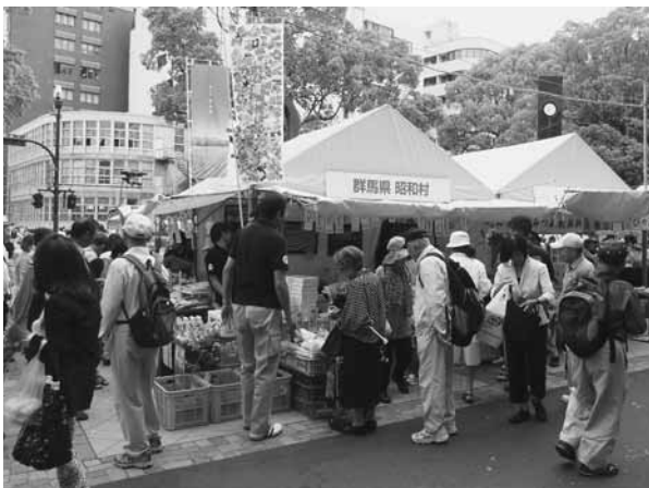
大勢の人でにぎわう昭和村のテント

販売。村をPRしました。「毎年この野菜を買いにバザーに来ています」と再び訪れるお客さんも多く、村のテントは連日賑わいました。