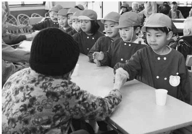
お年寄りの皆さんと握手で交流