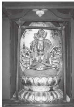
ご本尊の千手観音菩薩

参拝するようになり、末期には西国三十三所観音霊場巡礼の信仰が現れた。その後、板東・秩父の札所(秩父はのちに三十四となる)が成立し、室町末以降、この三ヶ所百観音を巡礼することが行われ、江戸時代には庶民の間に広まり、各地に「百番供養」の石塔が建立されている。