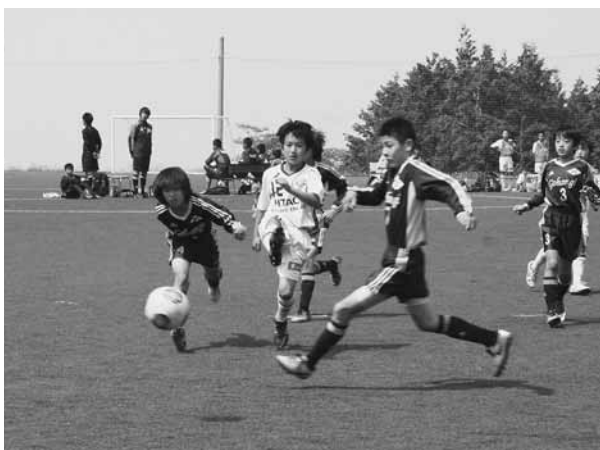
熱戦を繰り広げる子どもたち