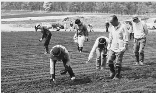
種まきに汗を流す村づくり協力委員の皆さん