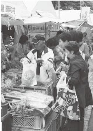
新鮮野菜は大盛況

会場にはおよそ200の店が横浜スタジアムを囲むように並び、村のテントでは、レタスやキャベツなどの高原野菜をはじめ、こんにやく、ジャム、ジュース等を