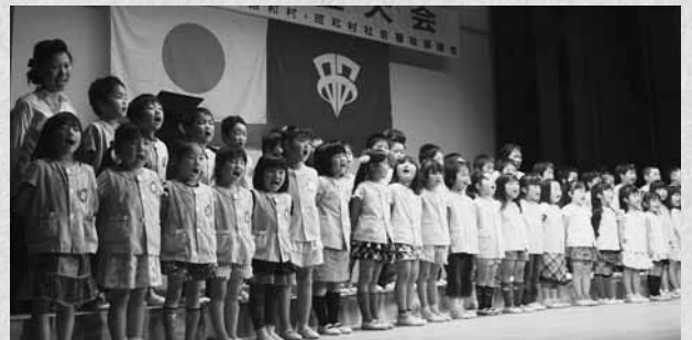
かわいらしい歌声を披露した園児たち

深い傷跡から復興へと国民すべての方々が無我夢中で働いてきた時代でした。その中で、希望を抱いて生活してこられたのも、地域の方々との協力、励まし合いがあったからこそだと思えます。これからの人生を本日のこの感動を忘れることなく、体に気をつけ、家族を大切にして地域社会に恩返しができるように努めたいと思います」と述べました。