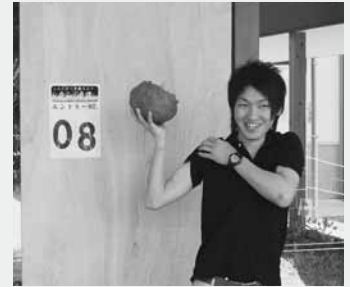
自慢の力こぶを披露

道の駅「あぐりーむ昭和」では5月26日、こんにゃく植え付けまつりを開催しました。