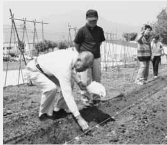
こんにゃく芋の植え付け体験