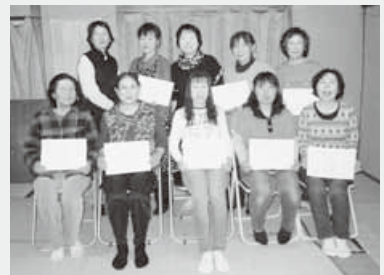
筋トレ体操上級に認定