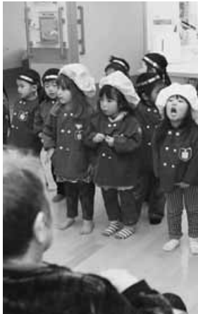
歌を披露する園児たち(菜の花館)

がお遊戯や歌を披露。かわいらしい衣装に身を包んだ園児たちが元気いっぱいにお遊戯を披露すると、お年寄りの皆さんは「かわいいね」と笑顔で手拍子をするなど、たのしく交流しました。