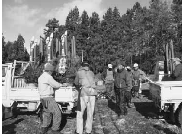
手際よく制作されていく門松