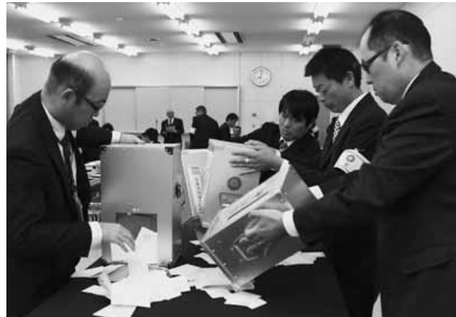
役場会議室で行われた開票作業