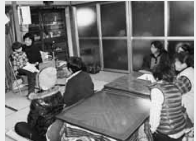
腹話術人形を使ったお話

また、同会では昨年5月にらくらく筋トレ体操上級の認定式が行われ、8人が認定証を受け取りました。