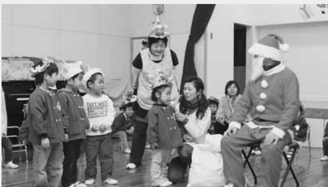
サンタさんに質問する園児たち