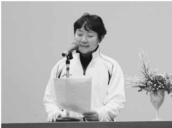
壇上で婦人会での取り組みを発表