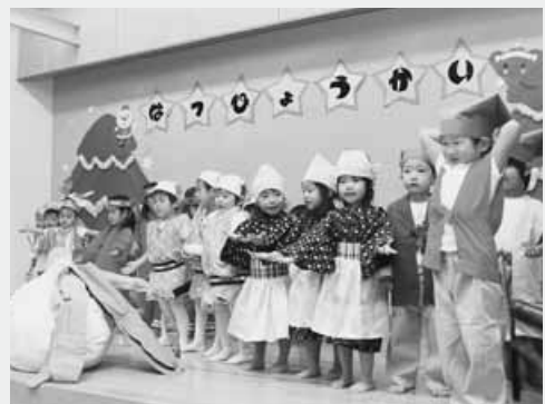
元気いっぱいに演技を披露する園児たち

年小組の園児たちによるオペレッタ「おおきなかぶ」では、園児たちがかわいらしい演技を披露。集まった保護者から大きな歓声が上がっていました。