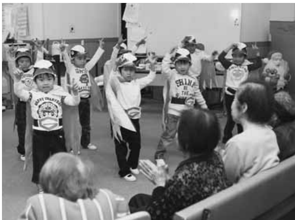
元気いっぱいにお遊戯を披露(デイサービスセンター)

がお遊戯や歌を披露。かわいらしい衣装に身を包んだ園児たちが元気いっぱいにお遊戯を披露すると、お年寄りの皆さんは「かわいいね」と笑顔で手拍子をするなど、たのしく交流しました。