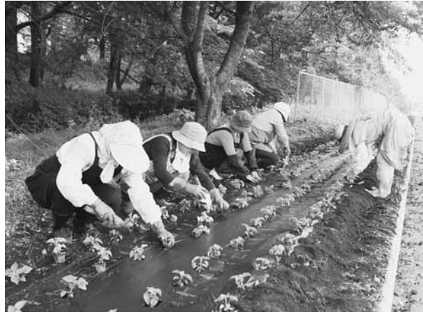
サルビア植えに汗を流す村づくり協力委員