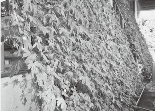
役場に設置されたグリーンカーテン