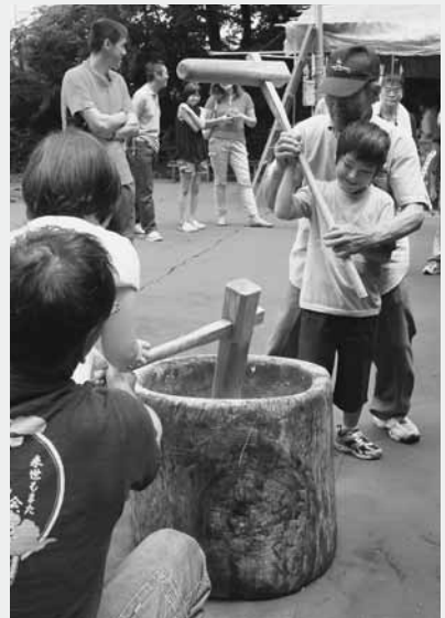
餅つきに参加する子どもたち

この日、会場には県内外からたくさんの人たちが訪れ、恒例となった餅つきやつきたてのお餅にブルーベリーを包んだ「あんびん」づくりを体験するなど、旬の果実を楽しみました。