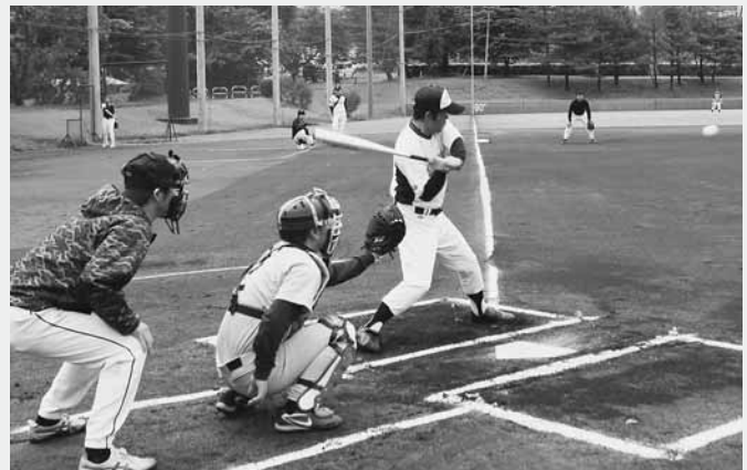
白熱した試合が展開された大会