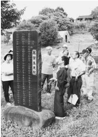
思いを巡らせる参加者

役場から庁用バスに乗り、午後1時30分からおおよそ半日かけて行われた講座では、村内に数多く点在する村指定文化財「森下城跡」や「円乗院の宝篋印塔（ほうきょういんとう）」などを車中から見学。また、永井分校跡や鍛屋地古墳公園、