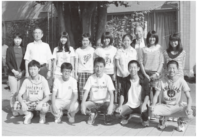
元気に行ってきます！