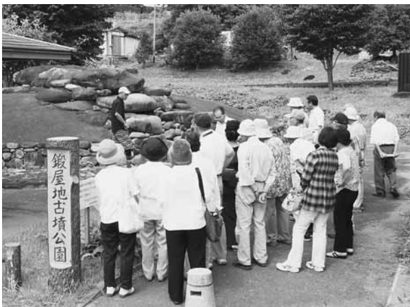
五鈴鏡などが出土した鍛屋地古墳

東小学校みんなの郷土資料室、生越の横井戸では、車を降り同会からそれぞれ説明がされ、参加者は当時の情景に思いを巡らせていました。