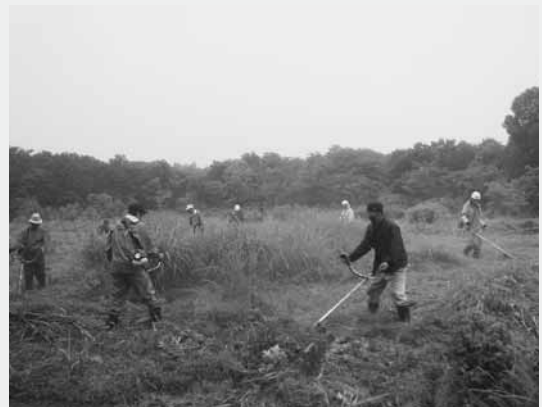
下草刈りに汗を流す猟友会の皆さん

また、同会では今年、農作物の鳥獣被害防止のため、ハクビシン29頭、イノシシ9頭、シカ53頭、アライグマ1頭、ニホンザル3頭、クマ1頭を捕獲しました。