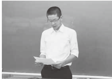
抱負を発表する生徒

昭和中学校では、アメリカ・オレゴン州へのホームステイ出発を控えた中学生の壮行会が7月27日、村公民館で行われました。