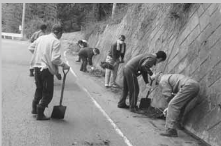
道路愛護に汗を流す三ツ谷地区のみなさん

皆さん、道路愛護運動にご協力いただきありがとうございます。ありがとうございました。