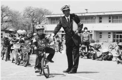
自転車免許の実技テスト(東小)

また、他の児童は村交通指導員の指導のもと、校庭で自転車の交通ルールや乗り方について練習しました。