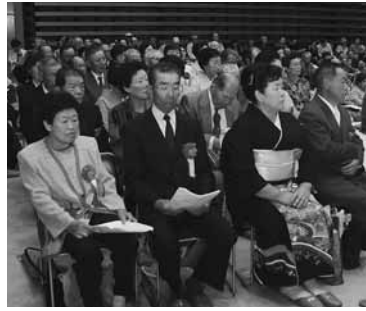
昨年の敬老会・福祉大会