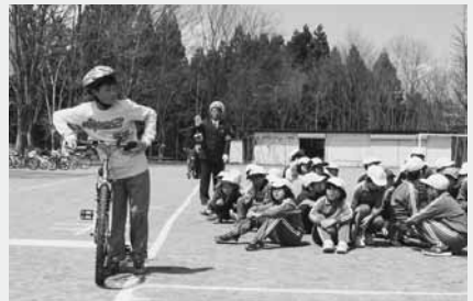
左右をよく確認して渡ろう(大河原小)