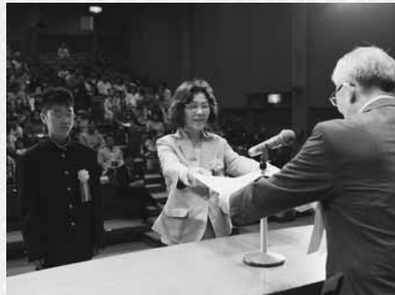
フォトコンテスト表彰式