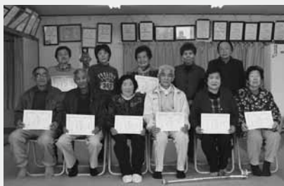
鎌沢さくらサロンの皆さん