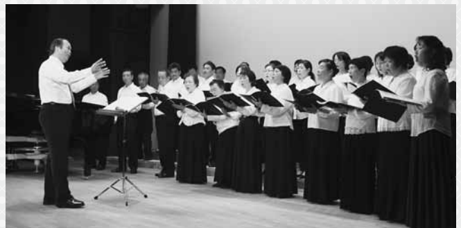
見事なハーモニーを披露したコーラス・アンダンテ