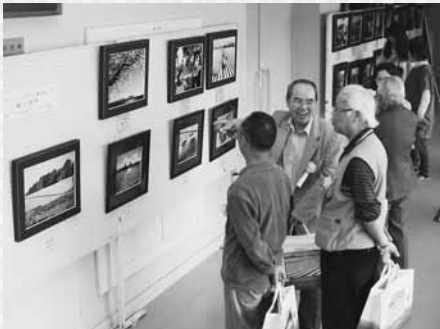
公民館に展示された入賞作品