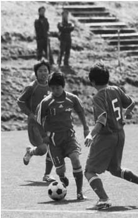
白熱した試合を展開

今回の交流会には小学生5チーム、中学生3チーム、およそ160人が参加。白熱した試合が展開されました。また、FC昭和と昭和中サッカー部の保護者が用意したみそおでんも振る舞われました。