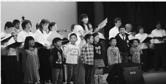
来場者も一緒に歌ったジャズコンサート