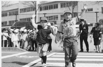
道路に出て横断の練習(南小)