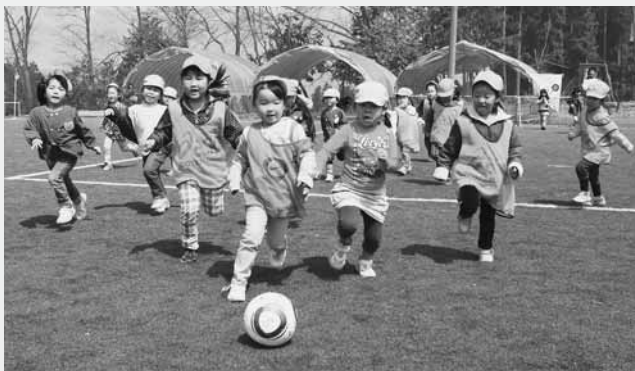
サッカーを楽しむ子どもたち

村内3保育園の年長組の園児たちが4月18日、千年の森J-Wingsでサッカーの試合を行いました。