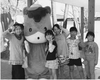
子どもたちに大人気のぐんまちゃん