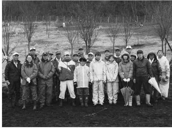
記念植樹に参加した4組の新婚さん