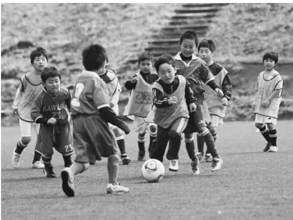
サッカーで交流する子どもたち