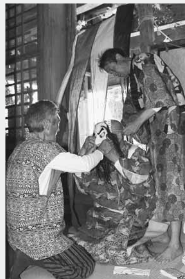
準備をする保存会の皆さん

また、奉納の後には保存会の皆さんによるもち投げが行われ、訪れたたくさんの人たちで賑わいました。