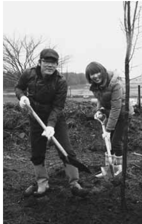
夫婦で協力して植樹

対象となったのは、平成23年度中に婚姻届けを提出し、村に住んでいる18組の夫婦。記念植樹の当日には、希望された