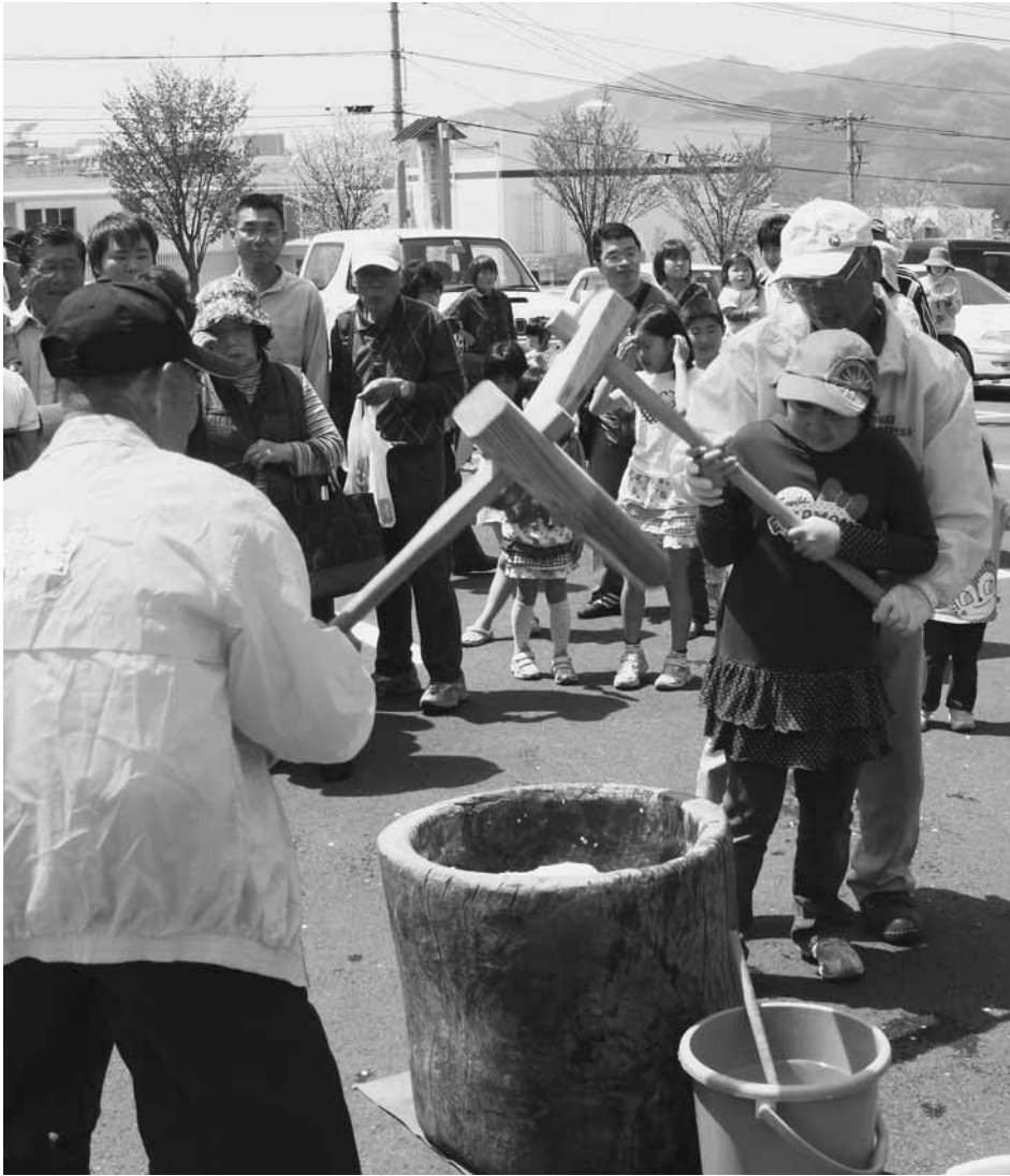
たくさんの人たちが参加した恒例の餅つき

「昭和の日」を記念したイベントが4月29日、村内各地で開催されました。道の駅「あぐりーむ昭和」での赤城高原農業観光協会によるイベントのほか、公民館多目的ホールでは合唱祭やジャズコンサート、フォトコンテストの表彰式などが開催され終日にぎわいました。