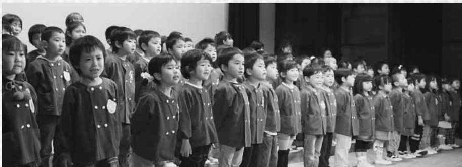
元気いっぱい唱歌う園児たち