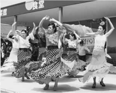
エル・ヒラソルの華麗な踊り