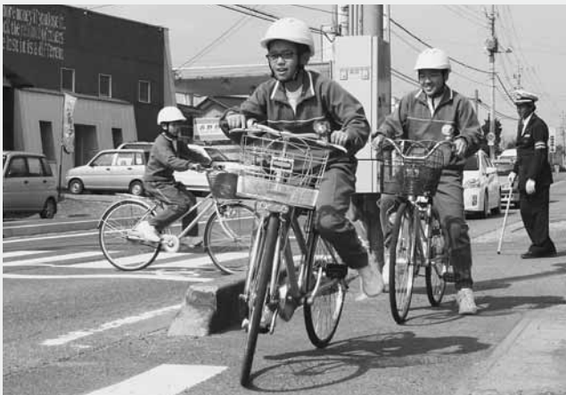
自転車の交通ルールを再確認(昭和中)