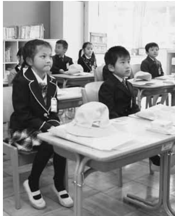
今日から1年生(東小)