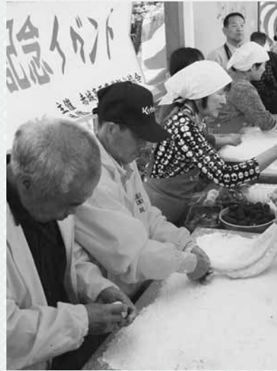
つきたての餅はいちご大福に