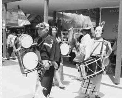
会場を盛り上げたチンドン倶楽部