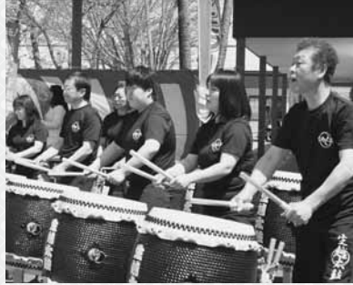
生越太鼓の勇壮な響き