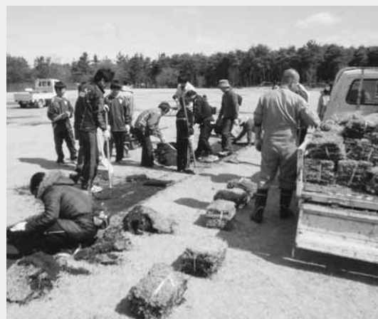
芝の張り替え作業に汗を流す参加者

当日は、FC昭和・昭和中サッカー部・FC KRILOのメンバーや保護者など、およそ110人が参加。午前8時半から張り替え作業に汗を流しました。