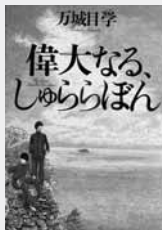
偉大なる、しゅららぼん 万城目 学 (著) 集英社