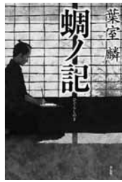
蝸ノ記 葉室麟 (著) 祥伝社

鳴く声は、命の燃える音に似て——命を区切られたとき、人は何を思い、いかに生きるのか？命を区切られた男の気高く凄絶な覚悟を穏やかな山間の風景の中に謳い上げる、感涙の時代小説！