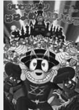
はなよめとゾロリじょう 原 ゆたか (著) ポプラ社