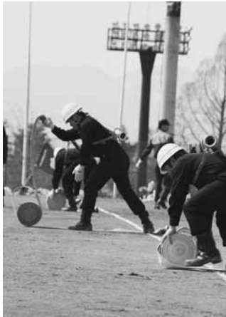
ポンプ操法を行う団員

ポンプ操法では、可搬ポンプ、自動車ポンプの順で訓練を実施。団員らは利根沼田広域消防職員の指導のもと、一つ一つの動作についての入念な指導に耳を傾けていました。