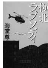
極北ラブソディ 海堂 尊 (著) 朝日新聞出版