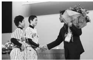
花束を手渡す中学生