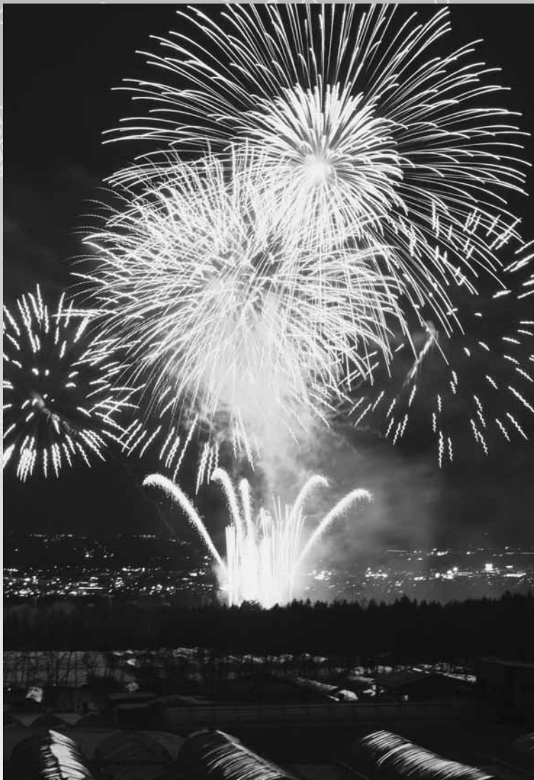
真冬の夜空を彩った雪上火火