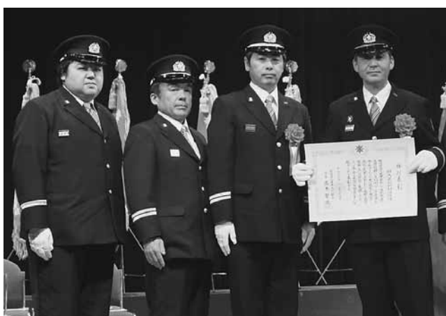
賞状を手にする本団の皆さん