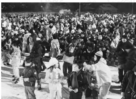
盛り上がったビンゴ大会

打ち上げられた花火が真冬の夜空に大輪の花を咲かせる、会場からは大きな歓声が上がっていました。