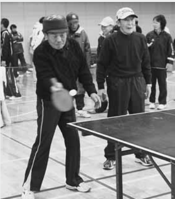
一球一球が真剣勝負