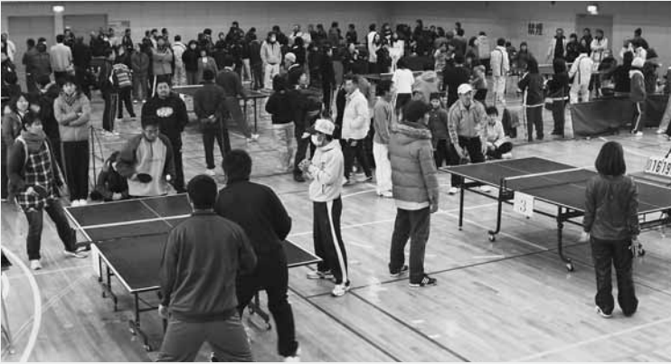
およそ420人が集まり熱戦を繰り広げた

村体育協会が主催する第43回ピンポンフェスティバルが2月6日、社会体育館で開催されました。