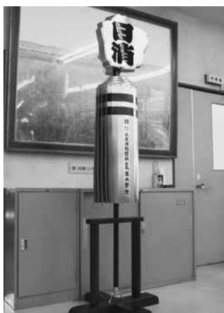
特別表彰の「まとい」