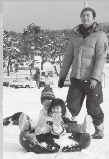
スノーチュービングに大喜び