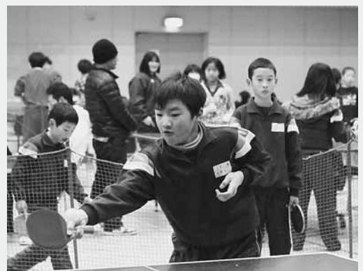
この一球は、はずせない!