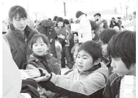
チョコレートの無料配布