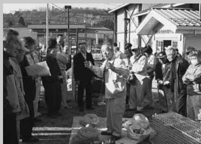
実際のわなを使った実習

当日は村内外からおよそ100人の農業関係者が参加。県猟友会会員2人を講師に招き、鳥獣捕獲技術の講義や多目的屋内運動場へ移動し、実際のわなを使った実習が行われました。