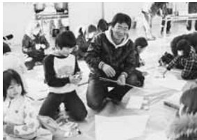
親子で楽しく工作

は元気いっぱい駆け回り、親子で凧揚げを楽しみました。その後、昭和凧の会による大凧と連凧揚げが行われ、大凧が宙に舞うと大きな歓声が上がっていました。