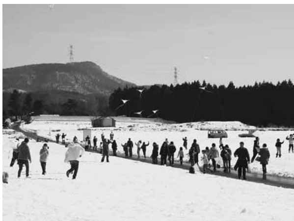
凧揚げを楽しむ親子

は元気いっぱい駆け回り、親子で凧揚げを楽しみました。その後、昭和凧の会による大凧と連凧揚げが行われ、大凧が宙に舞うと大きな歓声が上がっていました。