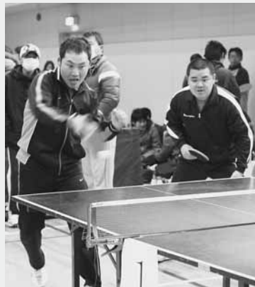
Aクラスのハイレベルな攻防