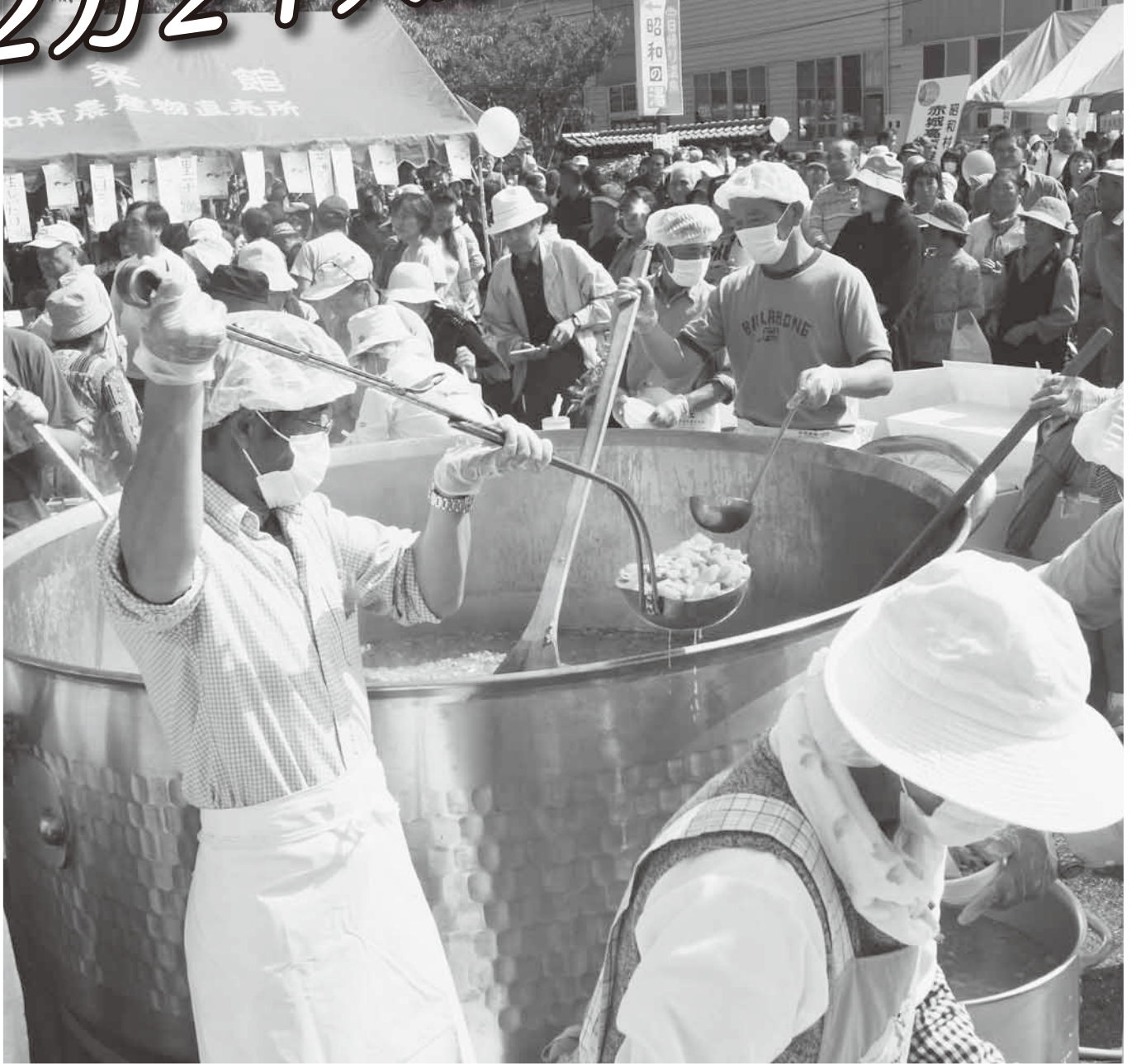
まつりの名物5千食分のこんにゃく大鍋