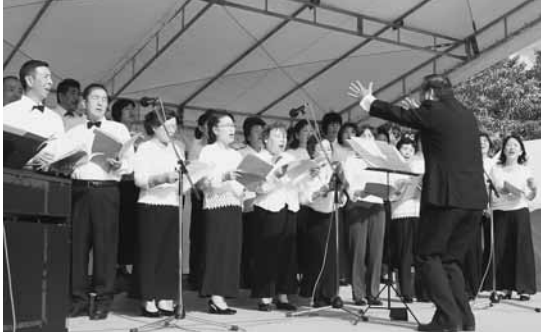
美しい歌声を披露