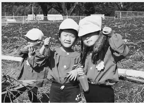
たくさん掘れたよ!