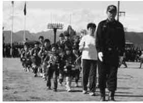
元気いっぱいの幼年消防クラブ