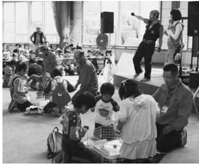
大人気のベイブレード大会