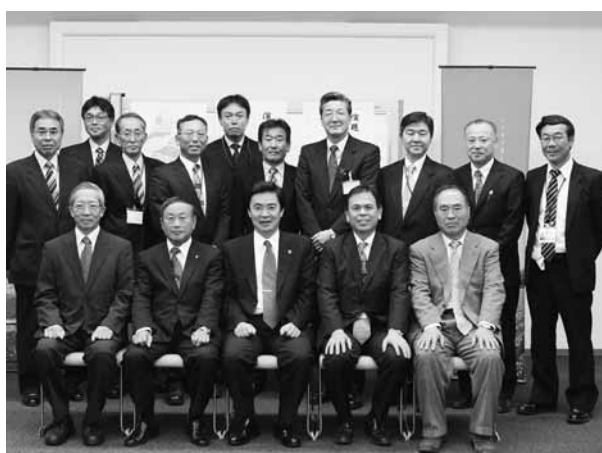
研修会に参加した取手市・昭和村職員

氏を講師に「社内の意識改革」と題して講話が行われました。また、講話終了後には村をより知ってもらうため村紹介DVDを鑑賞。そのほか情報交換会が行われ、防災協定に関する事だけではなく今後観光面などでもお互いの交流を深めるための意見交換を行いました。