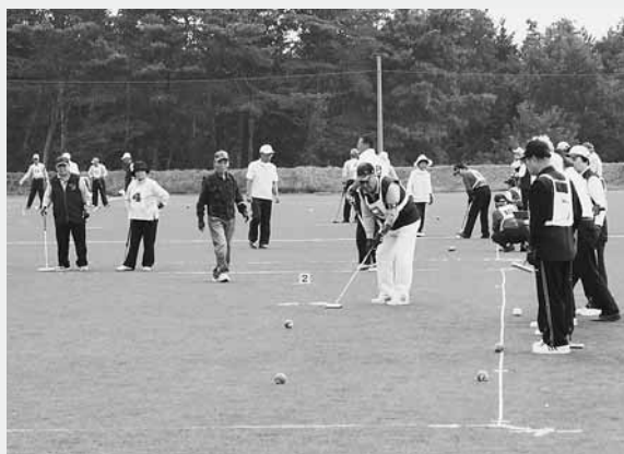
白熱したプレーを展開する参加者

参加者は、日ごろの練習の成果とチームワークを発揮。会場となった千年の森J-Wingsは緊張と熱気に包まれていました。