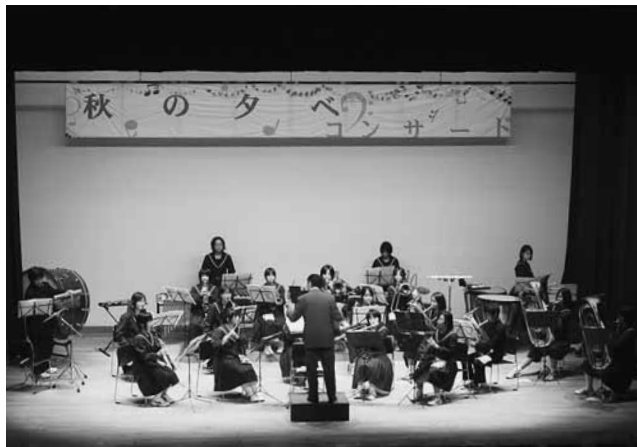
見事な演奏を披露した昭和中ブラスバンド部員