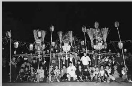
コミュニティ事業で購入したまんどう

購入したまんどうは、9月30日と10月1日、森下地区で毎年行われる豊年まつりで披露され、まつりを訪れた大勢の人たちが見守るなか、地元中学生が元気に担ぎまわりました。