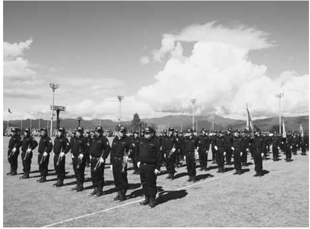
きびきびとした態度で行われた秋季点検