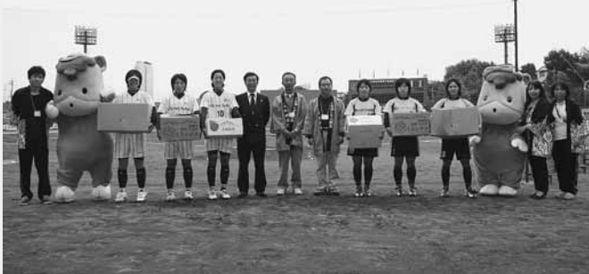
激励品を手に記念撮影

日本ソフトボール協会主催の第43回日本女子ソフトボールリーグ1部・第8節「高崎大会」が10月2日から3日の2日間、高崎市城南野球場で行われました。