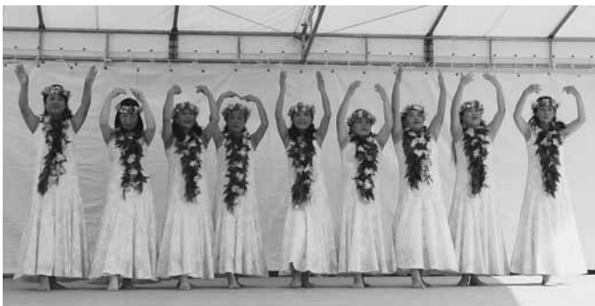
華麗なフラダンスで会場を魅了