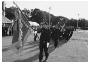
りりしい表情で分列行進

けながら点検項目を入念にチェック。きびきびとした態度で訓練を行いました。晴れ渡った秋空の下、午後1時から行われた秋季点検には214人の消防団員が出席。村消防委員や各区長らが見守る中、姿勢服装や機械器具の点検が行われたほか、ラッパ吹奏や各分団による部隊訓練、ポンプ操法、分列行進が披露されました。