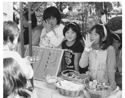
ちびっこ商店街の出店