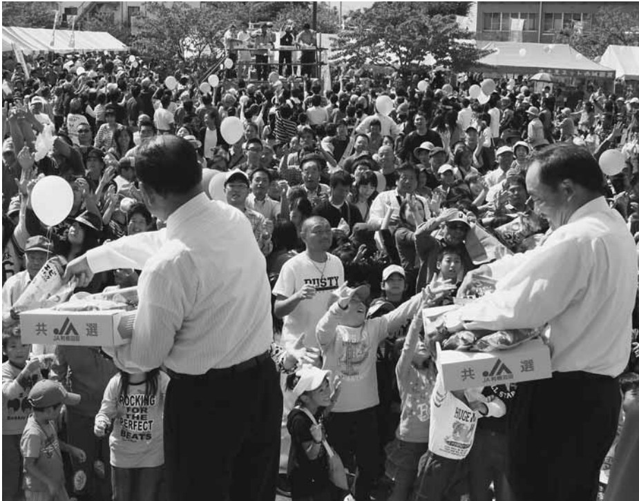
毎年大盛況のもち投げ