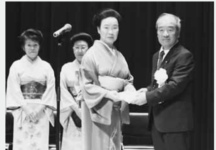
募った浄財は社会福祉協議会へ