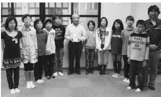
売上の一部は村社会福祉協議会へ

また、10月22日には各グループの代表者が村社会福祉協議会を訪れ売上の一部8,152円を寄付しました。 今年度は小学5・6年生の10グループ57人が参加し、3回の経営会議を経て秋まつりに出店。ホットケーキやアクセサリーなどの販売を行いました。