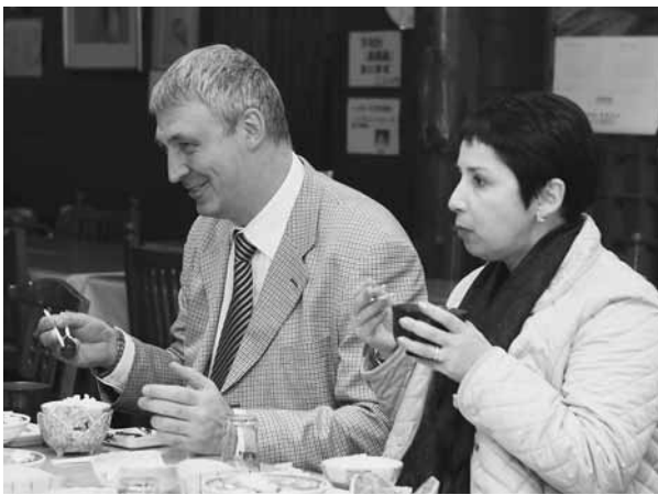
コンニャク料理を試食するフェシユン一等書記官

「コンニャクは様々な食べ方があり、とてもおいしい。コンニャクをロシアに広めるためにも、お互いに文化や考え方を学び相互理解を深めていければ」と話していました。村にはこのほかにもロシア旅行会社の経営者らが視察に訪れるなど、ロシアとの交流の機会も多く、さらなる交流が期待されます。