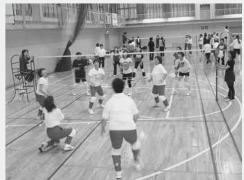
熱戦を繰り広げた婦人会会員