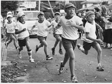
元気に駆け出す児童(南小)

村内の各小学校では10月26日から27日にかけて、校内マラソン大会を実施しました。