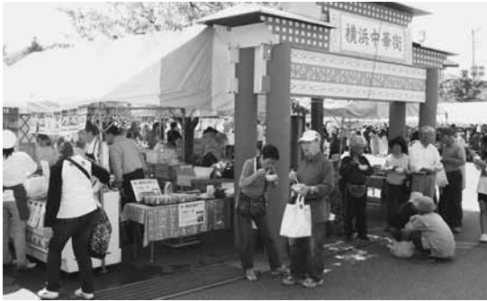
横浜ミニ中華街の出店