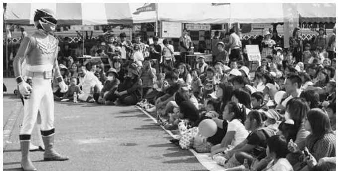
子どもたちに大人気のヒーローショー