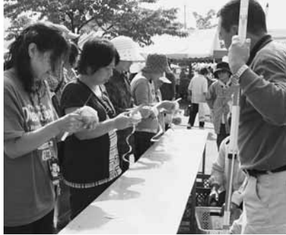
リンゴの皮むき大会