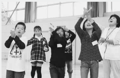
上手に紙トンボを飛ばせるかな？

子どもたちは、安全管理員が用意してくれた厚紙とストローを使い、紙トンボ作りに挑戦。出来あがった紙トンボを飛ばし楽しいひとときを過ごしました。