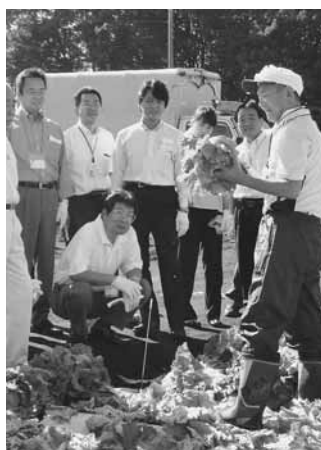
レタス畑で収穫体験

県をあげて展開している大型観光キャンペーン・群馬デスティネーションキャンペーン（群馬DC）の「全国宣伝販売促進会議」が9月8日、グリーンドーム前橋で開催されました。