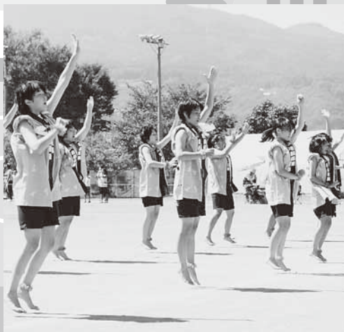
2・3年生女子による創作ダンス