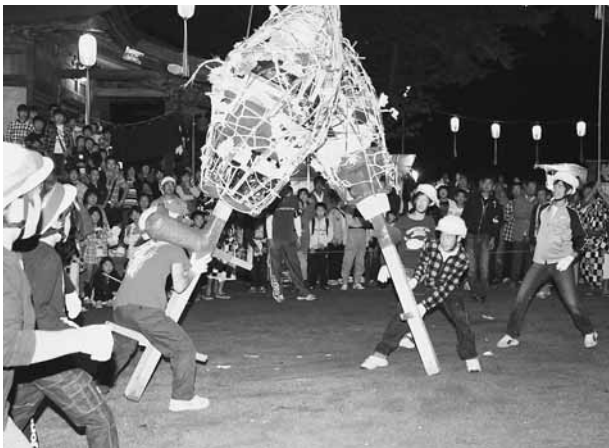
まんどろをつっかける瞬間(川額地区)