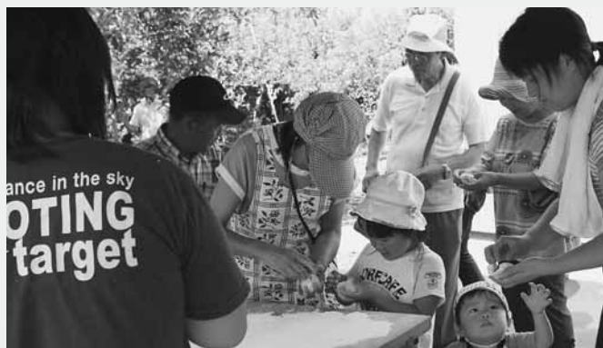
あんびんづくりに挑戦

秋晴れとなったこの日、むいた皮の長さを競うりんごの皮むき大会が行われたほか、つきたてのお餅にりんごやぶどうを包んだ「あんびん」づくりを体験するなど、来場者は昭和村の秋の味覚を楽しみました。