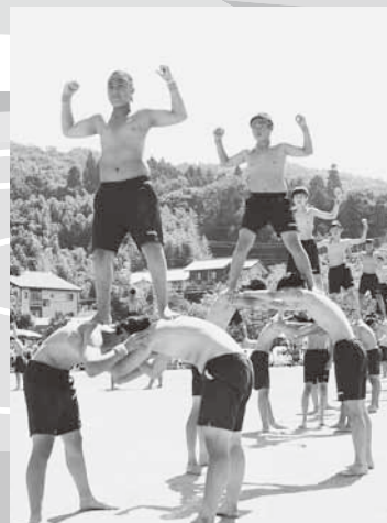
大迫力の組立体操