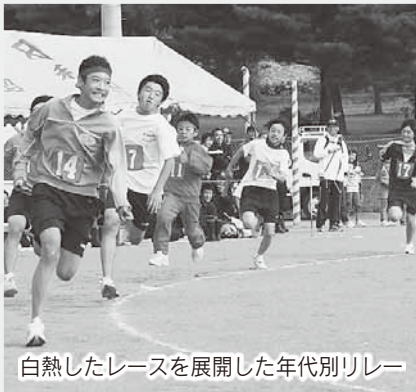
白熱したレースを展開した年代別リレー