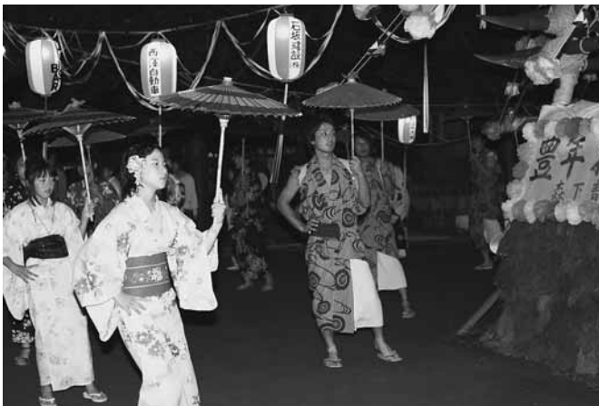
揃いの傘で八木節を披露(森下地区)