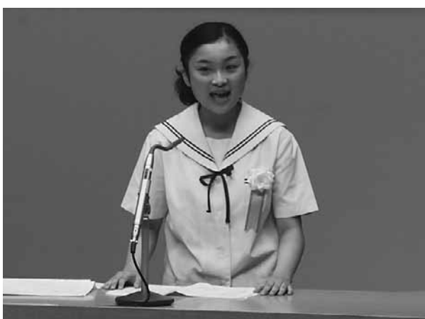
気持ちのこもった発表を披露