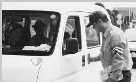
安全運転を呼びかける交通指導員

行きかうドライバーに夕暮れ時と夜間の歩行者・自転車への注意や飲酒運転の根絶、すべての座席のシートベルト着用を呼びかけました。