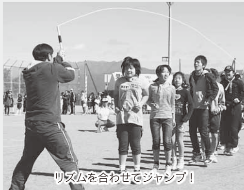
リズムを合わせてジャンプ!