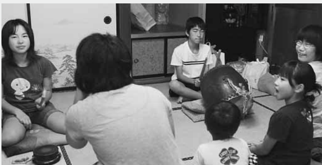
先祖供養の念仏を唱える子どもたち