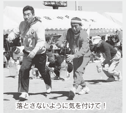
落とさないように気を付けて!

村主催の第43回村民運動会が9月26日、総合運動公園多目的グラウンドで開催され、22種目が行われました。6種目で競われた地区対抗戦では、田岸・大堀が見事優勝を勝ち取りました。また開会式後、平成22年度体育協会表彰が行われました。