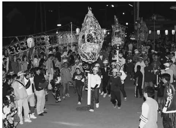
大勢の見物客が見守るなか入場するまんどろ(森下地区)