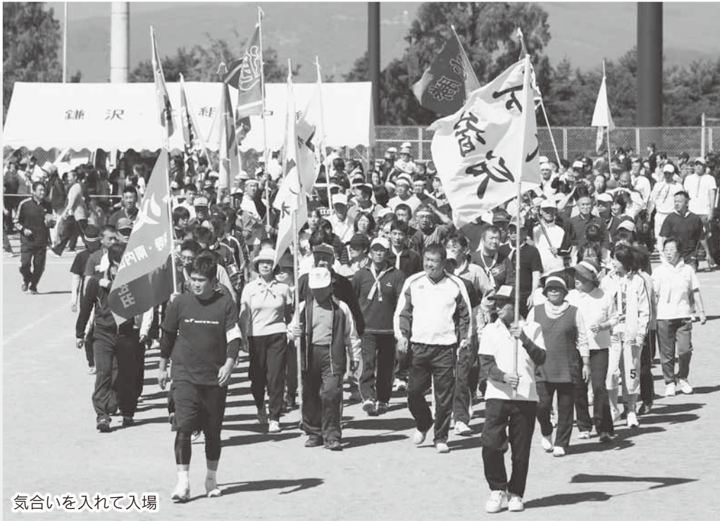
気合いを入れて入場

村内各地で秋の大運動会が開催されました。ここでは村民運動会、各小中学校・保育園で行われた運動会の様子を紹介します。