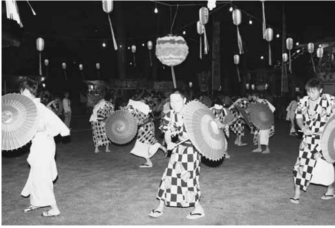
まつりを盛り上げた八木節(川額地区)

境内に詰めかけた大勢の見物客が見守るなか、迫力ある七回めぐりを披露。まんどろがつつかけあう度に見物客から歓声が上がっていました。