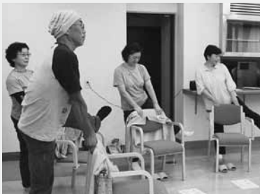
らくらく筋トレ体操で筋力アップ

日立研修所では、妖精の森サロンの皆さんが毎週木曜日午後2時から、らくらく筋トレ体操を行っています。