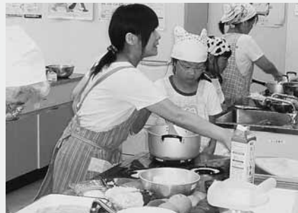
親子で協力して料理づくり

子どもたちは昭和村食生活改善推進員の指導を受けながら、楽しく料理作りを行いました。