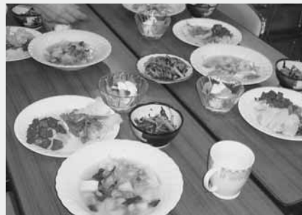
おいしい料理の出来あがり