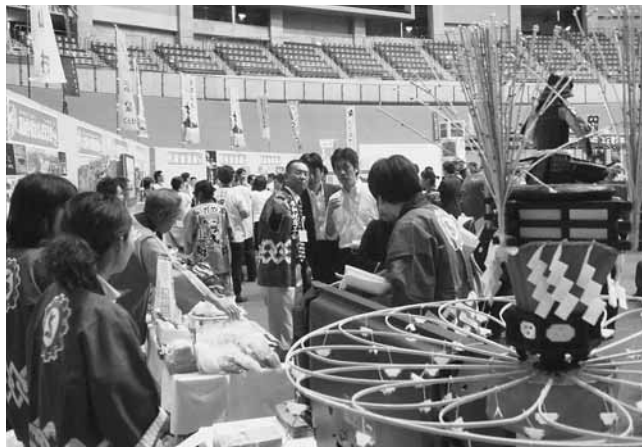
たくさんの関係者が詰めかけた全国宣伝販売促進会議