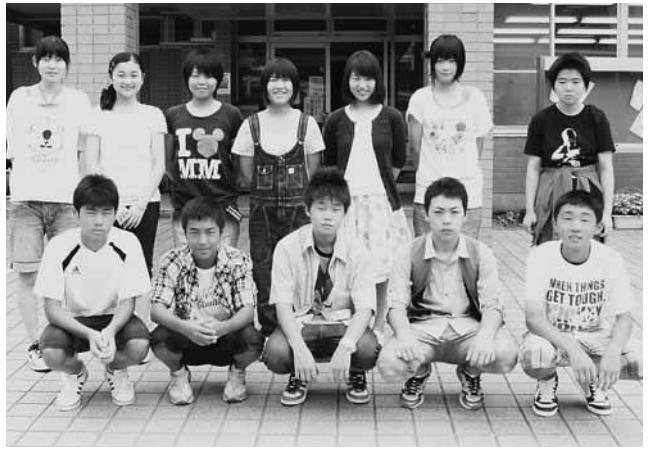
元気に行ってきます！