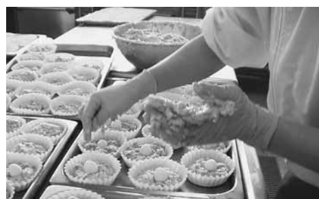
手作りで作られている給食

給食費は毎月末日が振替日となっております。月末には口座残高をご確認いただき、22年度も引き続き完納できますよう皆様のさらなるご協力をお願いいたします。