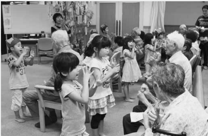
かわいらしい歌声を披露する園児たち

第二保育園の年長組の園児13人が7月12日、村デイサービスセンターを訪れ、同センターに通うお年寄りに歌や踊りを披露、握手で交流しました。