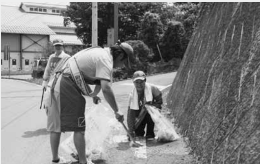
ゴミ拾いに汗を流す組合員