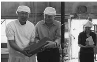
北毛久呂保で製造過程を視察