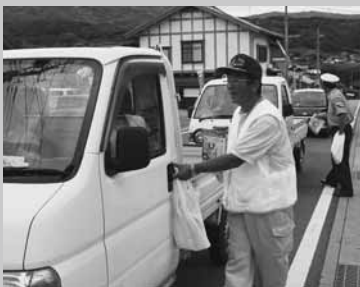
安全運転を呼びかける安全会役員ら(森下)