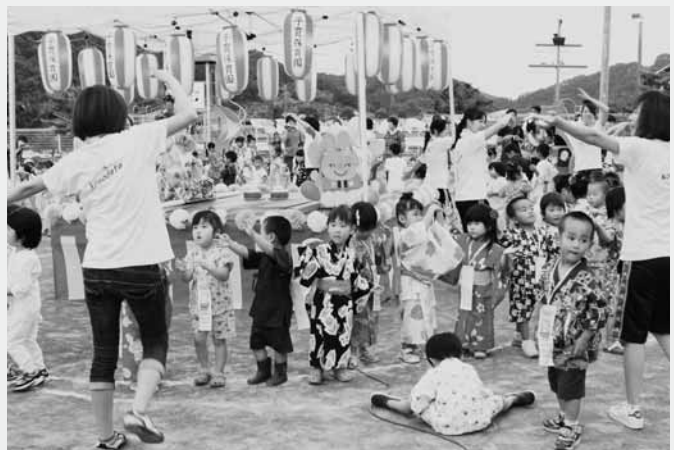
みんなで踊ると楽しいね

子育て保育園では、開始後降りだした雨のため園舎で行われた夜店では、ヨーヨーやスイカなど子どもたちの大好きなものが盛りだくさん。また、雨の合間をぬって花火も行われました。