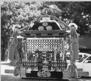
コミュニティ事業で修繕されたおみこし

大勢の担ぎ手たちによりにぎわいを見せたおみこしの渡御は、沿道に集まった人たちに夏の訪れを告げていました。