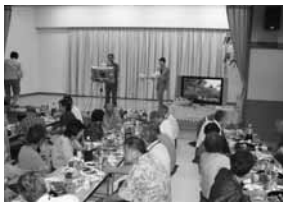
カラオケを楽しむ参加者

その後、北毛久呂保の作業場内でコンニャクの製造過程を見学。昭和の湯でカラオケを楽しみ、温泉で一日の疲れを癒した参加者は昭和村の一日を満喫しました。