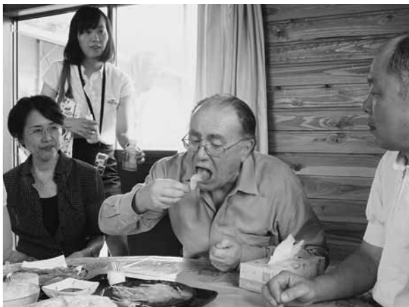
コンニャクを試食するマクレーン大使