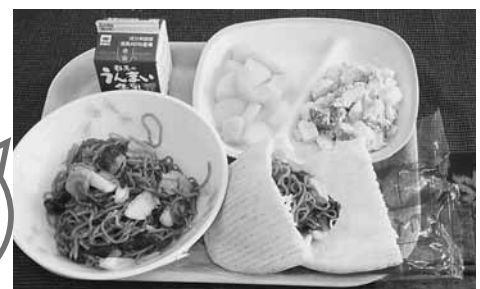
おいしい給食の できあがり