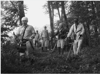
奉仕活動に汗を流す職員ら

村職員互助会では7月17日、総合運動公園付近の生活環境保全林に設置された遊歩道の下草刈りなど、奉仕活動を行いました。