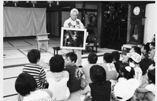
ホタルの説明を受ける子どもたち

ホタル観察では、遊水地を飛び交うホタルの幻想的でやさしい光に参加者から歓声が上がっていました。