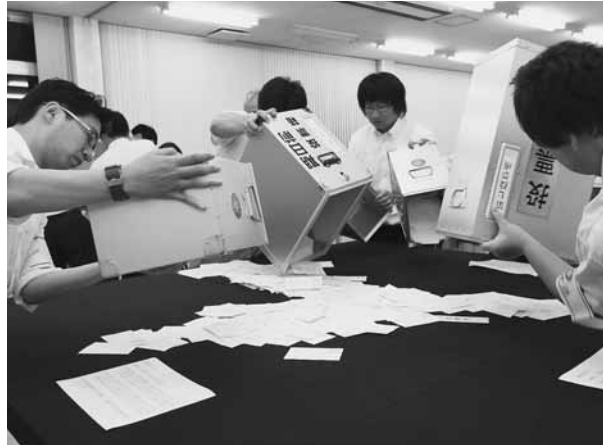
役場での開票の様子