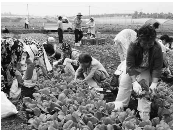
小松菜の収穫体験を楽しむツアー参加者

その後、北毛久呂保の作業場内でコンニャクの製造過程を見学。昭和の湯でカラオケを楽しみ、温泉で一日の疲れを癒した参加者は昭和村の一日を満喫しました。