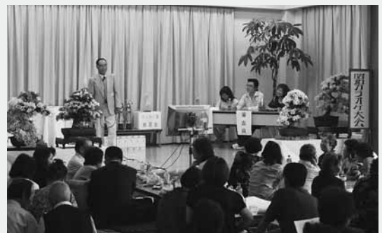
自慢の美声を披露する参加者

なお、カラオケ大会の参加費は村の社会福祉に役立ててもらおうと、同会から村社会福祉協議会へ寄付されました。