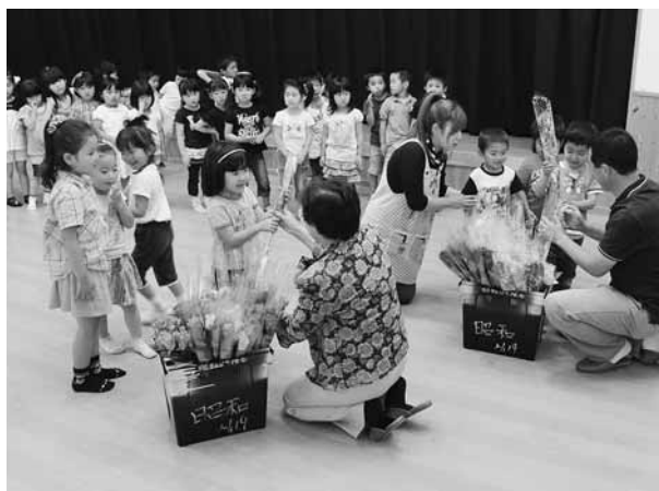
きれいなバラをありがとう(子育て保育園)