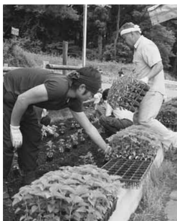
手際よくサルビアを植え付け