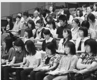
講演に耳を傾ける参加者