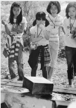
炭焼き体験をするファインズの子どもたち

参加した24人の子どもたちは、蓮の花やマツボックリなどを使って炭焼き体験を楽しみました。