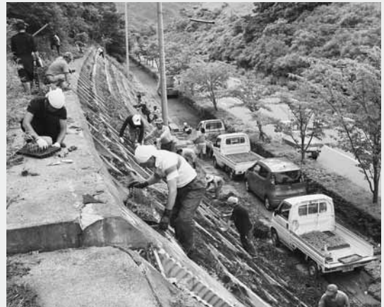
作業に汗を流すボランティアのみなさん

この花植えは「村の景観を守り訪れた人たちに喜んでもらおう」と、「花と緑のぐんまづくり推進事業」の一環「花のゆりかごプロジェクト」により供給された花の苗や、同保存会が用意した苗を使い行われたものです。