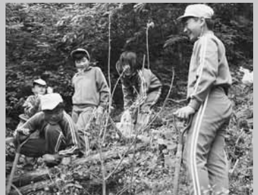
植樹に汗を流す児童たち

植樹には4・5年生の28人が参加。スグリやミズナラなど4種類、16本を植樹しました。