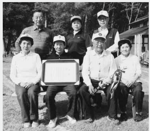
見事優勝に輝いたメンバー

汗を流し日々の技術向上に励んでいます。TBG会では一人でも多くの方の入会をお待ちしています」と話していました。