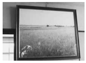
役場に展示された「田園」