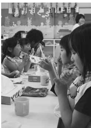
上手に磨けたかな？（第一保育園）

ちんと磨きましょう」と大きな歯の模型を使って正しいブラッシングの方法を実演。園児たちは鏡とにらめっこしながら歯みがきの練習を行いました。