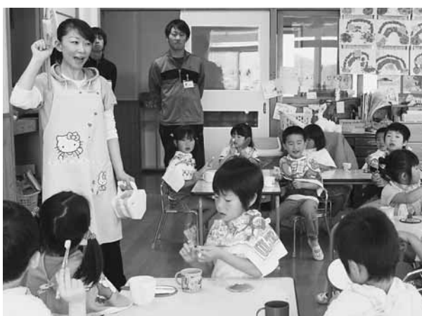
しっかり磨いて虫歯をなくそう！（子育て保育園）