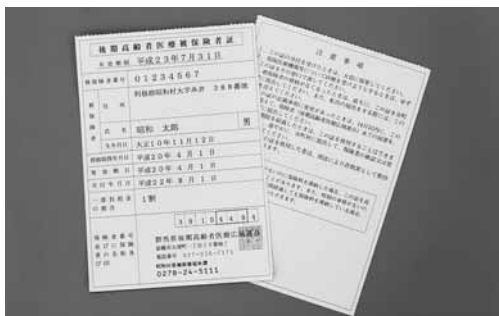
新しい保険証 (見本)

8月1日から医療機関等の窓口で提示していただく「後期高齢者医療被保険者証」が新しくなります。