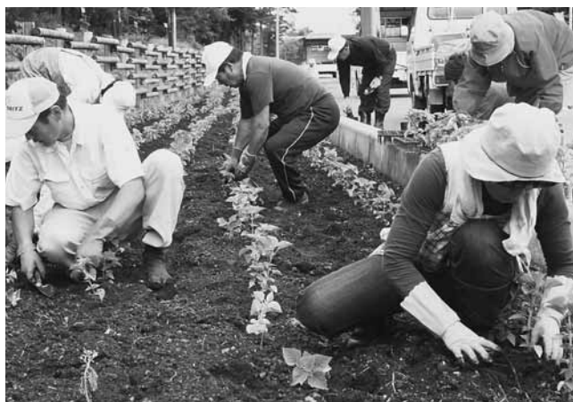
サルビア植えに汗を流す村づくり協力委員ら