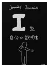
I型自分の説明書 Jamais Jamais (著) 文芸社

俺はどうなってしまった？ 一体何が起きている？ 首相暗殺の濡れ衣を着せられた男は、国家的陰謀から逃げ切れるのか。精密に絡み合う伏線、構築度の高い物語世界。映画化で話題の作品。