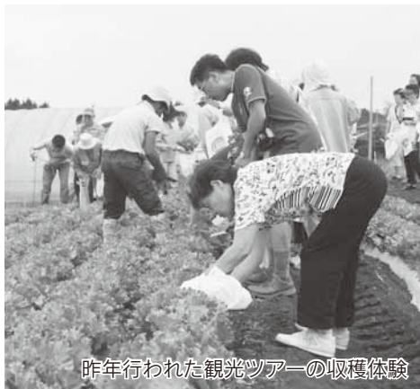
昨年行われた観光ツアーの収穫体験

野菜王国昭和村の安心安全な野菜や果物の素晴らしさを、収穫体験を通してより多くの方々にPRするため、皆さん