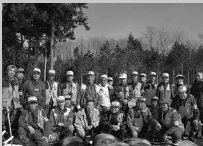
頭数調整を実施した村猟友会の皆さん