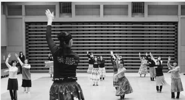
先生のお手本を見ながらステップとハンドモーションの練習