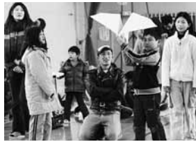
巨大紙ヒコーキを飛ばす練習