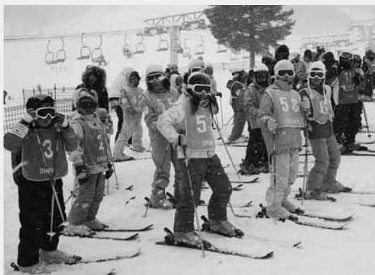
スキー教室に参加した子どもたち

それぞれ目標タイムを設定し、どれだけそのタイム通りにコースを滑れるかを競いました。