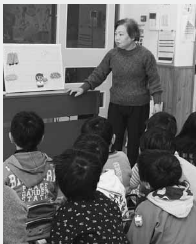
千明さんの趣向を凝らした読み聞かせ(子育て保育園)