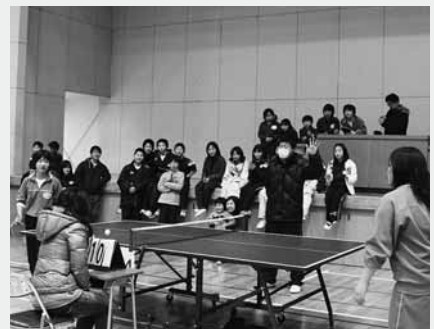
大接戦となった三組Aと森下上組の優勝決定戦