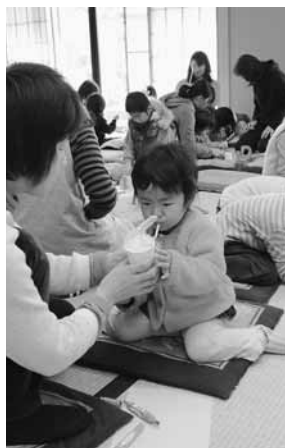
楽しい工作にチャレンジ

きないも」を上演。「大きないも」では、太田市尾島町を拠点に活動している同劇団が、「大きなかぶ」ならぬ同町の特産品「大きなやまといも」を、ウサギやサルなどの動物のお面をつけた子どもたちと一緒に引き抜きました。