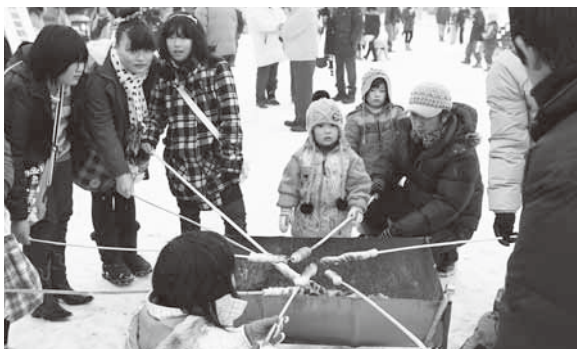
自分で焼いたパンの味は格別。上手に焼けるかな？