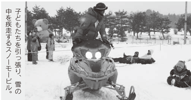
子どもたちを引っ張り、雪の中を疾走するスノーモービル。