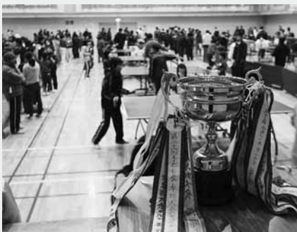
優勝杯と一面に並べられた卓球台