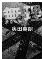
無理 奥田 英朗 (著) 文藝春秋