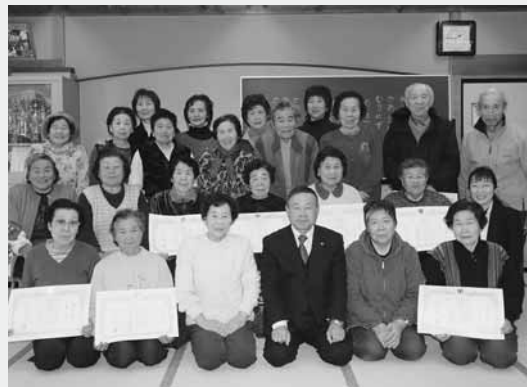
らくらく筋トレ体操に取り組んでいる貝野瀬地区のみなさん

同地区では現在、毎週水曜日午後1時30分から、24人が元気に筋トレ体操を行っています。