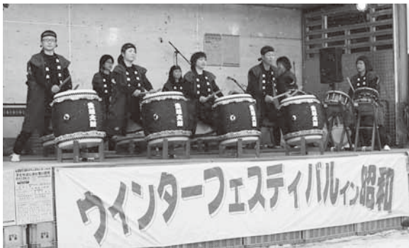
勇壮な太鼓の響きが開会を告げる(生越太鼓)。