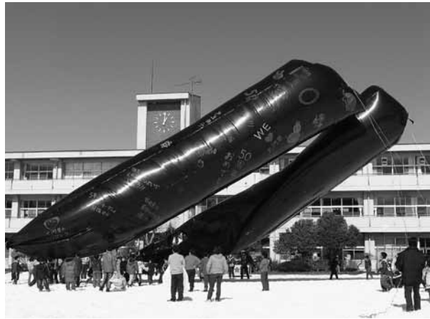
太陽の光を浴びてみるみる膨れ上がるソーラーバルーン