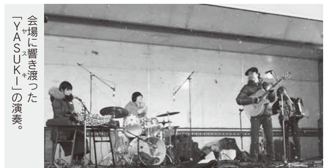
会場に響き渡った「YASUKI」の演奏。