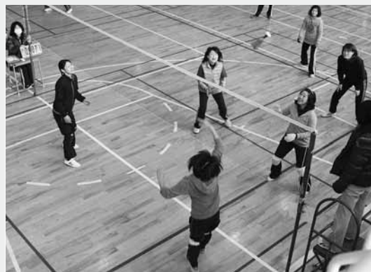
インディアカを楽しむ若妻会員のみなさん