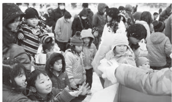
会場で配られたチョコレートに笑顔の子どもたち。