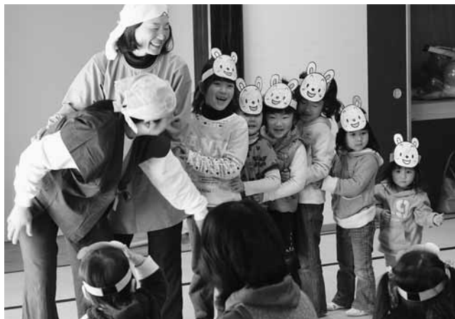
子どもたちも参加した劇「大きないも」

きないも」を上演。「大きないも」では、太田市尾島町を拠点に活動している同劇団が、「大きなかぶ」ならぬ同町の特産品「大きなやまといも」を、ウサギやサルなどの動物のお面をつけた子どもたちと一緒に引き抜きました。