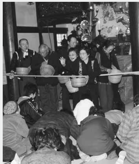
地域の檀家を集めて行われた涅槃会の団子投げ