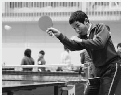
真剣なまなざしで白球を追う