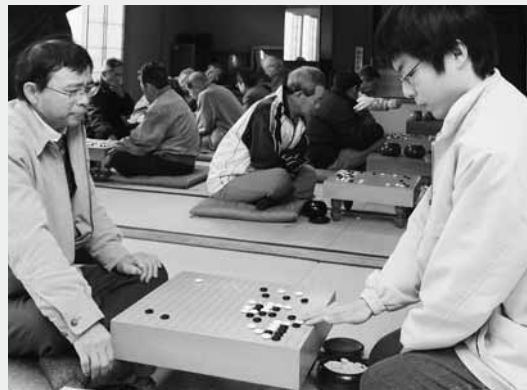
囲碁通が集まり腕前を競った第2回昭和村囲碁大会

会場となった公民館の和室には、ずらりと碁盤が並べられ、向かい合った参加者が、ときに静かに、ときに談笑しながら対局を楽しんでいました。