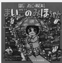
ますだくんと まいごのみほちゃん 武田 美穂 (著) ポプラ社