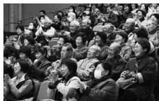
会場は笑い声と拍手が鳴り響いた