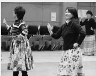
みんな笑顔でフラダンス

村公民館が主催する「はじめてのフラダンス教室」が昨年12月14日から今年2月8日にかけて、公民館多目的ホールで行われました。