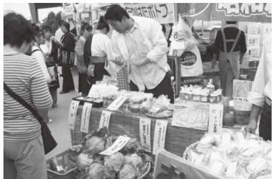
新横浜パフォーマンスで昭和村の農産物をPR（10月17日 日産スタジアムにて）

「横浜市少年自然の家赤城林間学園」を軸として、青少年を中心とした交流が活発に行われ、昭和の秋まつりでのミニ中華街など、横浜市との深いつながりを随所に垣間見ることが出来ました。6月に横浜開港150周年記念イベント（開国博Y+150）の会場で、レタス部会の方々と朝採りレタスの即売を行ったことは、今回の人事交流の中で一番の思い出となっています。