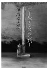
ゴールデンランパー 伊坂 幸太郎 (著) 新潮社

俺はどうなってしまった？ 一体何が起きている？ 首相暗殺の濡れ衣を着せられた男は、国家的陰謀から逃げ切れるのか。精密に絡み合う伏線、構築度の高い物語世界。映画化で話題の作品。