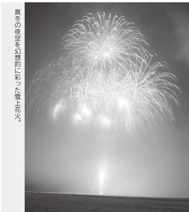
真冬の夜空を幻想的に彩った雪上火火。