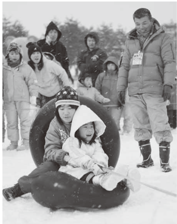
スリル満点のスノーチュービングには長い行列が。寒さもどこ吹く風で子どもたちは大喜び。