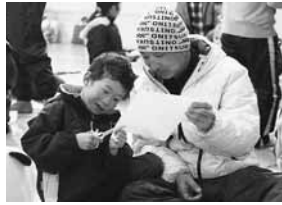
親子で楽しく工作

この「ふれあいの日」は、全校児童とその保護者が、共同作業をとおして親子でふれあうことを目的に毎年行われてい