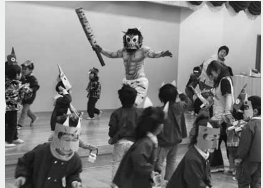
突然現れた赤鬼にホールは騒然(第一保育園)

ホールには「おにはあーそとっ! ふくはあーうちっ!」と、園児たちの大きな声が響き渡り、豆の集中砲火を浴びた赤鬼はたまたら退散していきました。