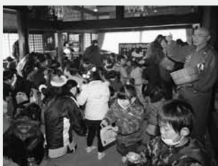
子育て保育園の園児たちにも行われた団子投げ