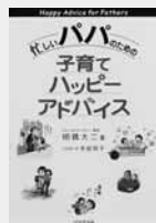
忙しいパパのための 子育てハッピーアドバイス 明橋 大二 (著) 1万年堂出版