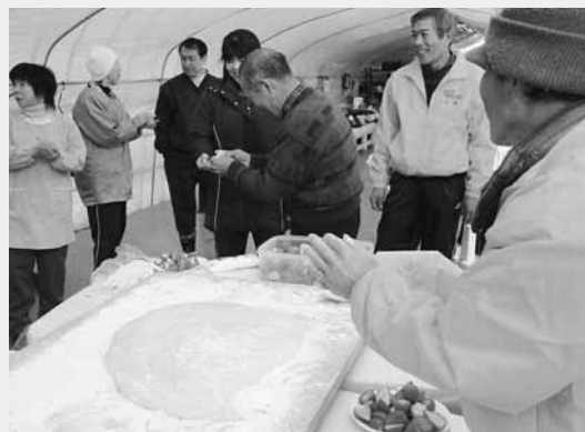
つくたての餅に包まれた真っ赤なイチゴが振る舞われた

来場者は、つくたての餅に包まれた真っ赤なイチゴの甘みとほのかな酸味が舌鼓を打ち、新春の味覚を楽しんでいました。