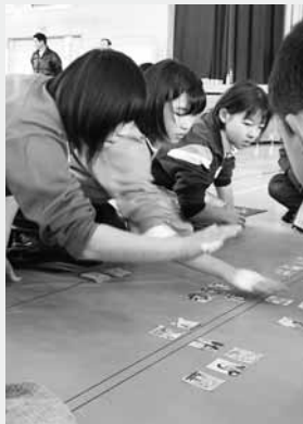
チームプレーの団体戦