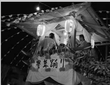
祭りを盛り上げた新しいやぐら