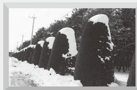
雪のわたぼうしがお出迎え (2月8日 総合運動公園北側入口)