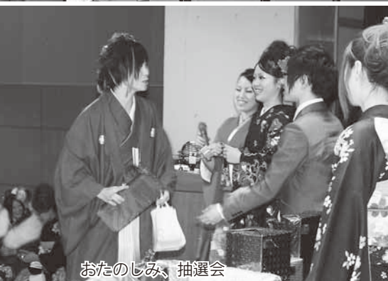
おたのしみ、抽選会