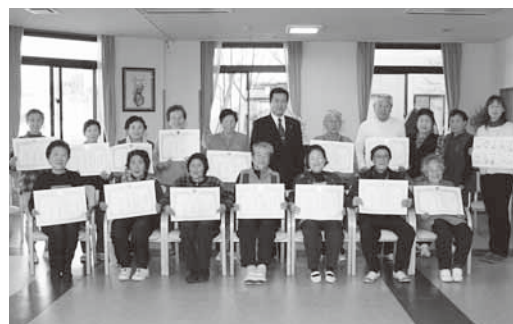
菜の花館で筋トレ上級の認定を受けたみなさん