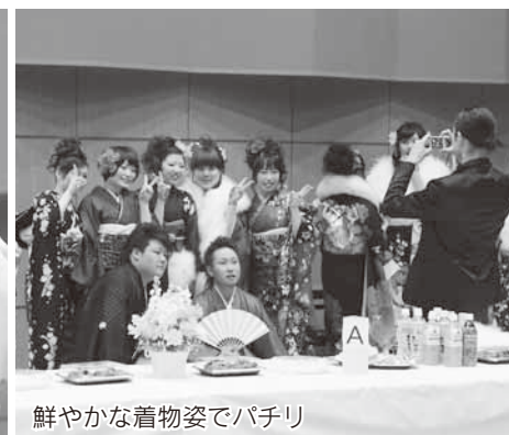
鮮やかな着物姿でパチリ