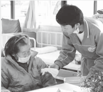
笑顔であいさつ(デイサービスセンター)

仕事やボランティア作業を通じてさまざまなことを感じ、学んだチャレンジウィーク。期間中、仕事に取り組む生徒たちの姿を追いました。 さあ、仕事しよう!!