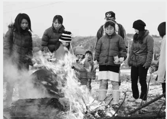
勢いよく燃え上がる炎を見つめる子どもたち

集まった人たちには甘酒やミカンなどが振る舞われ、やぐらから立ち上る赤い炎と白い煙を見つめながら、一年の無病息災を祈りました。