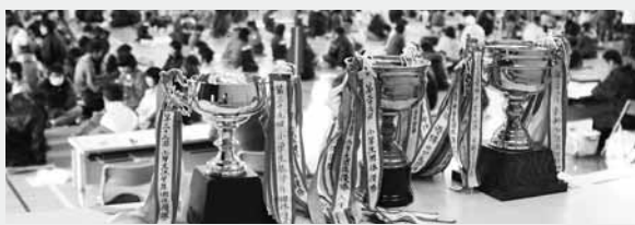
優勝杯を競い各部で熱い戦いが繰り広げられた