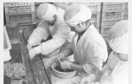
食品の製造を体験(北毛久呂保)