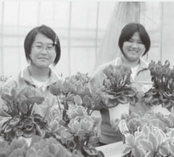
きれいな花に囲まれて(小野フラワー)