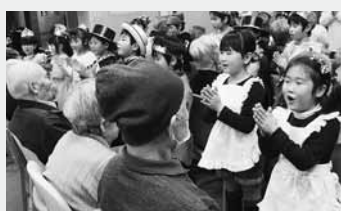
手遊び歌で楽しく交流

子育保育園では1月20日、村デイサービスセンターでお年寄りに劇や歌を披露し、手遊び歌で交流しました。