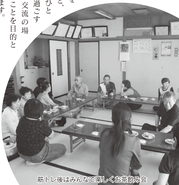
筋トレ後はみんなで楽しくお茶飲み会

サロンの特徴は、地域住民が主体となつて行う交流の場として、さまざまな機関が連携し、誰でも参加が可能です。