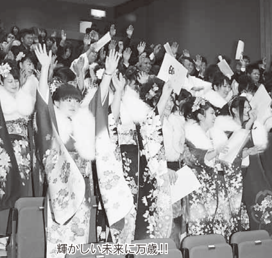
輝かしい未来に万歳!!!