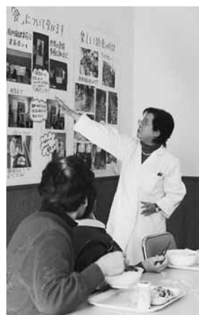
取り組みの説明を聞く参加者

域の人たちに学校給食に対する理解を深めてもらい安全でおいしい給食を体験してもらおうと、同センターが企画・実施したものです。