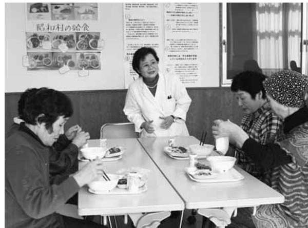
中学生が食べる給食を試食する参加者