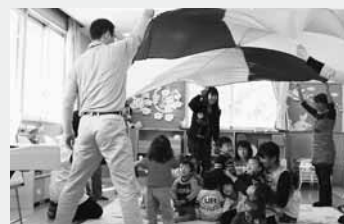
カラーバルーンに大はしゃぎ