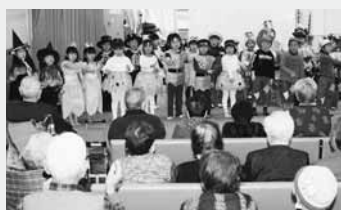
オズの魔法使いを披露