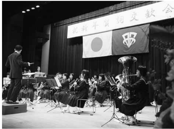
大きな拍手を浴びた昭和中プラスバンド部の演奏