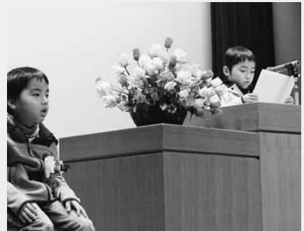
自慢の家族を隣りに作文を発表