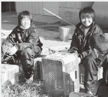
作業を通じて交流(たけのこ学園)