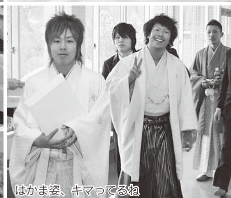
はかま姿、キマってるね