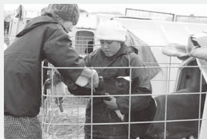
子牛の授乳を体験(吉野牧場)