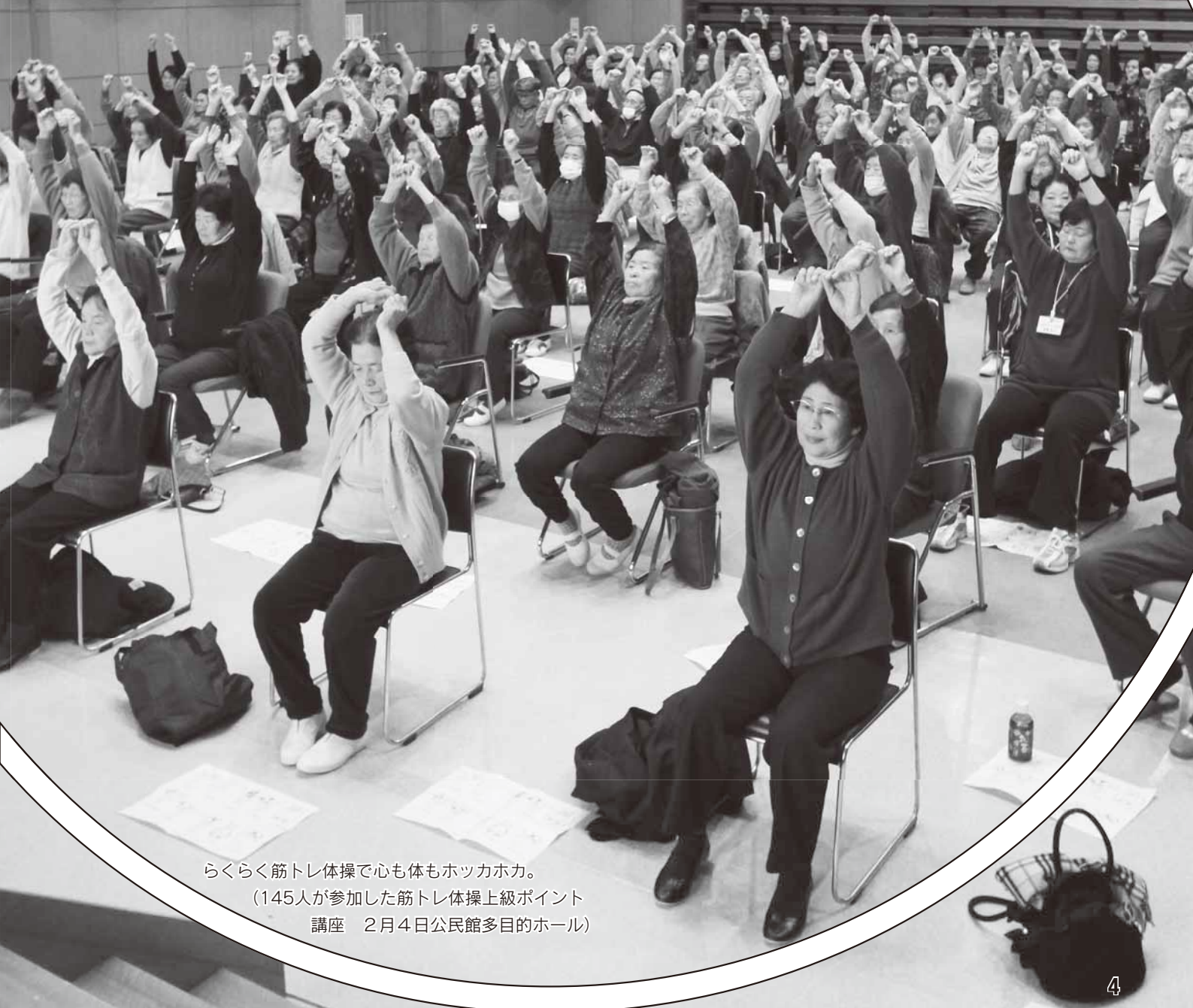
らくらく筋トレ体操で心も体もホッカイホカ。 (145人が参加した筋トレ体操上級ポイント 講座 2月4日公民館多目的ホール)