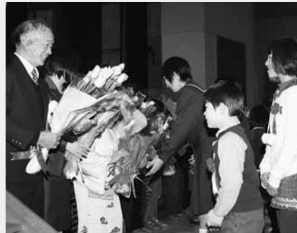
家族に感謝をこめて花束を贈呈