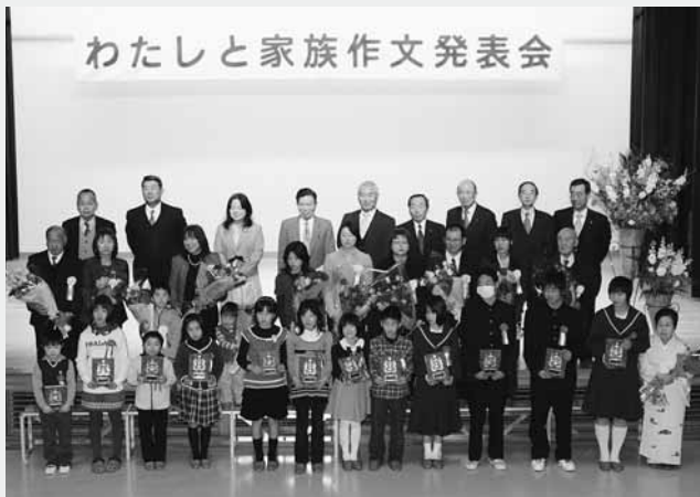
優秀作文に選ばれた12人の児童・生徒と家族の皆さん

村公民館(木村武夫館長)主催の第28回「わたしと家族作文発表会」が1月23日、公民館多目的ホールで開催されました。