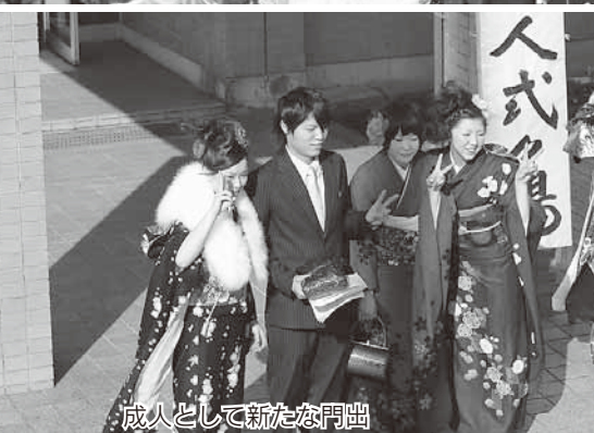
成人として新たな門出