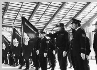
安心安全を担う決意の敬礼