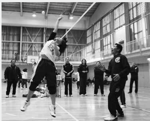
ネット際の華麗なトス

大会結果 ▶女子の部 優勝：フレンズ、準優勝：くれそん、第三位：インディーズわかば ▶混成の部 優勝：常木E、準優勝：常木B、第三位：イケメンけんちゃん