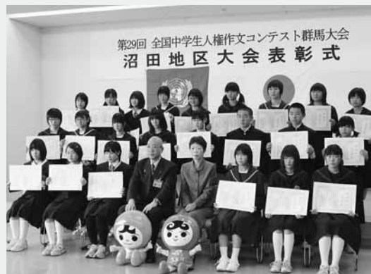
表彰された中学生の皆さん