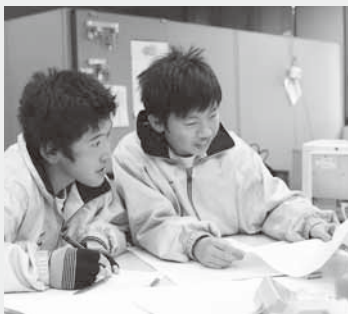
ただいま予約表を制作中(昭和の森ゴルフ場)