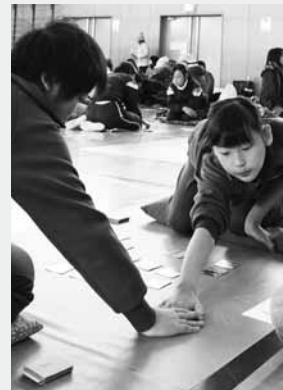
取るか取られるか緊張の個人戦