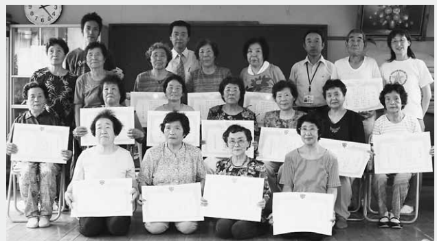
入原地区「この指とまれ」のみなさん