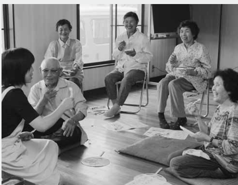
効果的な歯みがきの方法を練習

同校では、緑の少年団活動の一環としてしいたけの駒打ちを行い今年で3年目。毎年4年生が体験しています。今回打ち込んだしいたけの収穫は来年の秋ごろとのこと。