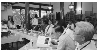
意見交換会では大使が活発に意見