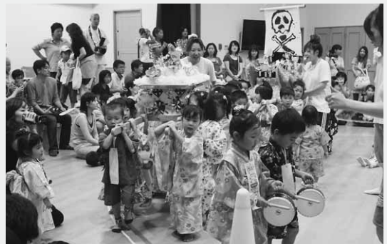
ホール内を元気に練り歩く園児たち（子育保育園）

子育保育園では、園児たちがおみこしを担いで練り歩き、「わっしょい、わっしょい」という元気なかけ声に、ホールに集まった保護者らは一緒になってかけ声をあげていました。