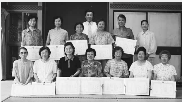
「三ツ谷サロン」のみなさん

実演。「認知症の人やその家族が住みよい地域づくりのために、何ができるのか」との問いに参加者らは「今までどおりの付き合い」「温かく見守る」といった意見を出し合っていました。