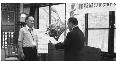
昭和の森山荘で行われた委嘱状交付式

昭和村ふるさと大使の交流会が7月17、18日の両日、昭和の森山荘などで行われ、委嘱状交付式や情報・意見交換会