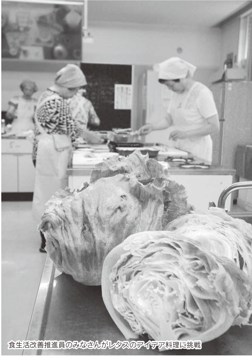
食生活改善推進員のみなさんがレタスのアイデア料理に挑戦