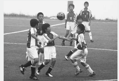
ボールを競り合う子どもたち（FC昭和）

大会結果 ▶優勝：新座片山FC少年団（埼玉県）、▶準優勝：ファナティコス（群馬県）、▶第三位：福原サッカークラブ（埼玉県）