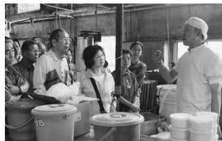
北毛久呂保ではできたてこんにやくを試食