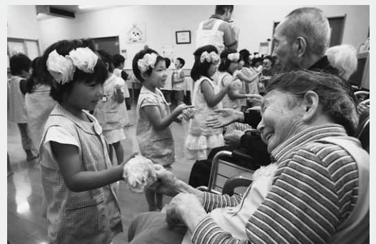
一緒に手遊びをして笑顔のお年寄りと園児

同保育園では年に2回、七夕とクリスマスの時期に「美ら寿」を訪れ、お年寄りと交流しています。