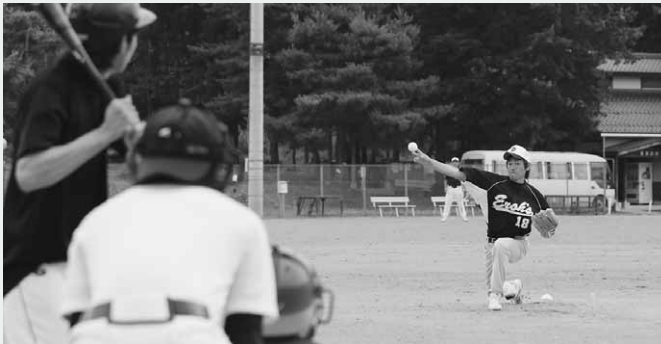
熱戦が繰り広げられた社会人地区対抗野球大会

第32回社会人地区対抗野球大会が7月19日、総合運動公園野球場などで開催されました。