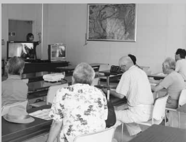
役場会議室で行われた説明会

2011年7月24日の地上デジタル放送移行まであと2年です。皆さん対策はお済みですか。もう一度ご確認ください。