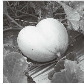
ハートの形に実ったメロン