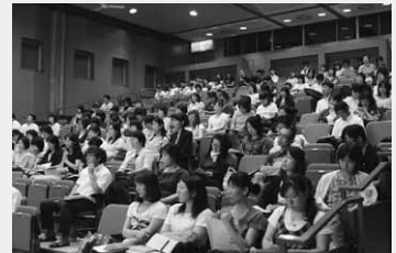
講演に耳を傾ける参加者