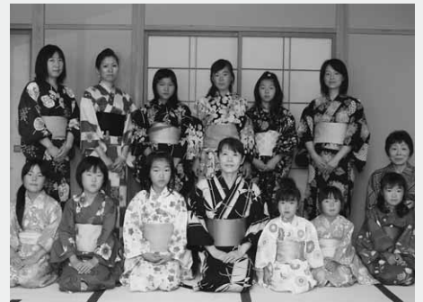
浴衣ではなやかに変身