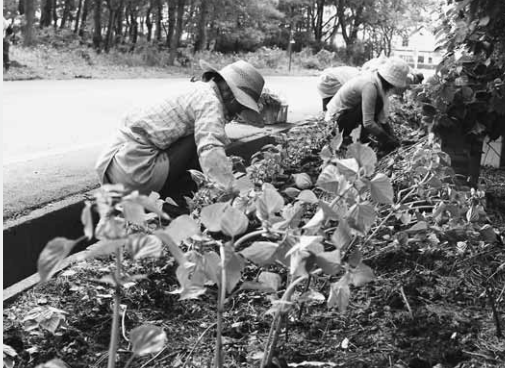
沿道にサルビアの苗を植える婦人会役員ら