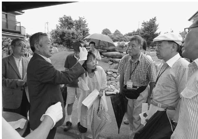
1400年前の五鈴鏡の音色に耳を澄ますふるさと大使