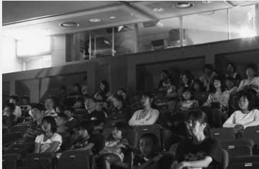
上映中のスクリーンに見入る参加者

真夏の夜に親子で思い出を作ってもらおうと、村公民館が主催する夏の親子映画まつりが7月22日、公民館多目的ホールで開催されました。