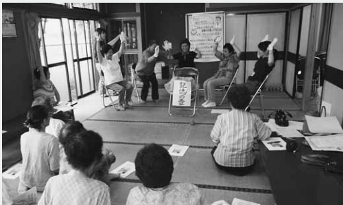
記憶の仕組みを実演（三ツ谷サロン）

三ツ谷地区の「三ツ谷サロン」、入原地区の「この指とまれ」では、らくらく筋トレ体操上級の認定式が行われました。