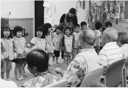
お年寄りの前でお遊戯を披露する園児