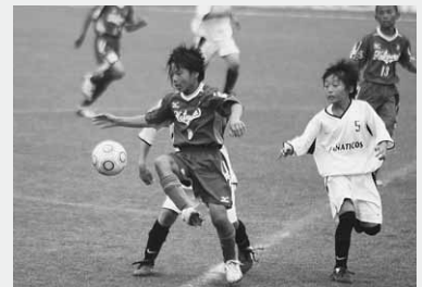
新座片山FCとファナティコスによる決勝戦