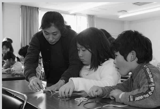
「重ね四つ畳」に奮闘中