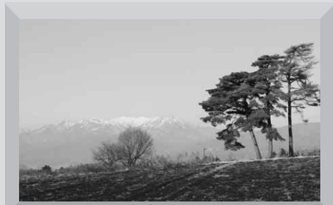
冠雪の武尊山と松がきれいでした (貝野瀬望郷ライン沿い)