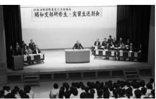
公民館多目的ホールで行われた送別会