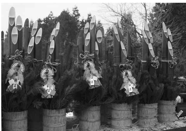
完成した11組の門松