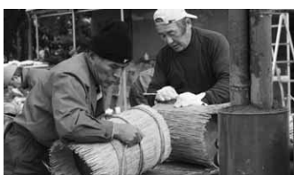
◆ 手際よく作業を行う会員ら

今回製作された門松は、糸井・貝野瀬・生越地域の神社やお寺に飾られるほか、村商工会や社会福祉協議会等にも飾られます。