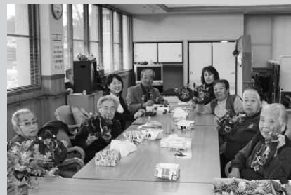
クリスマスリースを手につこり

村ふれあい館では12月14日と25日、施設を利用するお年寄りあわせて15人がクリスマスリース作りを楽しみました。参加された方は「みんなと話しをしたり、リースを作ったり、とても楽しいですよ」と話されていました。