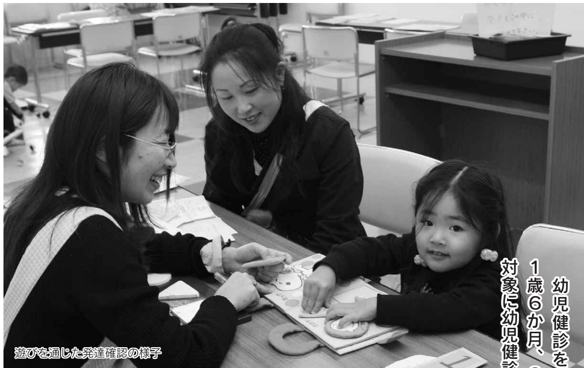
遊びを通じた発達確認の様子

幼児健診をご存じですか。村では、 1歳6か月、3歳2か月ごろの幼児を対象に幼児健診を行っています。