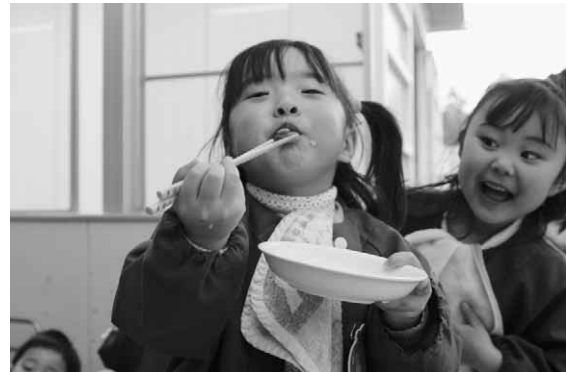
給食をおいしそうに食べる園児（第二保育園）