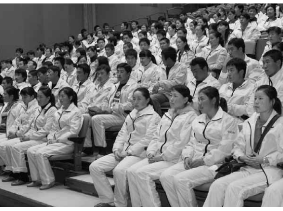
送別会に出席した中国人研修生ら