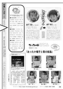
先月(12月)号の裏表紙

幼児健診の実施日は、「広報しようわ」の裏表紙「ママ忘れないでね」の欄で、偶数月にお知らせしています。ご確認ください。