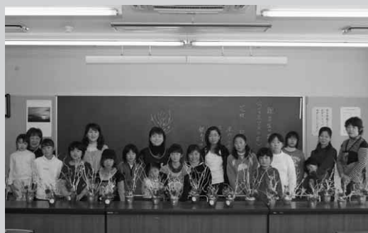
きれいなクリスマスの花が完成