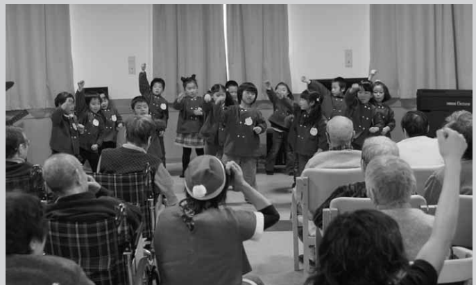
第一保育園の園児がお遊戯を披露