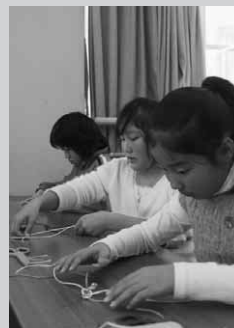
ひたすら結ぶべし!!

アクセサリ作りにはおよそ20人の親子らが参加。「重ね四つ畳 かさよよたたみ 」に苦戦しながらも、赤や緑、金や銀色の鮮やかな錦糸を使い、華やかなクリスマスアクセサリを作成しました。