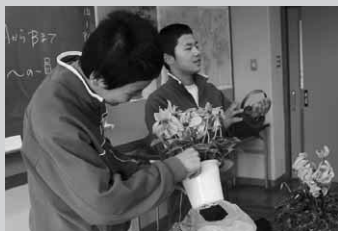
体験した仕事を実演

昭和中学校では12月19日、2年生64名がチャレンジウィークでの体験や、感じたことについての発表会を行いました。