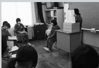
紙芝居で体験内容を発表