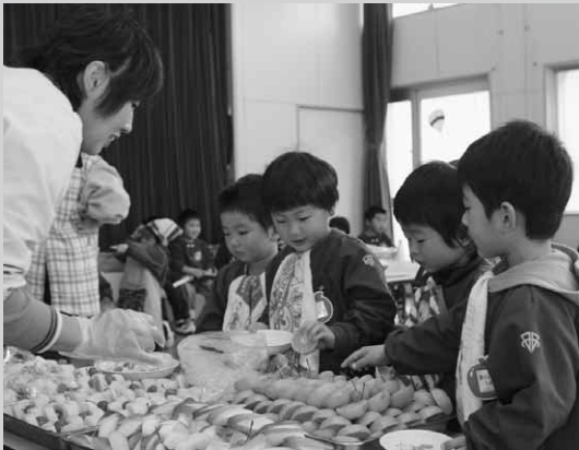
なにを食べようかまよっちゃう!!