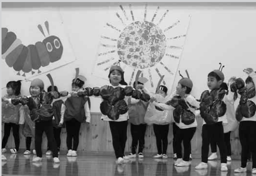
ゆり組(3歳児)は「はらぺこあおむし」を披露

ゆり組（3歳児）では「はらぺこあおむし」を発表、あおむしが色々なものを食べて過ぎてお腹をこわしますが、最後には蝶になる様子を踊りで表現。発表の後には会場から拍手が上がっていました。