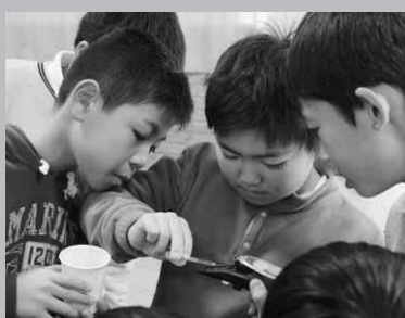
糖度測定の実験を行う児童

児童は、良い生活習慣と悪い生活習慣や、どんな病気になる危険があるのか等それぞれの意見を出し合いました。また、糖度測定の実験では、初めて見る測定器に興味津々。夢中で実験を行っていました。