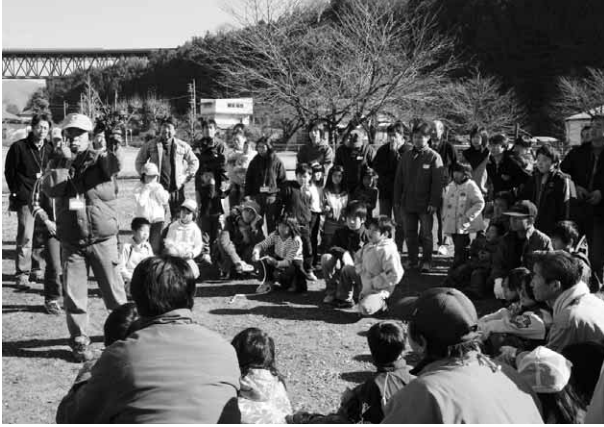
たき火起して達人の話に聞き入る参加者ら