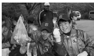
スポーツ少年団は周辺のゴミ拾い