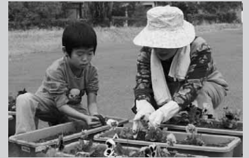
教わりながらパンジーを植え替えました

子どもたちは450本のパンジーを50分かけておよそ150鉢のプランターに植え替えました。