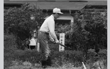
清流の会は校庭の草刈りや枝うちなども行いました