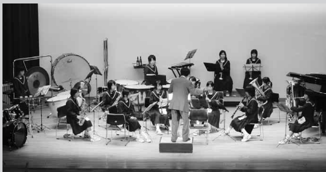
見事な音色を奏でるブラスバンド部のみなさん