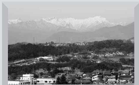
谷川連峰が雪化粧 (森下より)