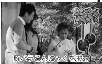
豚バラこんにやくを披露

だいて光栄です。協力があから、いろいろな料理に挑戦する事ができます。ハードなので、これから戦いたいですね。