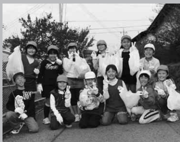
作業のあい間にパチリ（写真は3年生）

東小児童が ゴミ拾いを実施 東小学校では11月5日、「自分たちの地域をきれいに、大切にしよう」と全校児童が学校の周囲のゴミ拾いを行いました。 これは、糸井地区・橡久保地区が、県の「農地・水・環境保全向上対策事業」の指定を受け、地域全体で環境保全に取り組むなかで、東小学校も地域の団体として参加、実施したものです。 児童は、低学年が中内出・常木地区を、中学年が宿・中宿地区を、高学年が滝寺・上内出地区を中心に、ゴミ拾いを行いました。