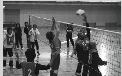
社会体育館で行われたソフトバレーの部

第40回村内バレーボール大会が11月3日、村総合運動公園多目的グラウンドを主会場に開催され、109チームおよそ1,300人が熱戦を繰り広げました。