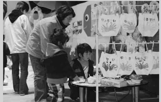
おともたちの作品はどれかな？

村公民館と文化協会が主催する第48回昭和村文化祭が11月22日・23日、村公民館で開催されました。