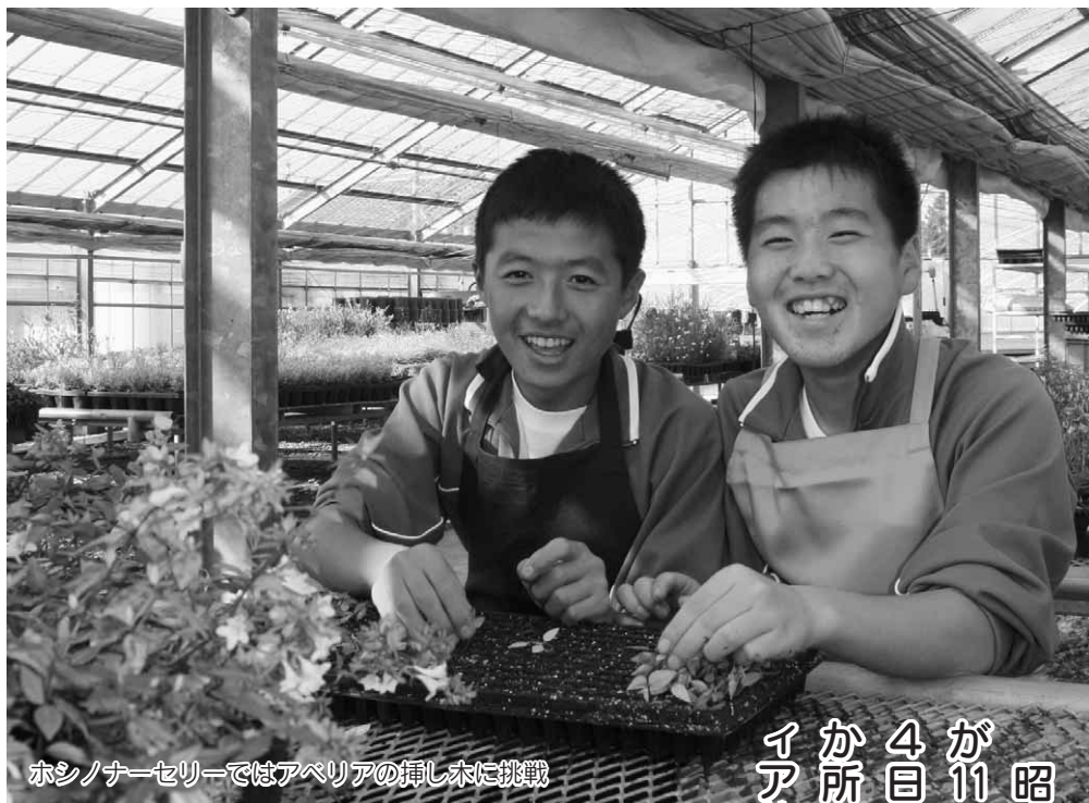
ホシノナーセリーではアベリアの挿し木に挑戦

昭和中学校の2年生62名が11月6日から9日までの4日間、村の事業所など27か所で職業体験・ボランティア体験を行いました。