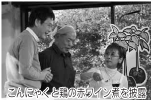
こんにやくと鶏の赤ワイン煮を披露 撮影はいる所な所にかメラがあり、どこを見て良いのかわからない。緊張しましたね。少しでも昭和村のPRに役立てればと思います。

緊張が、しかも良い経験ができた。さまざまな料理方法があり、特に先生のこんにやく料理にはびっくりしました。