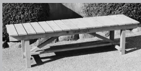
寄贈された木製ベンチ

この木製ベンチは、毎年社内ボランティアの活動の一環として村に寄附していただいていたもので、屋内運動場をはじめ、村の各施設で活用されています。