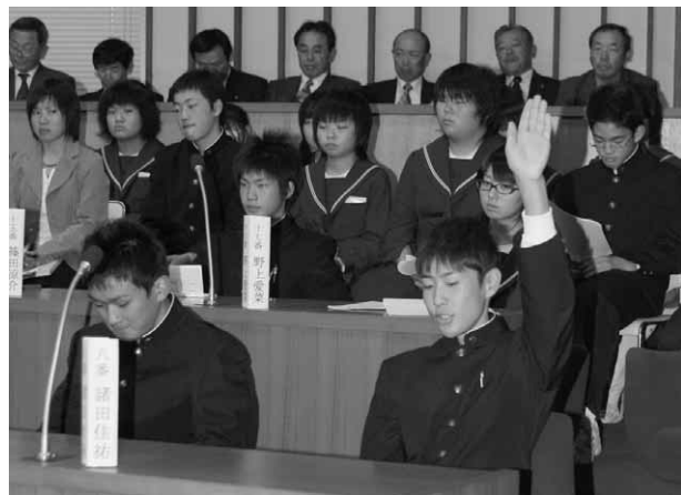
「ハイッ。議長」一般質問では7人が再質問