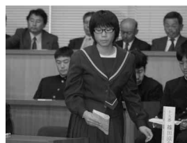
一般質問のためいざ壇上へ

中学生模擬議会が11月6日、役場議場で開催されました。 これは、村の議会を体験することで、中学生に地方自治や村政について知ってもらおうと、村の議会の発案で実施され、今年で3回目を迎えます。