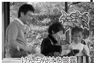
けんちん汁を披露