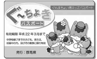
ぐーちよきパスポート

本事業に協賛いただく店舗等(ぐーちよきショップ)に「ぐんまちょい得キッズパスポート(略称:ぐーちよきパスポート)」を提示することで「ちょっとお得」な特典の提供が受けられる制度です。