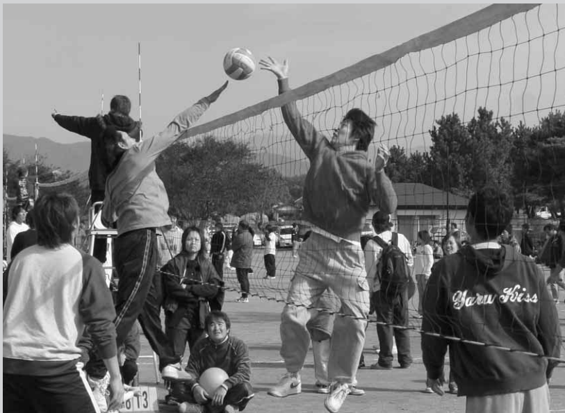
ネット越しの攻防 勝つのはどっち!?