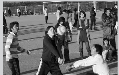
チームワークはバッチリ!!