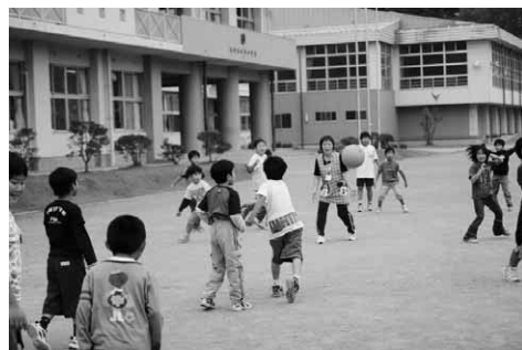
◆ 子供たちと楽しく遊びませんか