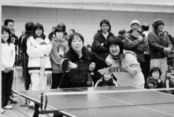
応援団もいっぱい