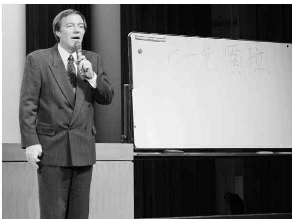
おなじみの山形弁で軽快なトーク

また日本語について、「日本語には、主語のない文章が多くて、コミュニケーションの要素が足りていない。外国人には意味が伝わりづらいし、子供にも伝わらないのではないのでしょうか。あせらず、急がず、言いたいことをゆつくり、しっかり伝える必要があります」と外国人としての難しさを語っていました。