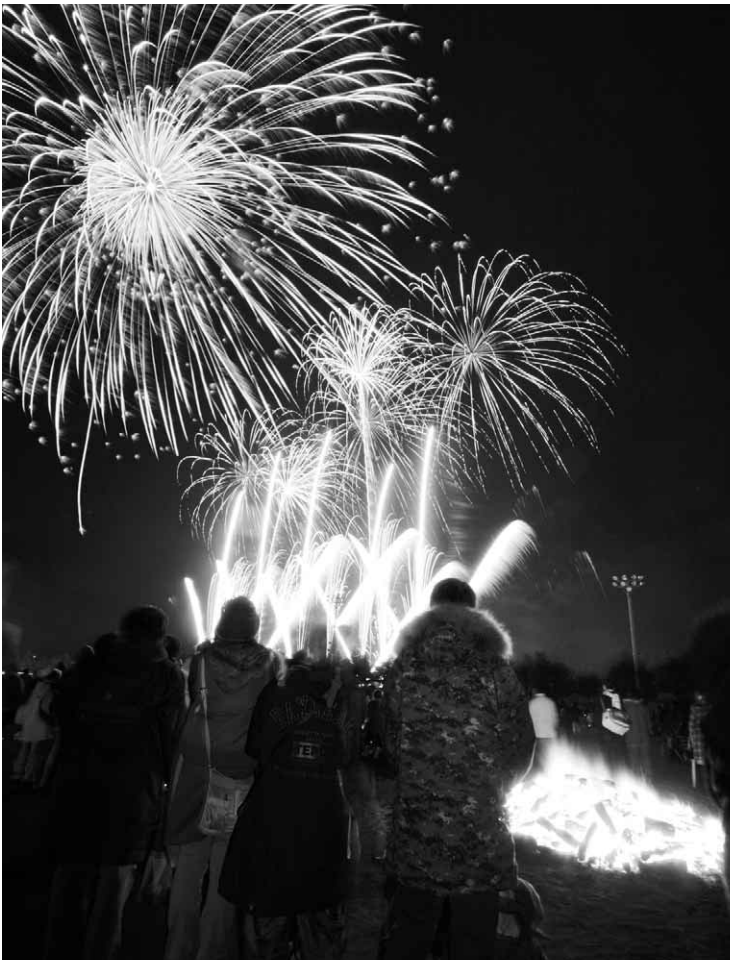
夜空を色どった打ち上げ花火

メインとなる打ち上げ花火は、午後7時からスタート。およそ40分間に渡り、色とりどりの花火が澄み切った夜空を鮮やかに彩りました。