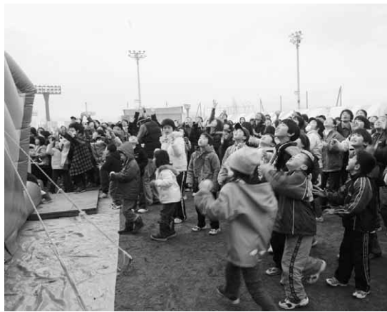
大人気だった宝さがしゲーム