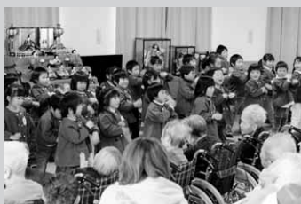
かわいいおゆうぎを披露