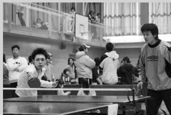
機敏な動きでレシーブ