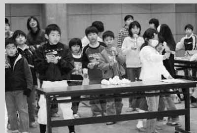
狙いを定めて、パーン

参加した子供たちは、細かい工作に苦労しながらも、『アルコールでっぼう』を完成。自分たちで作ったでっぼうで的当てを楽しみました。