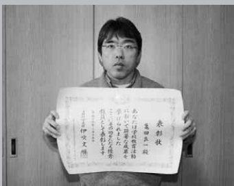
おめでとうございます

このたびの受賞に対しては、「自分では優秀だとは思っていません。校長先生や他の先生の協力があって、自分のやりたい事が何でもできる体制があったおかげで頂けた賞です」と話してくれました。