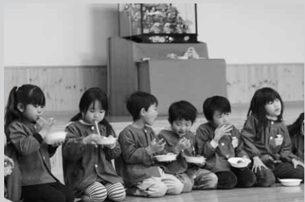
つきたてのおもち、おいしーね

子育保育園では2月28日、ひなまつり恒例の「餅つき」が行われました。園児たちは、大きな杵を手にもちつきに挑戦。つきあがったお餅は、さっそく園児たちに振る舞われました。