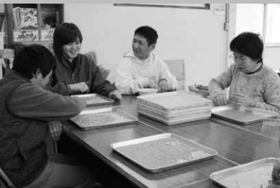
職員や入所者と一緒に作業

また、作業が終わった後には、普段園生たちが行っている焼き物にも挑戦。湯飲みや茶碗などを作り上げました。