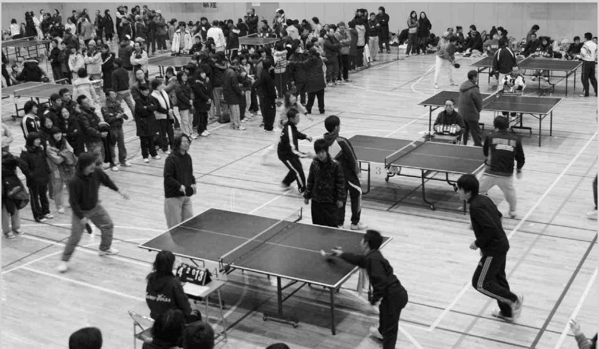
会場内のいたる所で熱戦が展開