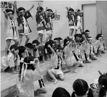
元気いっぱいのお遊戯