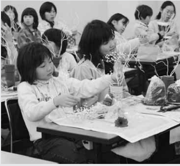
きれいに飾りつけ