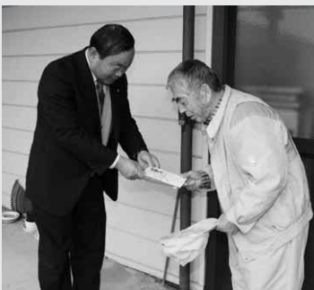
これからも頑張ってください

加藤村長、真下助役、村民生児童委員らは2班に分かれ、日ごろ介護を行っている村内の15家族に、「これからも頑張ってください」と声を掛けながら介護慰労金を手渡していました。