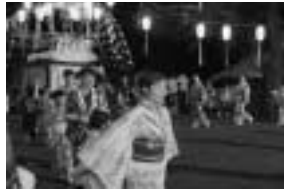
◆ 踊りを楽しむ参加者たち

毎秋恒例の諏訪祭りが川額八幡宮、森下大森神社でそれぞれ開催されました。川額地区では9月28・29日に開催。まんどうの武者人形は、川額上が黒田官兵