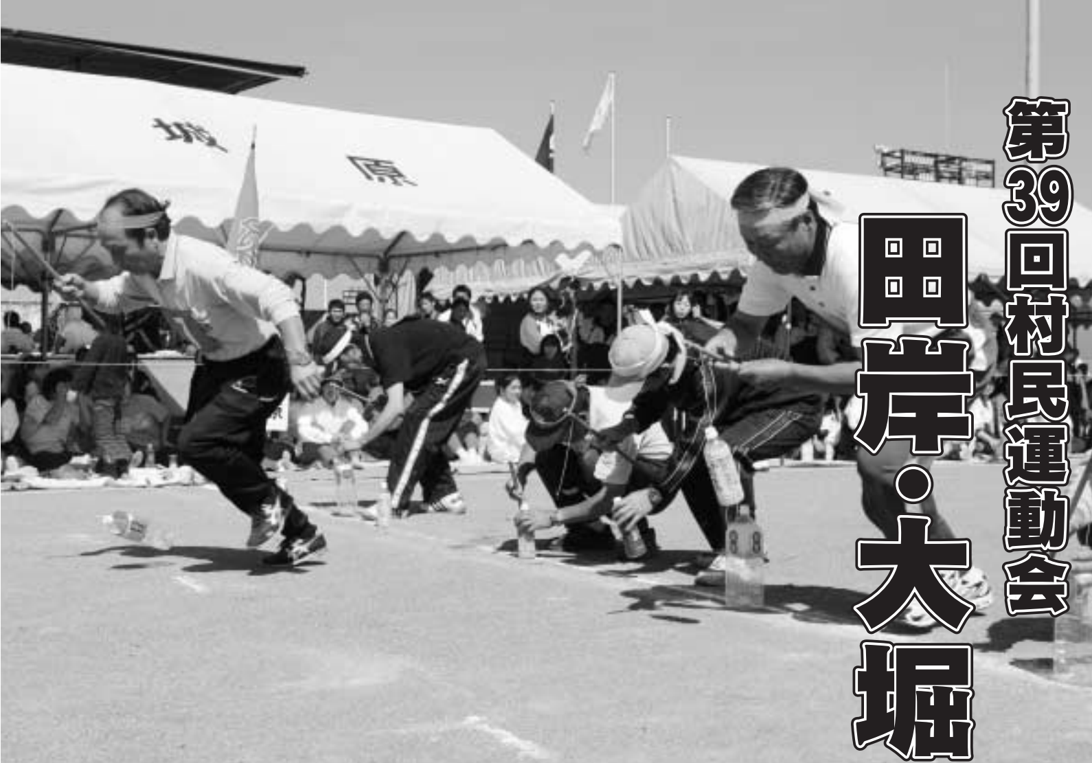
▲意外とむずかしいんですよ（ペットでGO！）