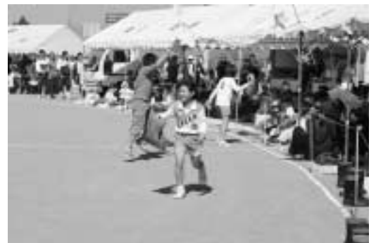
▲誰か持っていませんかー（借り物競走）