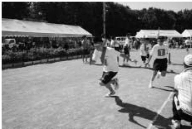
▲見事なバトンリレーを披露（小中学生リレー）