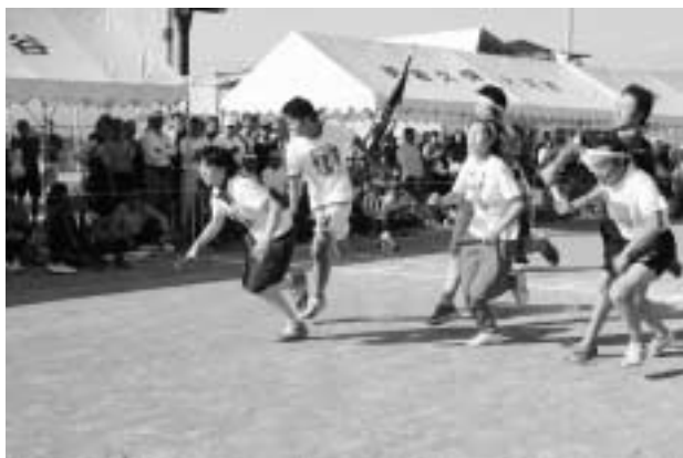
▲力いっぱい走りました（年代別リレー）

第39回村民運動会が9月24日、村総合運動公園で開催されました。地区対抗戦やオープン参加競技など22種目が行われ、参加者たちは、どの競技にも白熱。地区対抗戦では、田岸・大堀が一昨年に続き優勝を勝ち取りました。