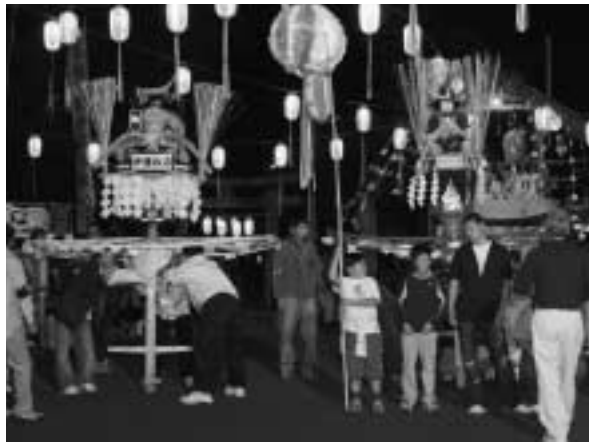
きれいに飾りつけられたまんどう