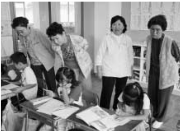
何を勉強しているのかな

する側から教える側に。普段から練習している輪投げやグラウンドゴルフを児童たちに教えながらスポーツで交流。楽しい時間を過ごしました。