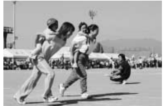
▲落ちないでねー（親子競走）