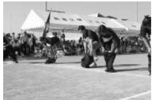
▲なかなかズボンがはけません（支度競走）