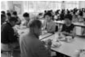
楽しい給食の時間

する側から教える側に。普段から練習している輪投げやグラウンドゴルフを児童たちに教えながらスポーツで交流。楽しい時間を過ごしました。