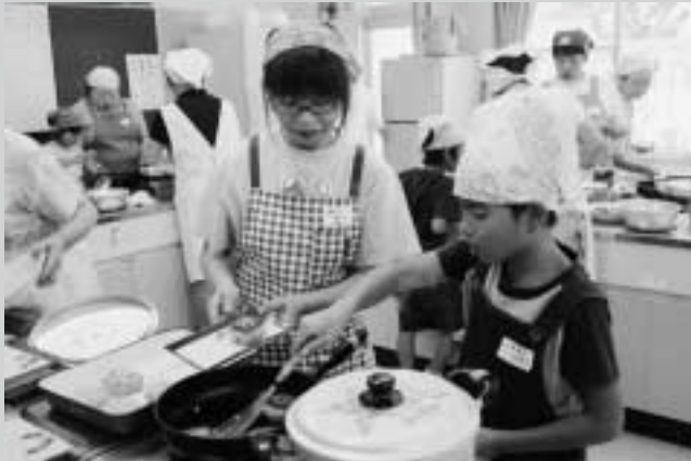
おいしくできたかな