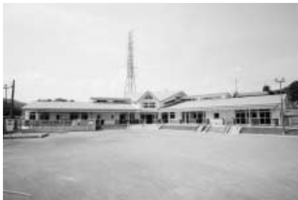
立派な園舎が完成

なお、総事業費は2億4、215万円で、国から6、312万8千円、村から1億650万円の補助金を受けています。