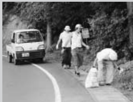
道路わきのゴミ拾い