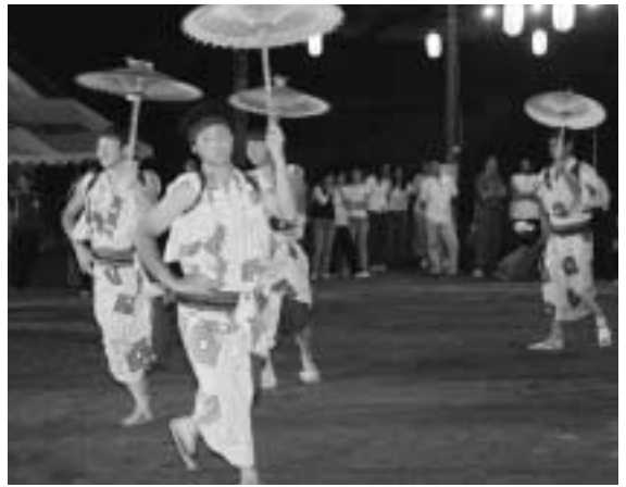
息のあった八木節を披露