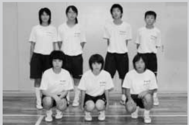
陸上県大会出場者