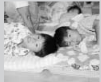
仲よくおやすみなさい