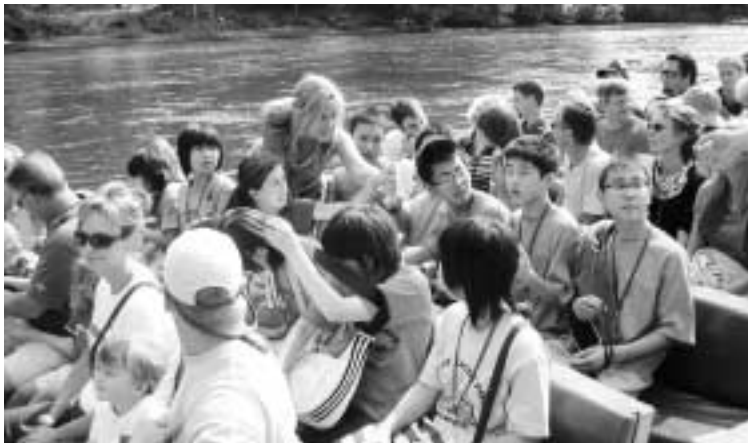
ジェットボートツアー

8月2日～11日までの10日の間に、ホームステイを通して、交流を深めながら、語学や異文化などさまざまなことを学んできました。