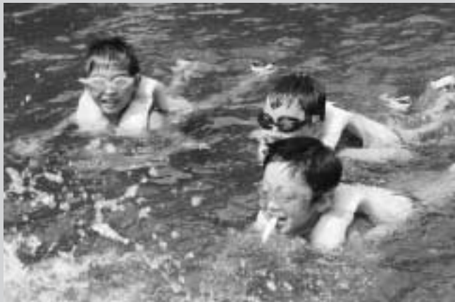
流れにのって水遊び