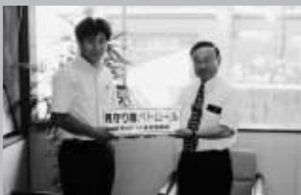
子供たちの安全を守ってください

同協議会では、全国的に子供を狙った凶悪犯罪が相次いでいることから、各校の地域内パトロールを決定。巡回車に付けるマグネツト式ステッカーの製作を村に要望しており、このたび村から各小・中学校に25枚ずつの「見守り隊」ステッカーが配られました。