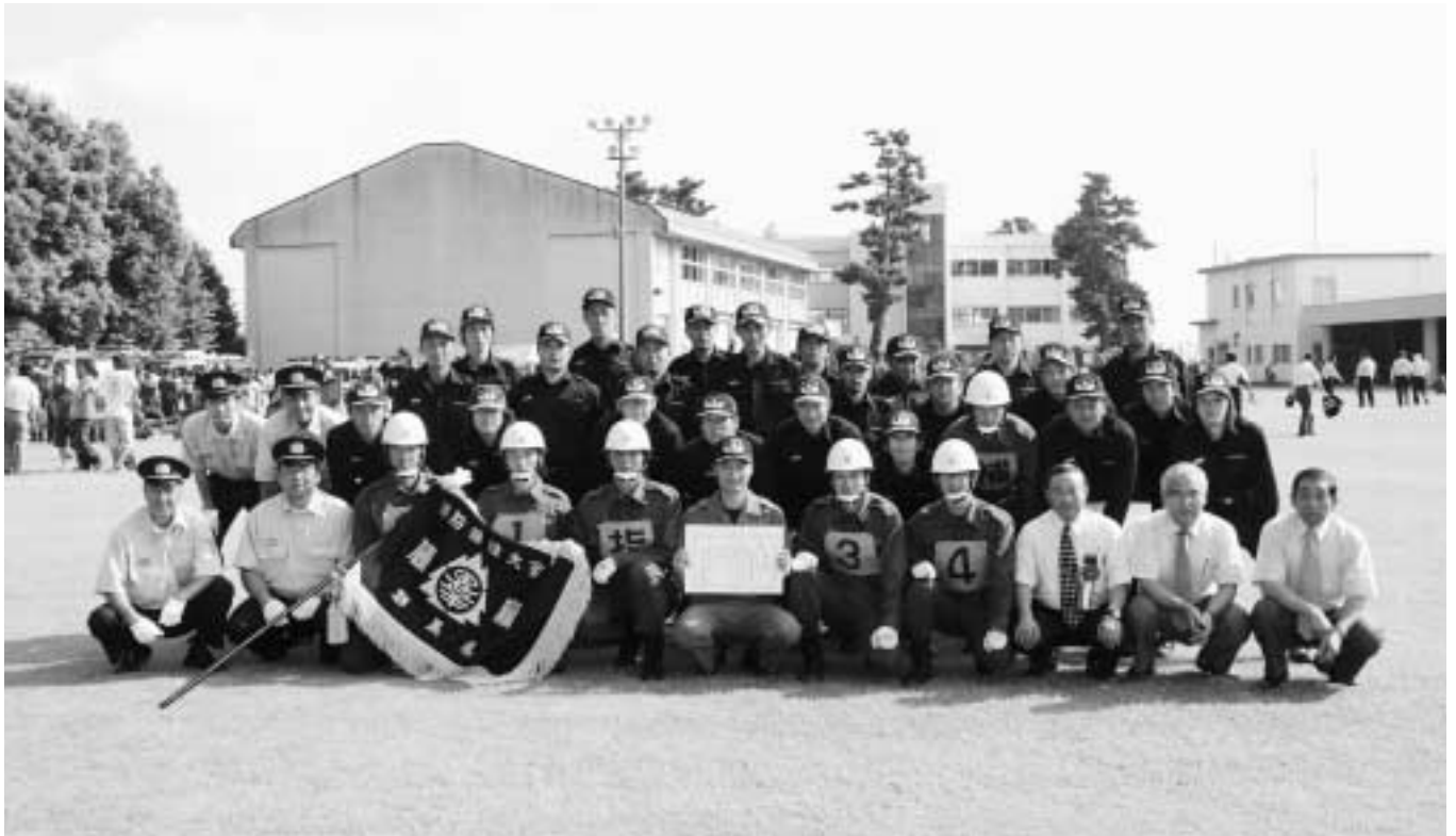
▲第7分団 (ポンプ車の部)