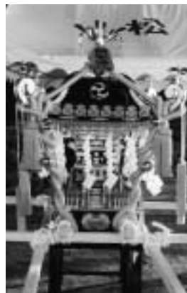
新調されたおみこし

の青年団員らおよそ200人が詰めかけました。午後7時過ぎにお祭りが始まると、祭り支度を整えた団員や参加者たちが盆踊りや八木節などを楽しみました。同青年団が開催する納涼祭も今年で4回目。地域の恒例行事としてすっかり定着してきました。