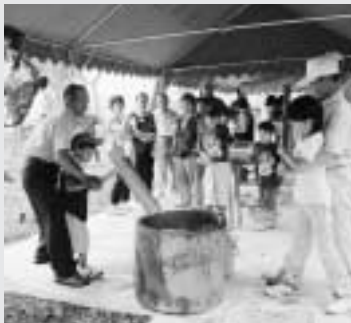
上手につけたかな