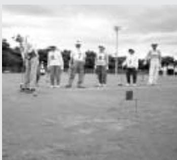
第一ゲート通過一