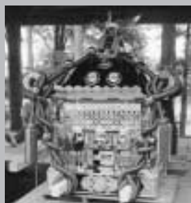
きれいになったおみこし

同事業は宝くじの普及と広報を目的として、宝くじの収益金を財源に、地域の住民組織に助成するもの。修理されたおみこしは、きれいな姿を取り戻していました。