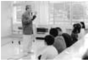
子供たちに色々な話をしてくれました