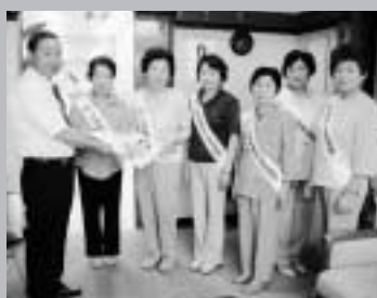
これからも頑張ってください

施。役場や村内の保育園・小中学校を訪問し子供たちの健全な成長を願ってメッセージと人形を贈りました。