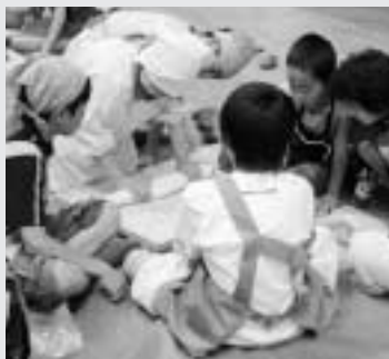
うどん作りを指導

7月4日には横浜市の小学校の児童に推進員2人がうどん作りを指導。初めてのうどん作りで興味津々の児童らに、丁寧にうどんの打ち方を教えていました。