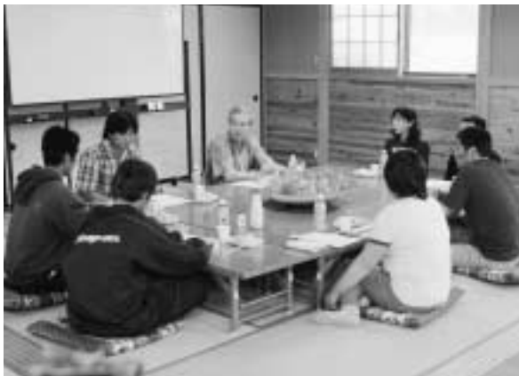
知事を囲んで話し合い