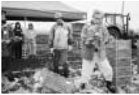
レタスの収穫に挑戦する知事