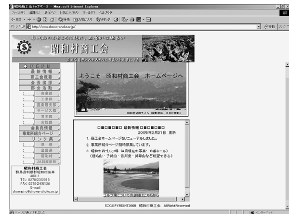
新しくなったホームページ