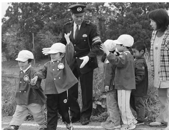
手を上げて横断歩道を渡りましょう（第二保）