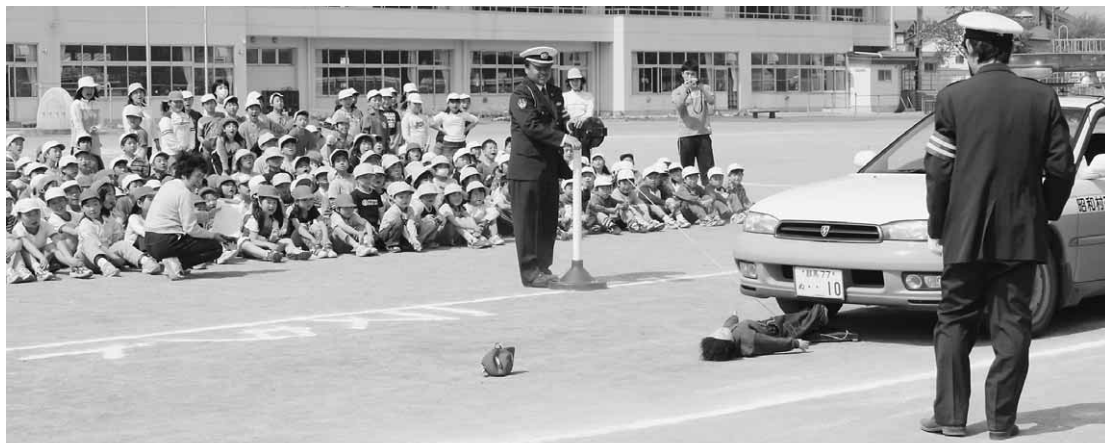
人形を使って衝突の実演（南小）