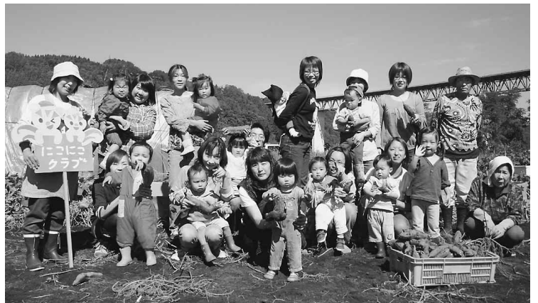
いっぱいさつまいもを掘りました