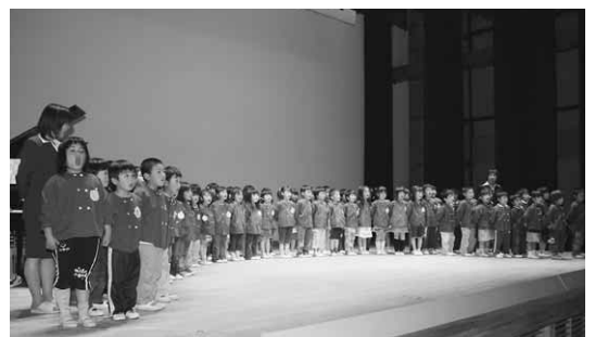
村内保育園の園児による大合唱

体に気を付け、健康な社会人として地域社会に恩返しができるよう努めていきたいと思っています」と語りました。 式典後は、アトラクションとして、村内保育園児が合唱を、村文化協会が舞踊を披露。招待者は、かわいいうちや見事な舞踊に惜しみない拍手をおくっていました。 また、帰りには村ヘルスメイトの手作りまんじゅうがのみやげとして配られました。