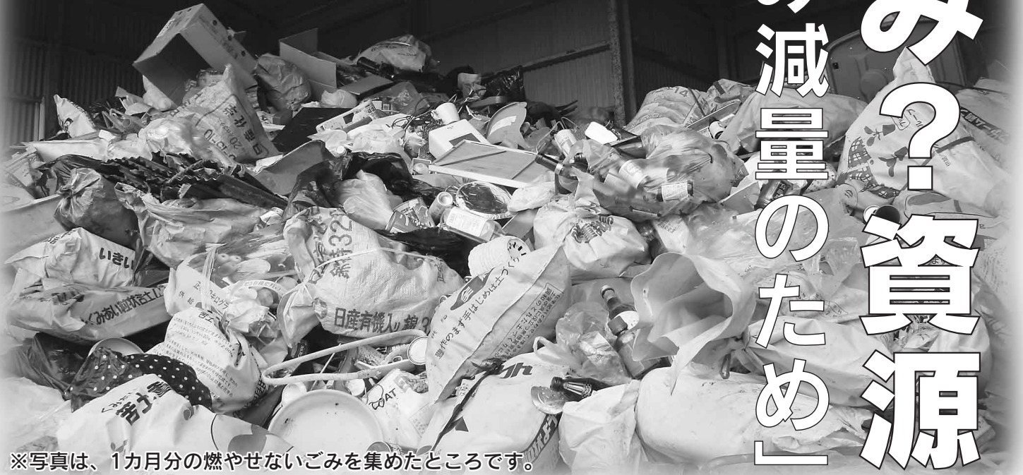
※写真は、1カ月分の燃やせないごみを集めたところです。