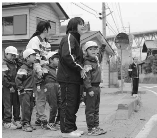
右を見て、左を見て（東小）